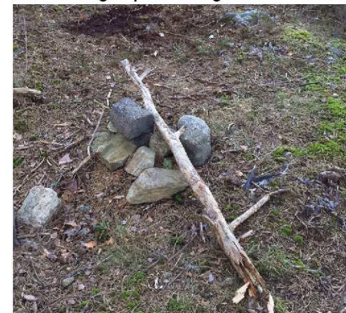
Samling - spår efter lek