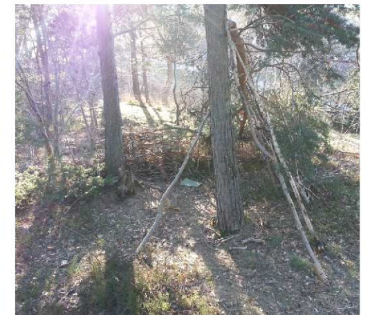
Koja i skogsdungen - spår efter lek