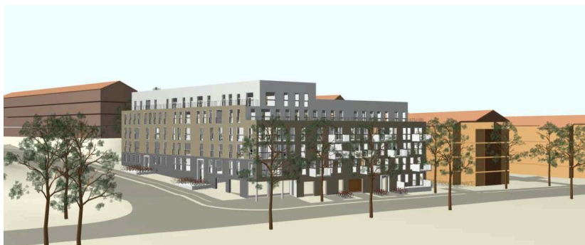
Föreslagen exploatering, vy från sydväst, Nytorps gärde.