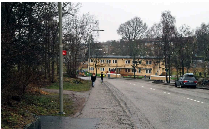
Planområdet från norr, med Malmövägen som leder ner mot Ystadsvägen.

I Björkhagens centrum finns service i form av vårdcentral, livsmedelsbutik, bibliotek med mera. På Nytorps gärde, intill korsningen Malmövägen/Ystadsvägen, ligger den kommunala förskolan Björken med cirka 70 platser. Björkhagens skola, på cirka tio minuters gångavstånd, har årskurserna förskola till årskurs nio.