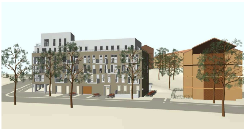
Föreslagen bebyggelse, vy från sydöst, Nytorps gärde.