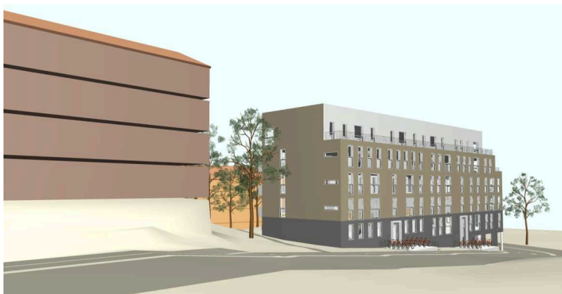
Föreslagen bebyggelse, vy från nordöst, Malmövägen.