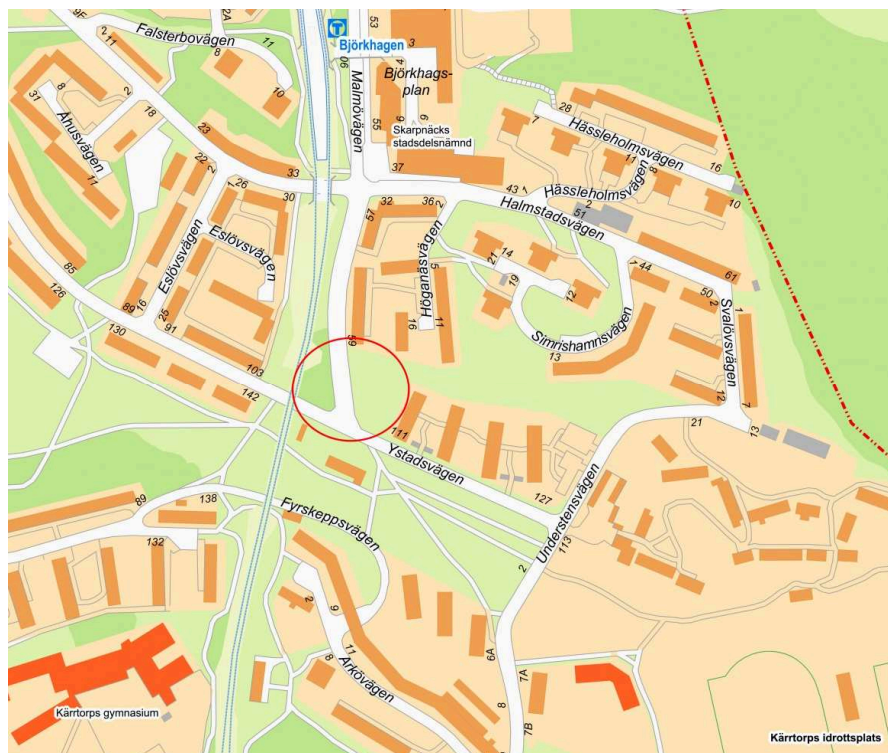
Översiktskarta: Ungefärliga avgränsningen av planområdet är inringat i rött.