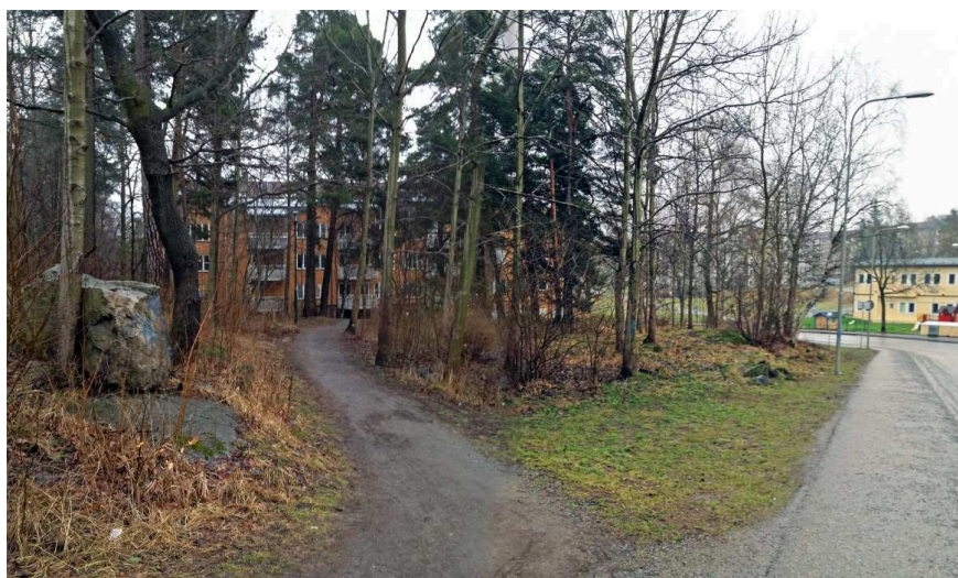
Planområdet från norr, med gångstigen som leder genom skogsområdet.

Parken Nytorps gärde, som ligger i direkt anslutning till planområdet på andra sidan Ystadsvägen, är mycket populär tack vare sina stora ytor, centrala läge och fria karaktär. Den används för evenemang, promenader, lek med mera. Nytorps Gärdes kvaliteter utvecklas i programhandlingarna.