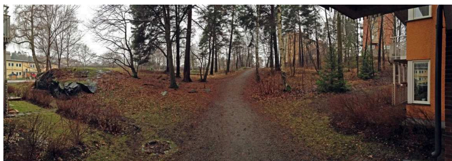
Planområdet från intilliggande fastighet i öster.

Lekplatser finns på flera håll inom närområdet, bland annat på Nytorps gärde.