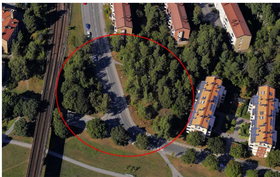
Ungefärlig avgränsning av planområdet.

Området bedöms vara bullerstört på grund av närheten till tunnelbanan.