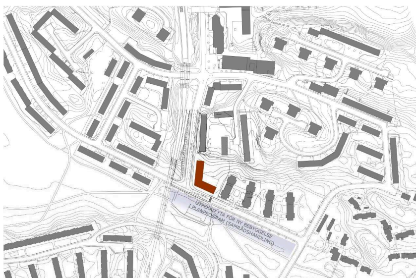
Föreslagen volym i förhållande till omgivande struktur, inklusive område på Nytorps Gärde som är utpekad för bebyggelse i pågående arbetet med Planprogram för Hammarbyhöjden/Björkhagen.