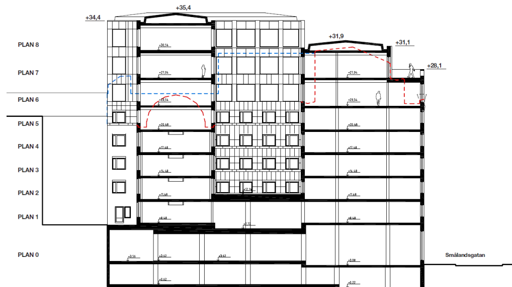
Sektion mellan Skären 3 och Smålandsgatan. Röd linje markerar befintlig byggnad, Skären 9, i sektion och blå linje visar befintlig byggnad, Skären 9 i vy. Bild: General Architecture.

Föreslagen påbyggnad på Skären 9 har anpassats till befintlig bebyggelse i utformning och skala. En utgångspunkt i gestaltningen har varit att tillsammans med befintlig bebyggelse skapa en ny helhet.