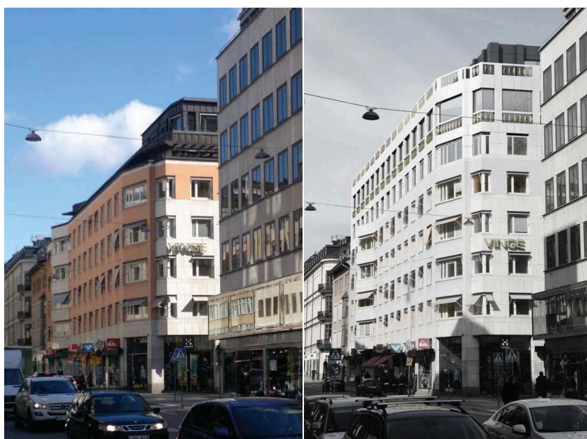
Till vänster: Befintlig byggnad sedd söderifrån från Norrlandsgatan. Till höger: Föreslagen påbyggnad sedd söderifrån från Norrlandsgatan. Bild: General Architecture.

Idag finns fläkttrum och utrymmen för tekniska anläggningar på taket till kontorsbyggnaden. Den föreslagna påbyggnaden innebär att dessa utrymmen ersätts av kontorsutrymmen och att totalhöjden förblir ungefär den samma mot Smålandsgatan. Takfoten höjs med en våning mot Smålandsgatan. Mot Norrlandsgatan höjs totalhöjden med en våning och takfoten med två våningar jämfört med idag. Gårdsflygeln byggs på med tre våningar och ges ett nytt flackare