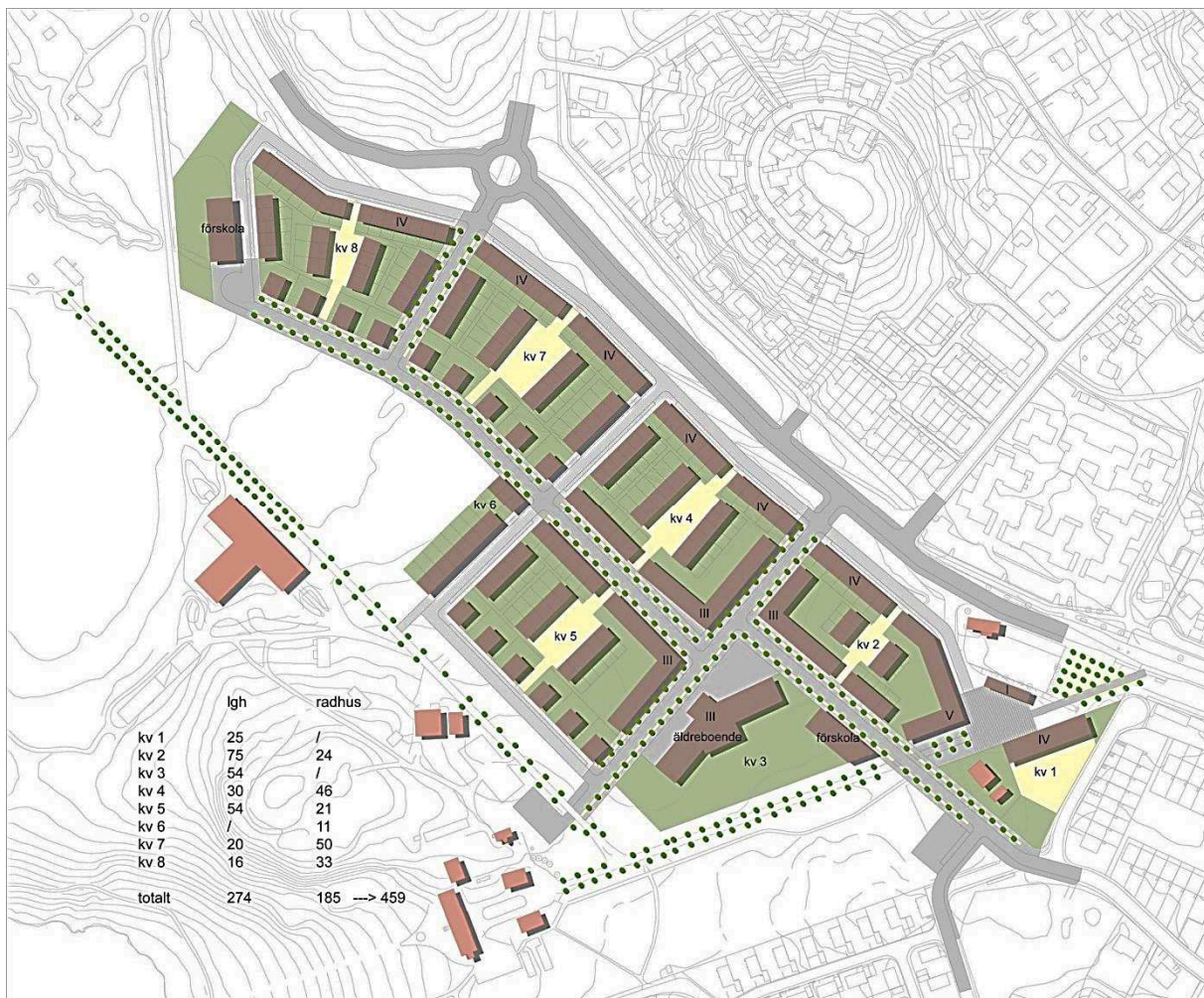
Bearbetat förslag till strukturplan