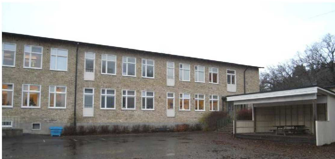
Nedan: Den östra fasaden in mot skolgården är öppnare med större och fler fönster. Franska fönster skapar ytterligare öppenhet mot skolgården.