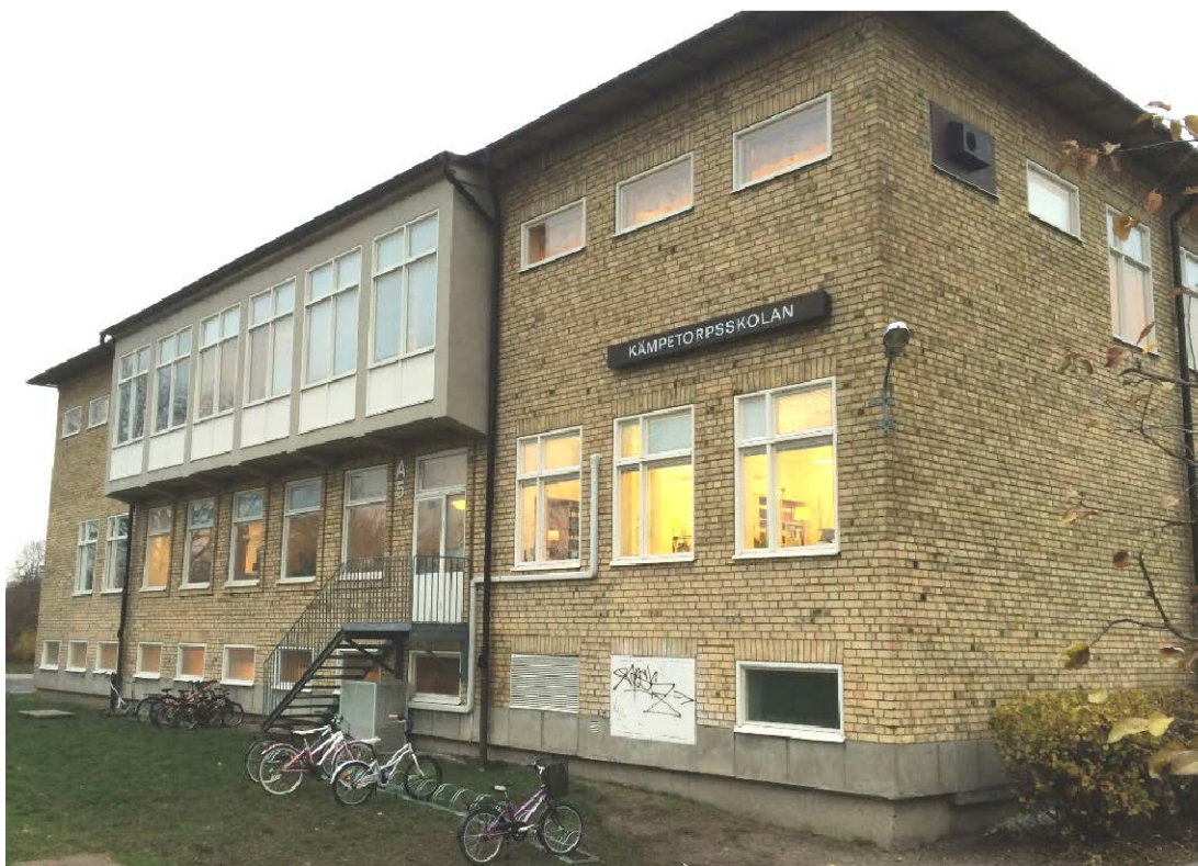
Huvudfasaden mot sydväst och Älvsjövägen