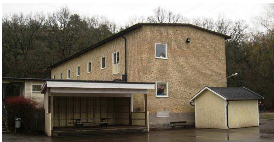
Överst: klassrumsbyggnaden från öster. Ovan: klassrumsbyggnaden taget från skolgården i söder.