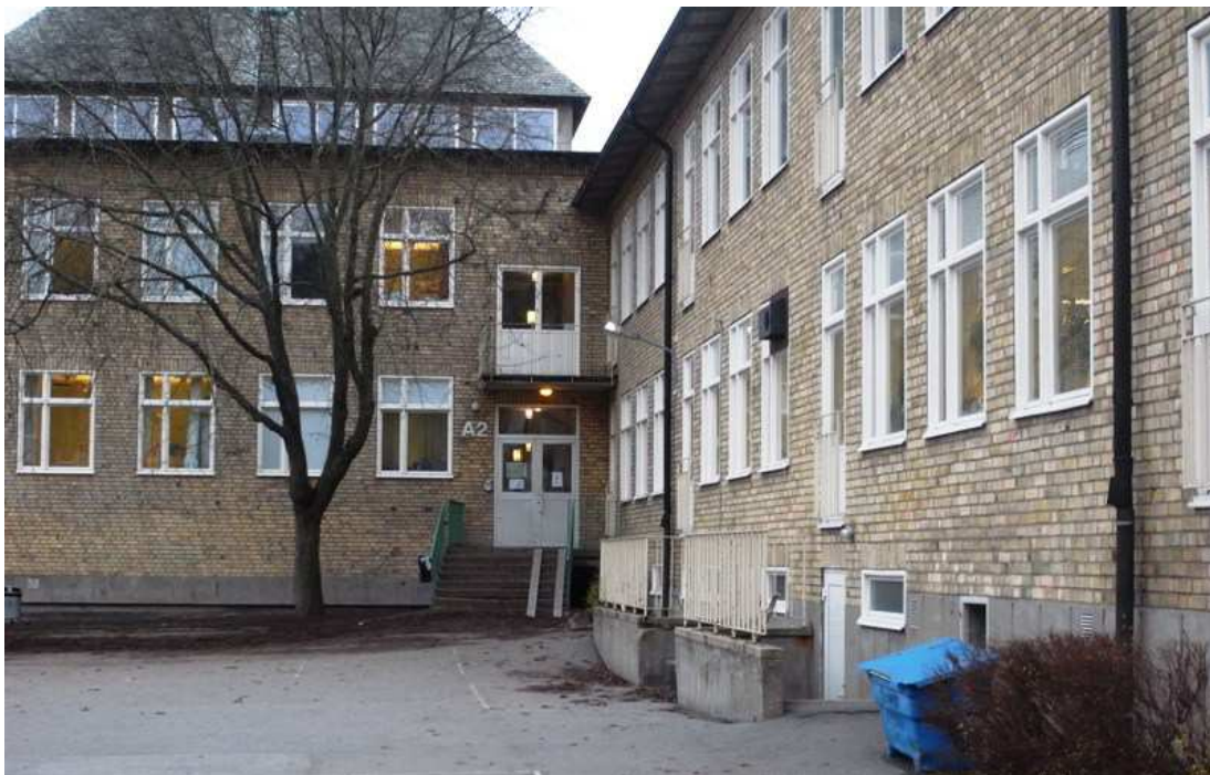
A-huset till vänster i mötet med F-huset, från gårdssidan

Den nya byggnadens utbredning påverkar framför allt A-husets rumslighet i stadsmiljön. A-huset kommer inte längre få en lika framträdande roll vare sig på skolområdet eller i närmiljön. Den riskerar att förlora sin status som huvudbyggnad.