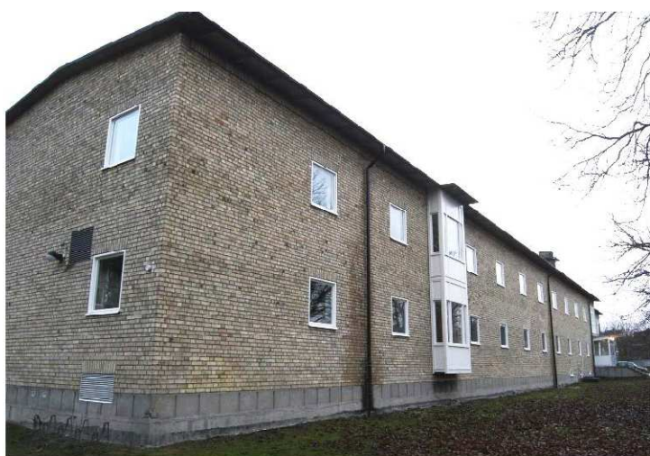
Vänster: F-husets västra långsida mot småhusområdet. Fasaden har färre och mindre fönster här.

Den föreslagna tillbyggnaden kommer att förändra fasadbilden och intrycket av skolan mot väster och småhusområdet. Mot den riktningen består skolan idag av huvudbyggnaden och den långa tvåvåningslängan. Den nya byggnaden är en avsevärt större volym i tre våningar som kommer fylla både gattet mellan F-huset och ytan där vaktmästarbostaden är belägen. Resultatet blir att den samlade byggnadsvolymen mot väster blir längre och i norr också betydligt större.