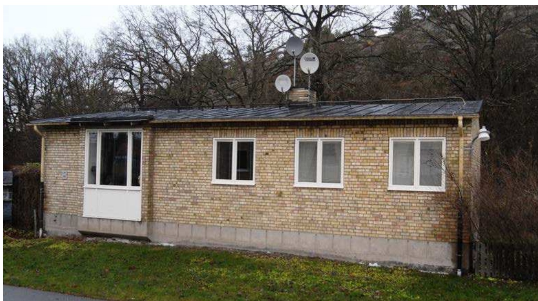
Överst: vaktmästarbostaden sett från söder mellan klassrumsbyggnaderna. Ovan: skolbyggnadernas relation till vaktmästarbostaden.