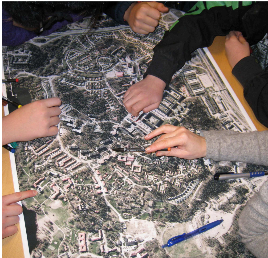
Fokusgruppintervju på Sköndalsskolan.

Barnen var genomgående mycket aktiva i diskussionerna och positiva till att bidra med information om deras aktiviteter och rörelsemönster, samt erfarenheter och uppfattningar om Sköndal.