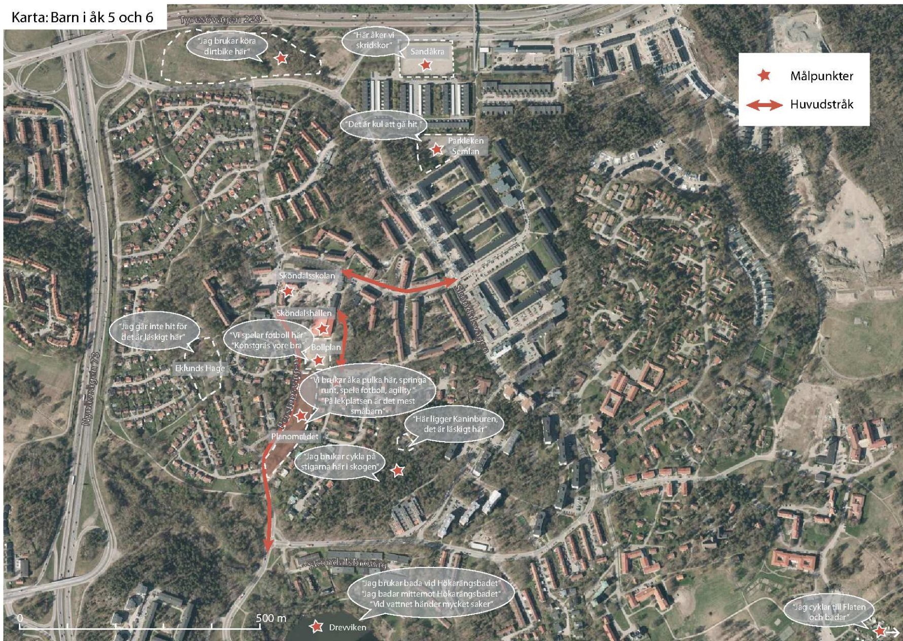
Karta: Barn i åk 5 och 6