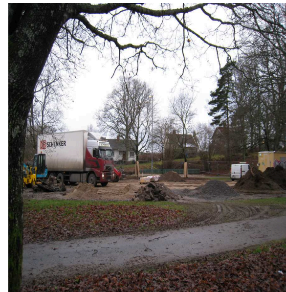
Eklunds Hage under upprustning.

Barnen beskriver samstämmigt den befintliga parken som "ofräsch" och "sliten" och uppger att de känner sig otrygga där. Fler av barnen uppger till och med att de gått omvägar för att slippa passera igenom parken. Av dessa anledningar leker heller ingen av barnen