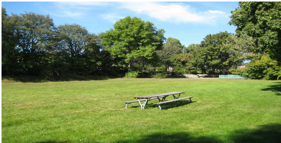
Gräsyta inom planområdet.

utnyttjades bättre genom att utveckla vandringsstigar och olika typer av utmanande cykelbanor. Det finns en dirt-bike bana som ligger mellan Tyresövägen och Sköndalsvägen som är uppskattad av flera av de intervjuade barnen, men som enligt dem skulle behöva ses över och underhållas bättre.