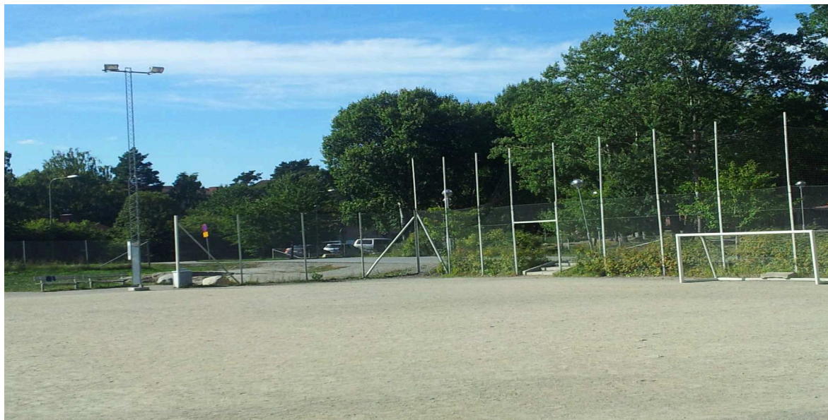
Bollplanen vid Sköndalsskolan.

”Det vore jättebra om det blev konstgräs om de kan fortsätta spola is på vintern också!” – Pojke årskurs 6.