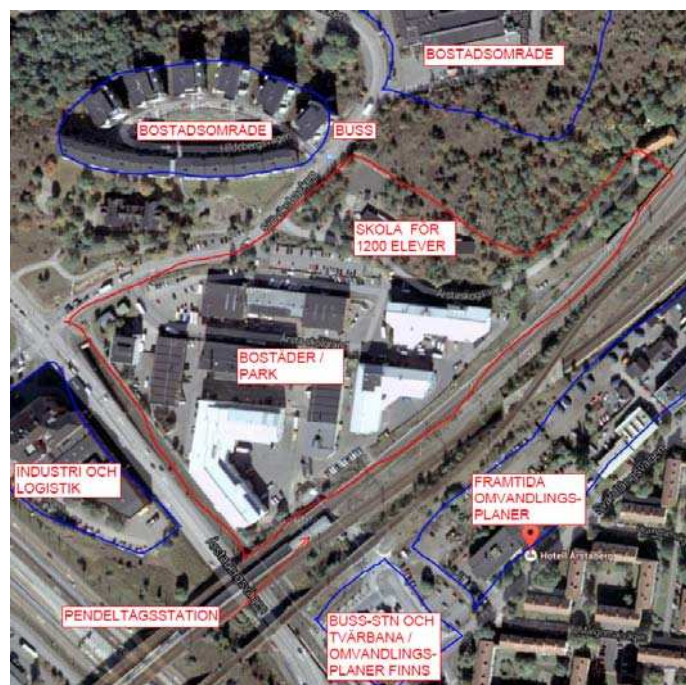
Figur 2: Översikt och illustrationsplan för planområdet

Planområdet kommer att byggas ut successivt. Skolan kommer att byggas i första skedet. Verksamhetsområdet kommer efter hand ersättas med bostadsbebyggelse och en park i områdets centrala del.