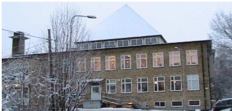
Foto på Kämpetorpsskolans huvudbyggnad, ritad av Paul Hedqvist.

Kämpetorpsskolan är ritad av Paul Hedqvist och stod klar 1952. Byggnaderna är grönklassade (fastighet/fastigheter med bebyggelse som är särskilt värdefull från historisk, kultuhistorisk, miljömässig eller konstnärlig synpunkt) enligt stadsmuseet. Byggnaden är uppförd i gult tegel med en karaktäristisk taklanternin. Därtill finns en gymnastiksal samt förskolepaviljonger.