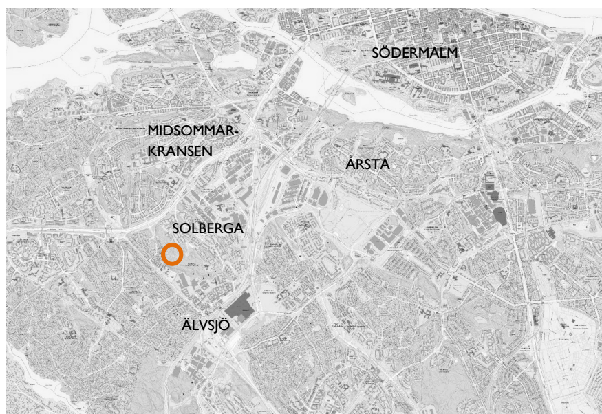
Orienteringskarta med planområdet markerat.

Området är ca 3,6 ha stort och ägs av Stockholm stad.