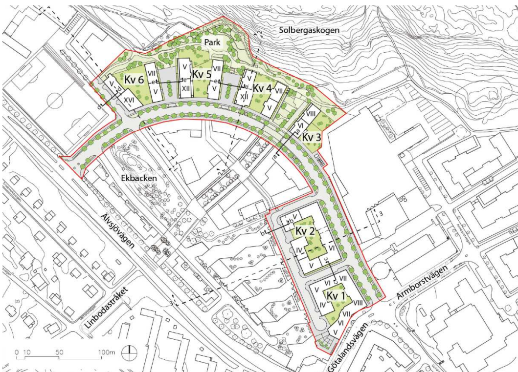
Strukturplan över planområdet, etapp 1. Bild: Rosenbergs arkitekter

Målsättningen är att skapa en attraktiv stadsdel med en god arkitektur och en levande boendemiljö. Närheten till Älvsjö centrum och blandningen av bostäder, verksamhetslokaler och arbetsplatser som bidrar till att ge området stadsqualiteter, samtidigt som det upplevs naturnära med en god tillgång till parker och rekreativsmöjligheter.