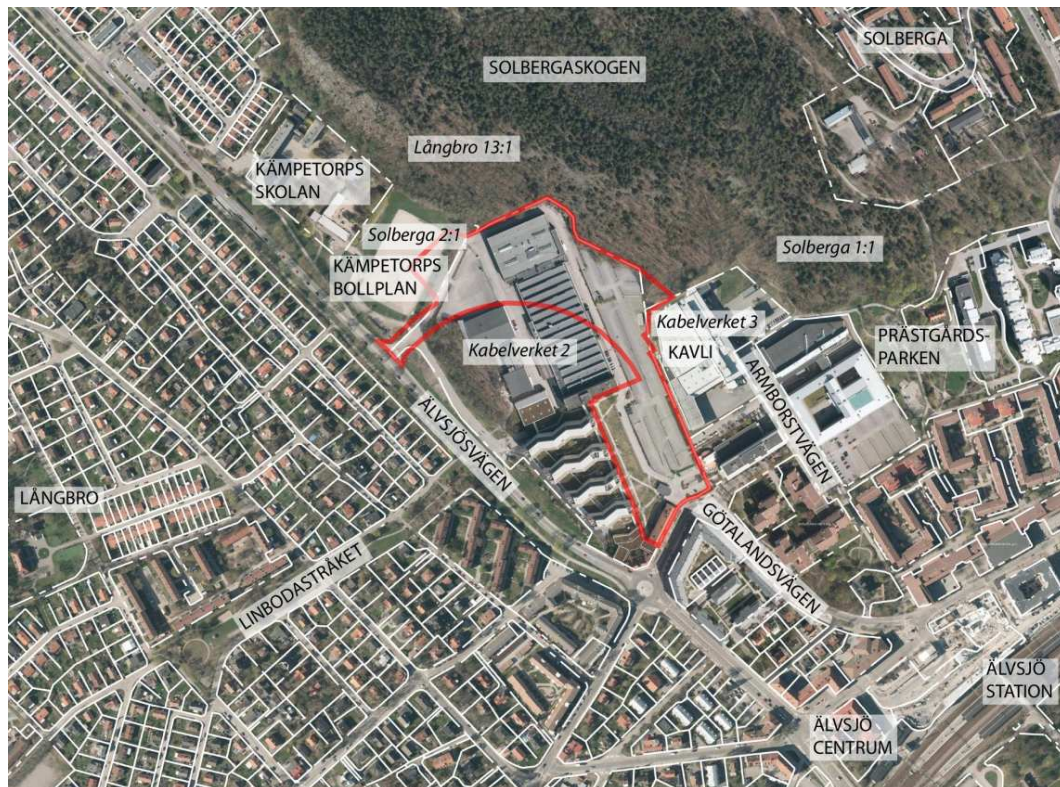
Planområdesavgränsning markerat i rött.

Planområdet ligger i nära anslutning till Älvsjö centrum, i stadsdelen Solberga. Planområdet är cirka 4,3 ha stort och omfattar fastigheterna Kabelverket 2 samt del av fastigheterna Kabelverket 3, Solberga 1:1 och 2:1 samt Långbro 13:1. Kabelverket 2 ägs av Valad Sweden AB genom Fastighets AB Nätverket. Kabelverket 3 ägs av O. Kavli AB. Övriga fastigheter ägs av Stockholms stad.