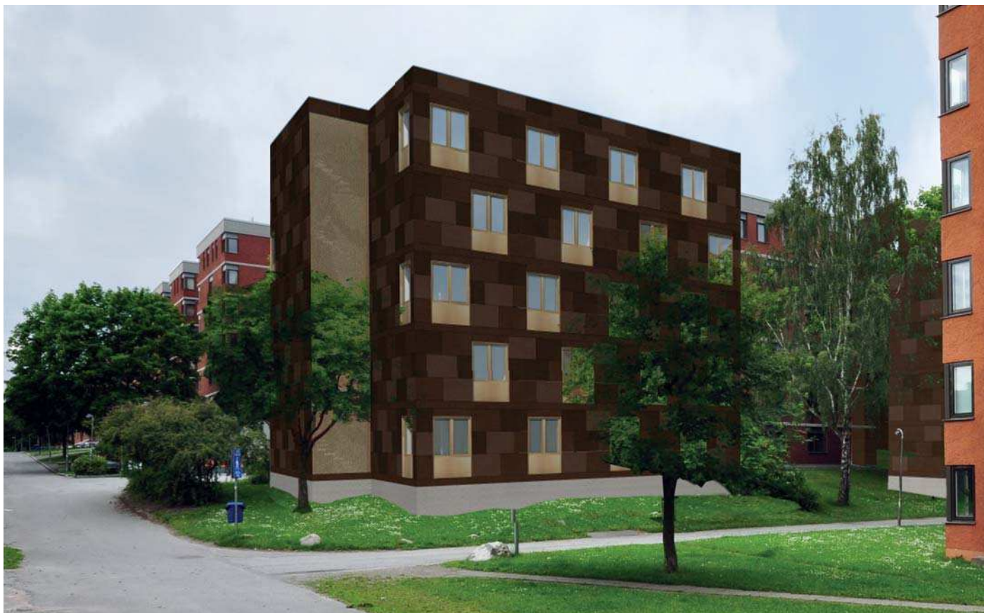
Vy 6, Hus 9:2