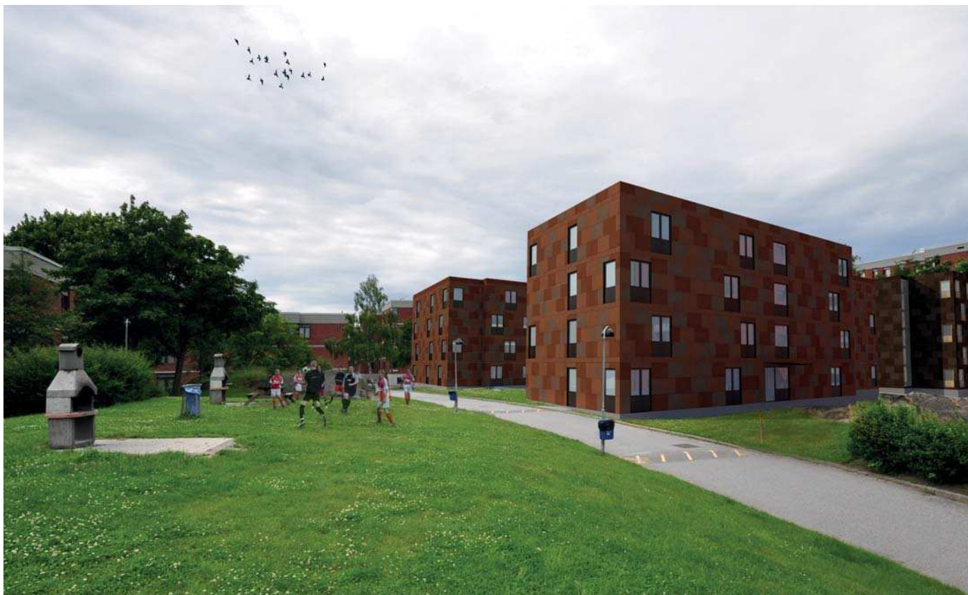
Vy 5, Hus 15:1-2