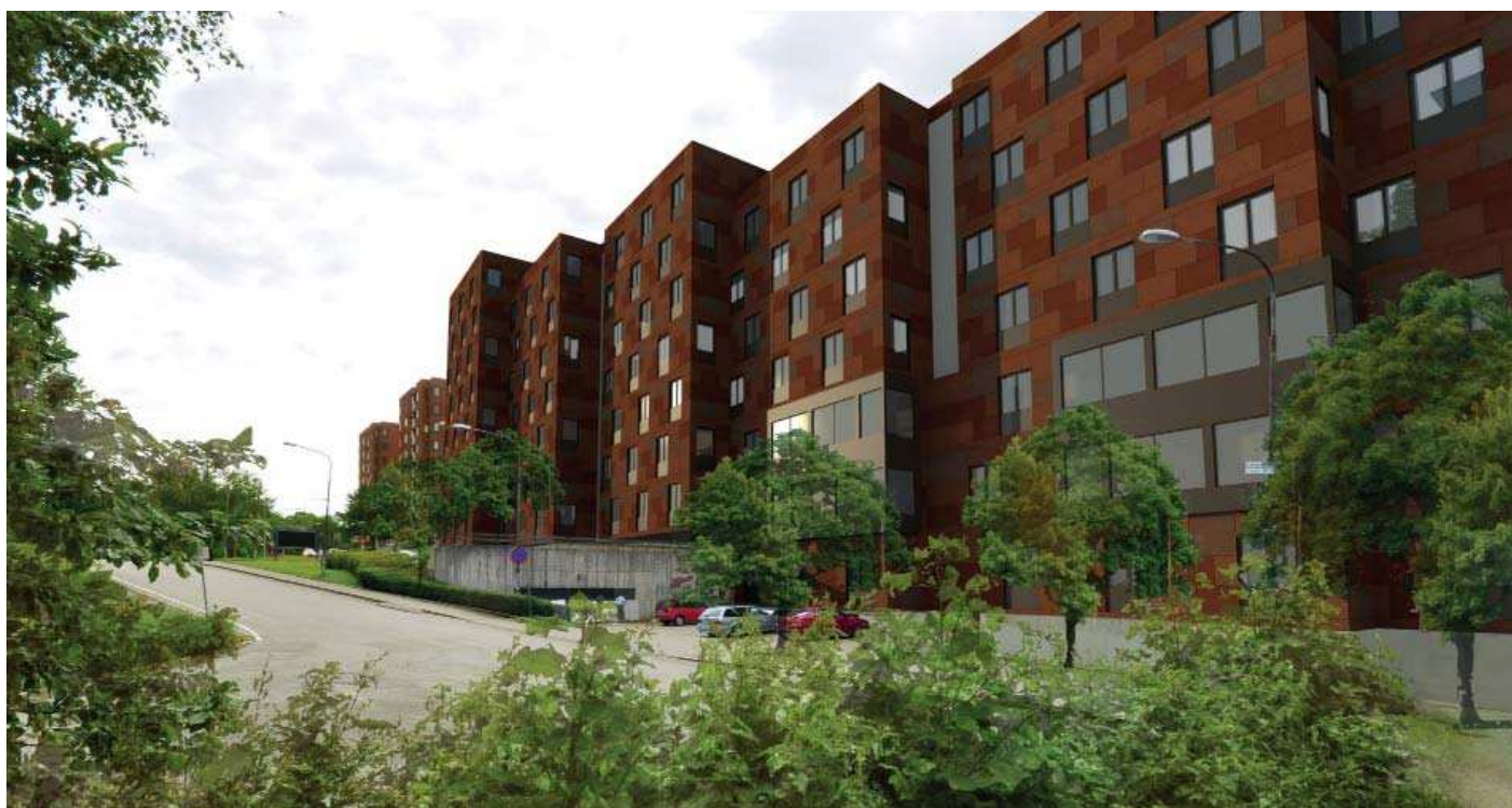
Vy 9, Hus 34:1-4