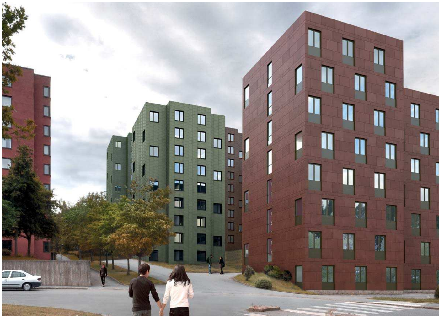
Vy 8, Hus 33:1-3