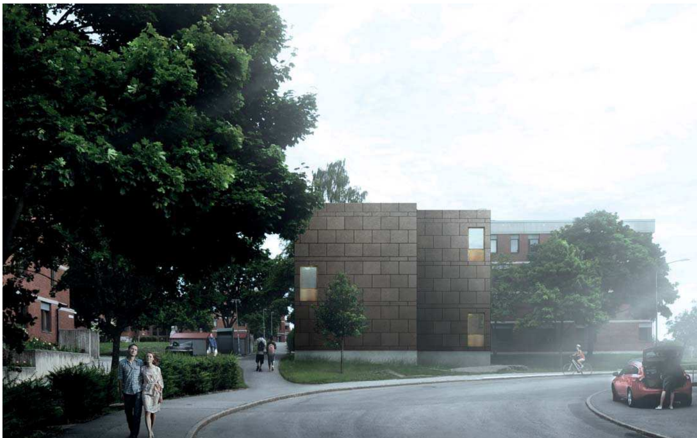
Vy 2, Hus 16:1