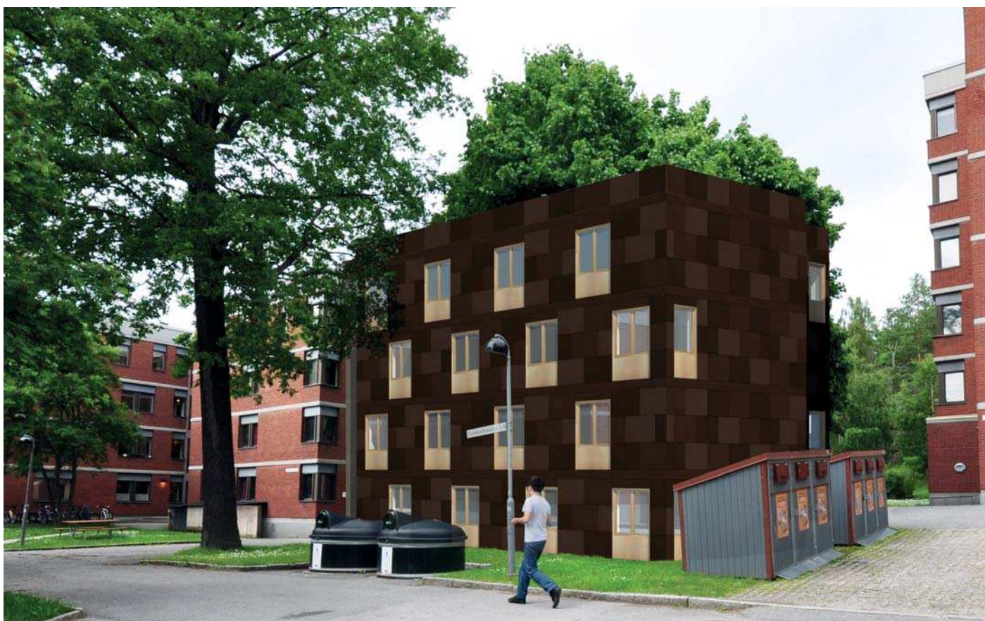
Vy 3, Hus 1:2