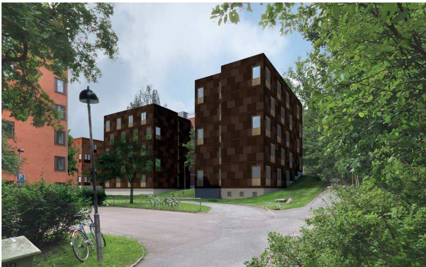
Vy 7, Hus 9:1