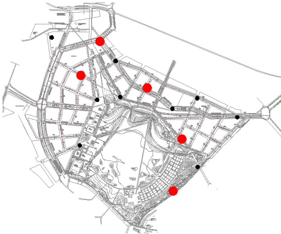
Figur 1. Kolvprovtagningarnas placering jämfört med planerad landskapsutformning och vägar. I svarta punkter har CRS-försök och sättningsberäkningar utförts och i röda punkter har även kalkcement-inblandningsförsök utförts.

av temporär grundvattenavsänkning, vilket blir aktuellt bl.a. för byggande av den djupt för-lagda va-kulverten. Provpumpning och utvärdering pågår.