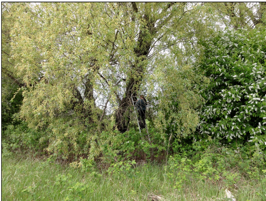
Figur 1. I pilallén finns även ett rikt buskskikt med bland annat hägg, snöbär och fläder. På bilden monteras fälla nummer två.

Flest arter (och antal individer av dessa) som tidigare varit rödlistade förekom i norra delen av allén där träden står som mest solexponerat.