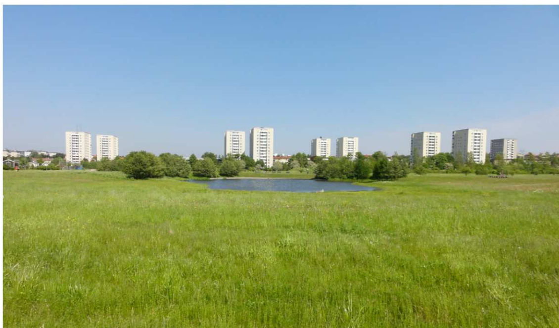
Figur 1. Dammen från söder. De flesta håvningarna utfördes till vänster i bilden, längs den västra stranden.

Valla å, sydost om dammen, var mindre lättarbetad än 2004 beroende på minskat flöde och lägre vattennivå. Ytterligare en mindre damm, inne på golfbanan, besöktes i slutet av sommaren. I slutet av augusti var den helt torrlagd, och inga resultat kunde fås från platsen.