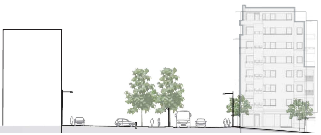
Sektion Nya Hjulstavägen

Personintensiva verksamheter är inte lämpligt att anlägga på tunneltaket. Med personintensiva verksamheter avses samlingslokaler, biografier, restauranger, bostäder, kontor etc. Ett mindre omklädningsrum, tvättstuga, parkering, bollplan, park med plantering eller dylikt bedöms inte vara personintensiva verksamheter. Inom 20 meter från tunnelymningarna får inga byggnader med stadigvarande vistelse uppföras. Parkeringsgarage, förråd eller liknande ej personintensiva verksamheter kan anläggas vid mynningsarna. Placeras byggnader närmare än 8 meter från tunnelymningarna ska konstruktionen utföras med rasdämpande konstruktion enligt avsnitt Farligt Gods i planbeskrivningen.