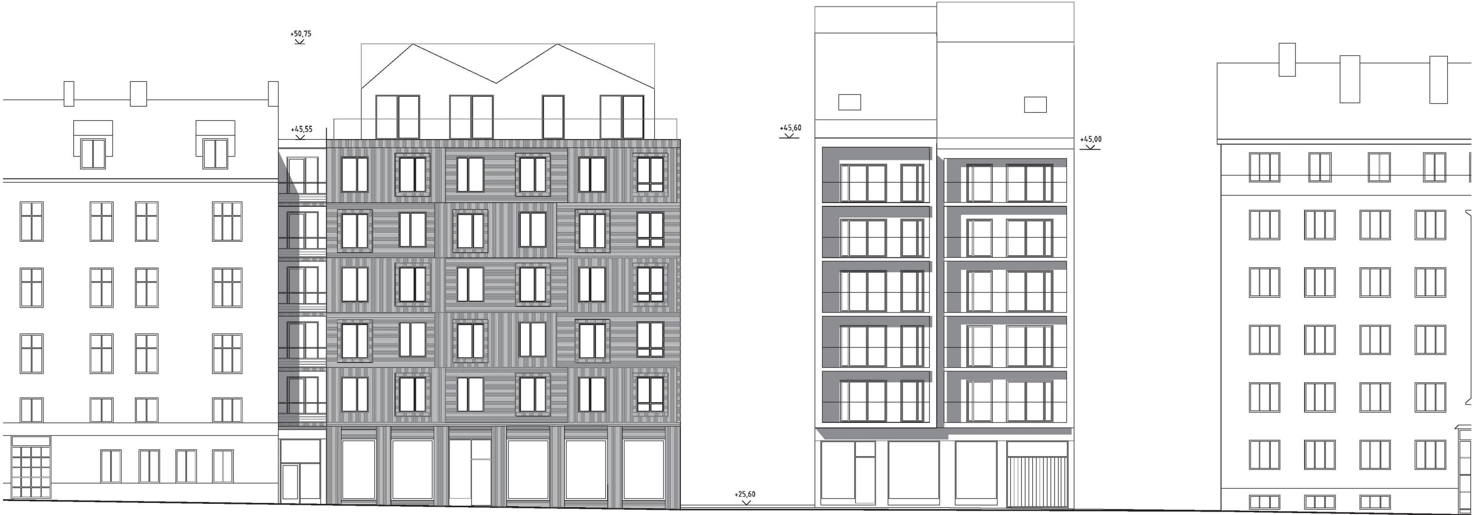
FASAD MOT NORR 1:200

Inkom till Stockholms stadsbyggnadskontor - 2013-02-21, Dnr 2007-36068