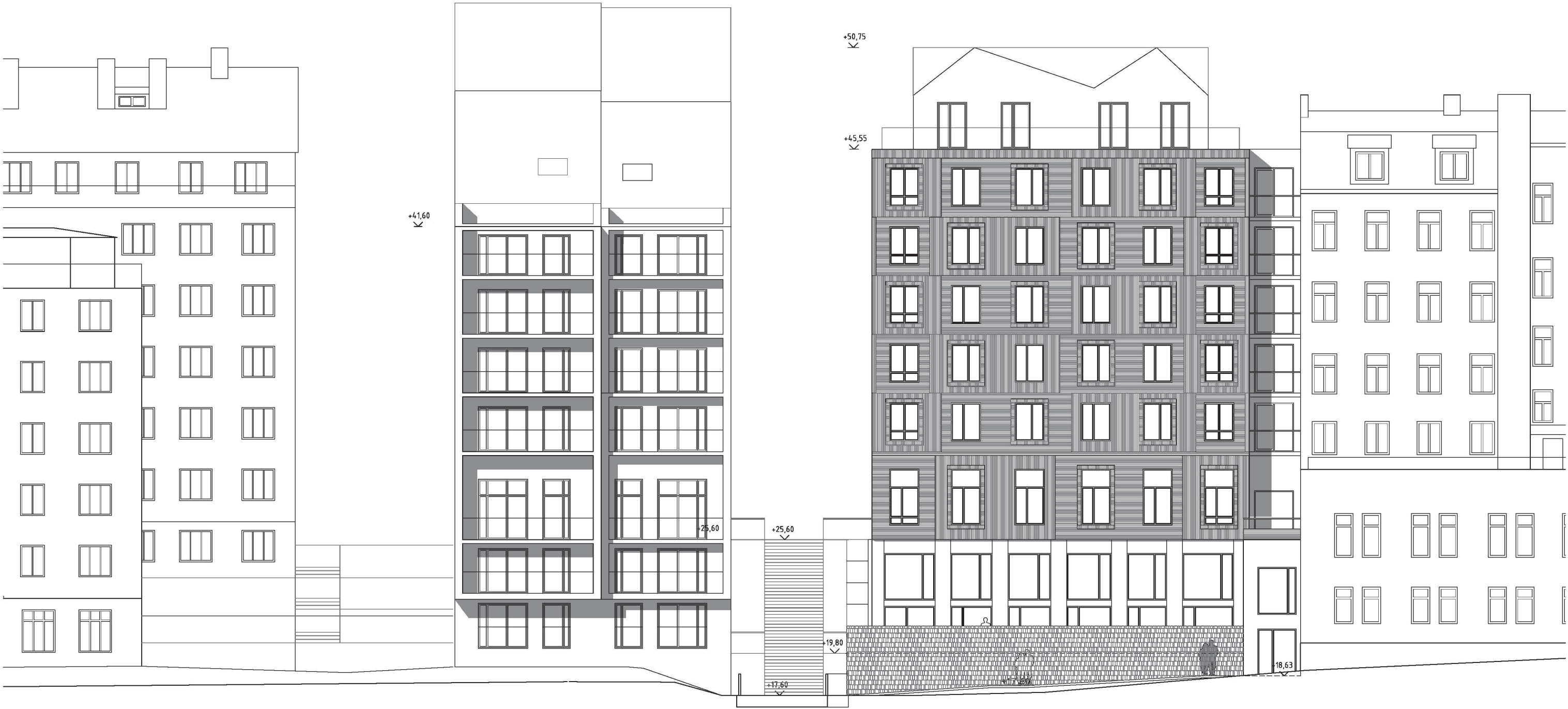
FASAD MOT SÖDER 1:200

Inkom till Stockholms stadsbyggnadskontor - 2013-02-21, Dnr 2007-36068