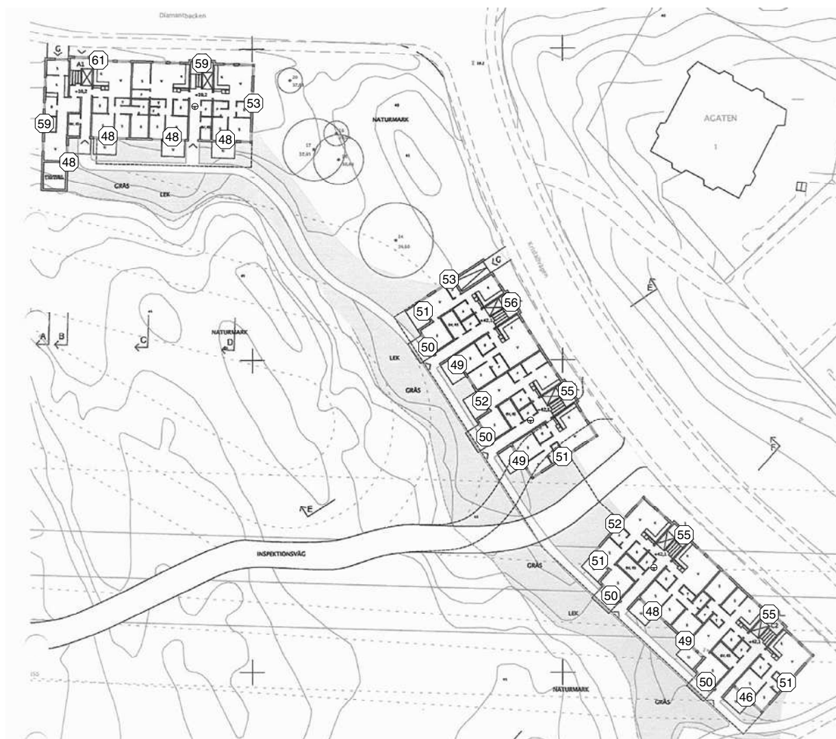
Figur 1 a

Ekvivalent ljudnivå, dBA, entréplan. Utan skärmande åtgärder.