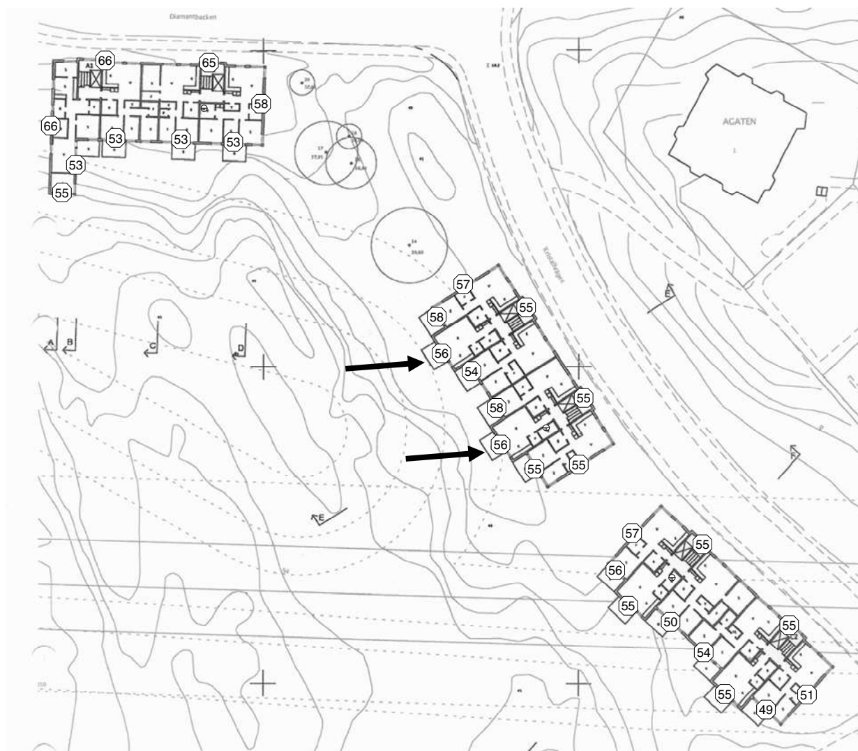
Figur 1 d

Ekvivalent ljudnivå, dBA, plan 3 tr. Utan skärmande åtgärder.