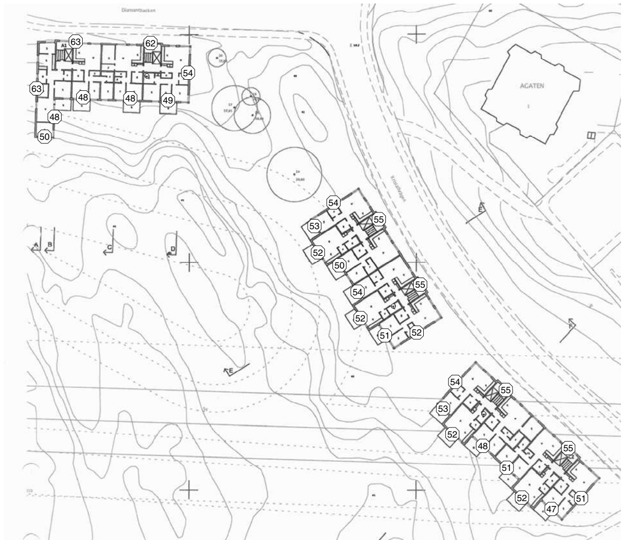
Figur 1 b

Ekvivalent ljudnivå, dBA, plan 1 tr. Utan skärmande åtgärder.