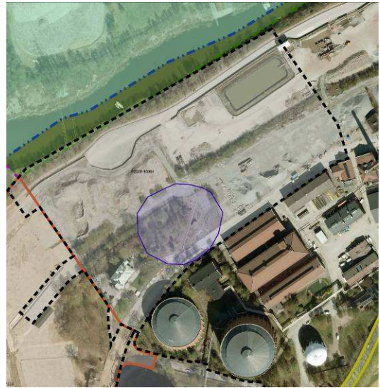
Ringens mitt i bilden markerar fornlämningen inom detaljplaneområdet.

Inom planområdet återfinns en fornlämning, RAÄ 184:1. En arkeologisk utredning är utförd av stadsmuseet utifrån Länsstyrelsens beslut. Denna är sänd till Länsstyrelsen för vidare behandling och beslut. Fornlämningen betecknas i fornlämningsregistret som en övrig kulturhistorisk lämning och utgörs av en plats för en eventuell bebyggelse/bytomt/gårdstomt: "På angiven plats är på Bratts karta en cirkelrund markering på ett dåtida mindre berg. Intill är beteckningen "Rudera". Detta bör hänsyfta på någon typ av anläggning. Möjligen kan byn Husarne ha varit belägen här" . Gården skulle därmed kunna ingå i det system av s.k. Husbygårdar från tidig medeltid.