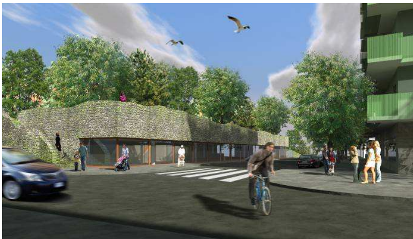
Perspektiv över den planerade förskolan och Kontorsparken som sträcker sig över dess tak. Bild: Vera arkitekter.

Kontorsparken har kulturhistoriskt värde för gasverksområdet som helhet. Parken planeras att rustas upp och gallras. I väster ska parkens karaktär med grusade gångar, stora parkträd och fruktträd bevaras och utvecklas (vilket regleras med planbestämmelse q1), medan den östra delen behåller sin mer naturlika karaktär. I anslutning till en sänka i den nordöstra delen av parken planeras en friliggande förskola. Den vegetationen som finns i sänkan idag utgörs till största del av ruderväxter.