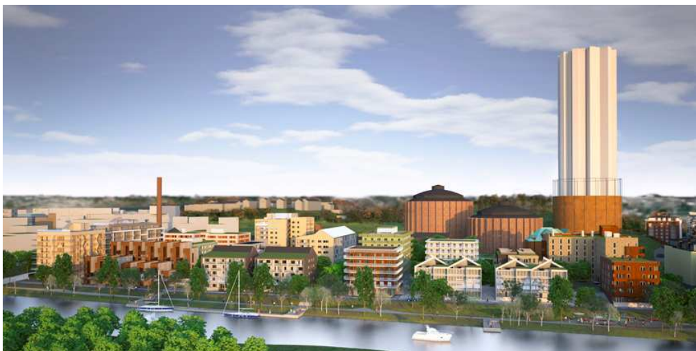
Montage över bebyggelsen. Bild: BSK Arkitekter.

att möjliggöra lokaler för offentlig eller kommersiell service i vissa lägen, samt för en tydlig sockelverkan i bebyggelsen.