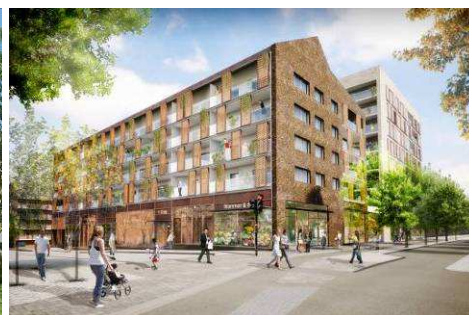
Exempel av föreslagen bebyggelse. Uppifrån från vänster: NCC - Brunnberg&Forshed arkitektkontor, ViktorHanson - Joliark, Wallenstam – Vera arkitekter, Stockholms hem – Tengbom arkitekter. För ytterligare beskrivning och illustrationer hänvisas till illustrationsbilagan.