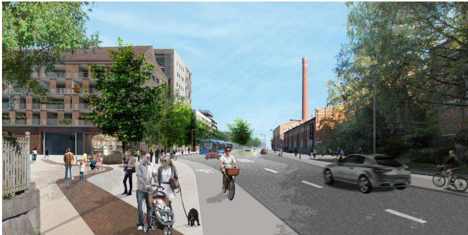
Perspektiv längs huvudgata, Erik Dahlbergsgatan. Bild: Andersson Jönsson Landskapsarkitekter.

Planområdet inkluderar i söder den framtida huvudgatan genom gasverksområdet, benämnd Erik Dahlbergsgatan. Denna utformas som en esplanadgata med bredare trottoarer, 2 meter breda och enkelriktade cykelbanor, trädplanteringar, parkering och körfält. Gatans bredd och utformning medger att en framtida stadsspårväg skulle kunna dras här och förbättra tillgången till kollektivtrafik ytterligare. Vid en sådan lösning dras spåren i delad körbana med bil och buss. Huvudgatans totala bredd i snittet som inkluderas i denna detaljplan är cirka 32 meter. Österut varierar gatans bredd med anledning av den befintliga bebyggelsens lokalisering. Mellan Kontorsparken och tegelgasklockorna med dess klockpark bevaras den befintliga gatusektionens bredd och miljön därkring. Längs gasverksområdet återfinns trädplantering på den norra sidan gatan, mot ny bebyggelse samt i mitten av gatan. På den södra sidan, mot befintlig gasverksbebyggelse finns inte någon alléplantering med träd för att framhäva den befintliga bebyggelsen och dess industrikaraktär.