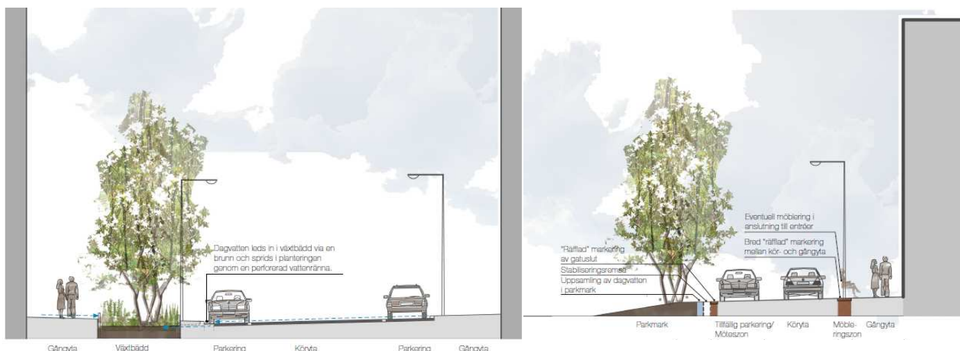
Föreslagna gatussektioner i området, till vänster en tvärgående kvartersgata, till höger Husarviksgatan.