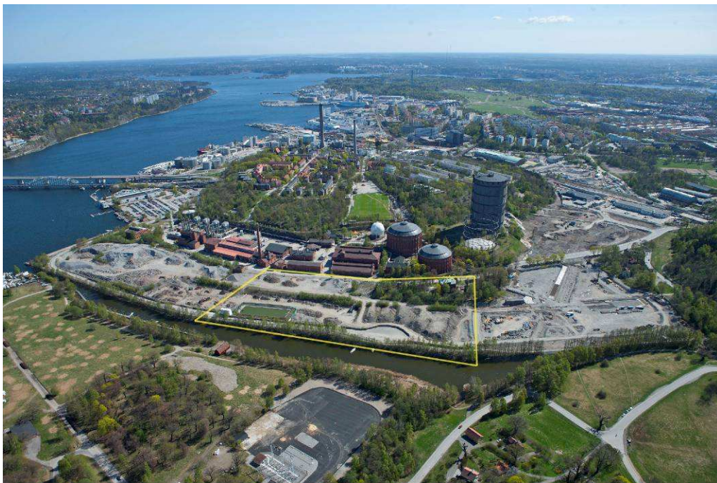
Flygfoto över utvecklingsområdet, april 2011. Planområdet lokaliserat mitt i bilden.