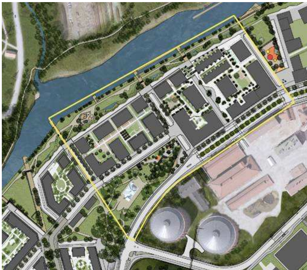
Illustrationsplan för planområdet. Bild: Andersson Jönsson Landskapsarkitekter.

rekreationsmöjligheter. Miljön ska vara urban med en unik karaktär, präglad av mångfald.