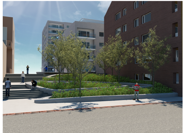
Vyer över gårdstorget från söder samt från norr.