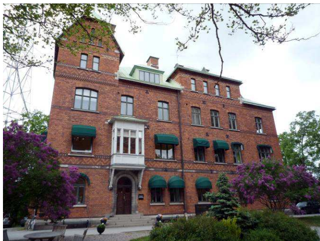
Det befintliga kontorshuset.

Bottenvåningen får ej användas som bostad i enlighet med husets ursprungliga användning samt för att motverka att kontorsparken eller delar av den privatiseras. Vid ändring bör den antikvariska förundersökningen för gasverket