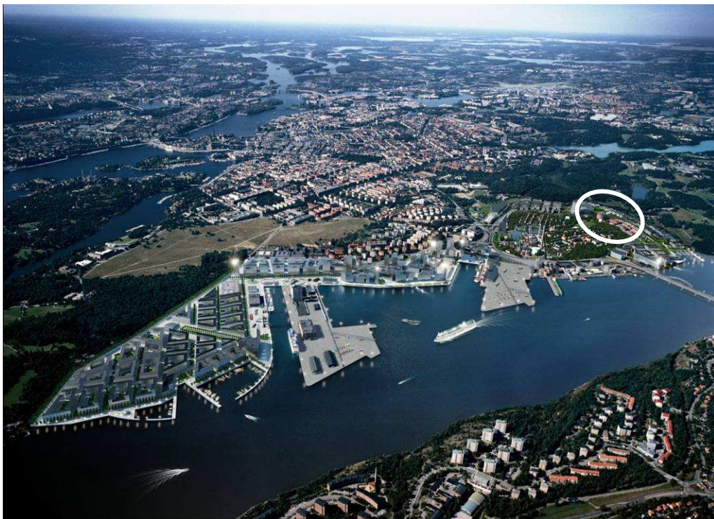
Visionsbild för stadsutvecklingsområdet. Planområdets ungefärliga läge markeras med ring.

I programmet och stadsbyggnadsnämndens beslut anges att området kring Hjorthagen ska användas för bostadsbebyggelse, med lokaler för kommersiell och social service i bottenvåningar. Området beräknas innehålla ca 5000 lägenheter i blandad bebyggelse med lokaler för verksamheter och annan offentlig service. Gator och torg planteras med träd och gröna bostadsgårdar eftersträvas. De befintliga parkerna som gränsar till området ska rustas upp och anpassas till de krav som den nya bebyggelsen medför. Längs Husarviken etableras en cirka 25 meter bred grön zon bestående av befintlig och ny vegetation. Arkitekturens karaktär ska väljas med hänsyn till platsen och angränsande arbetsplatser, institutioner och service vara av sådana slag som är lämpliga med hänsyn till byggnadernas kulturhistoriska värden.