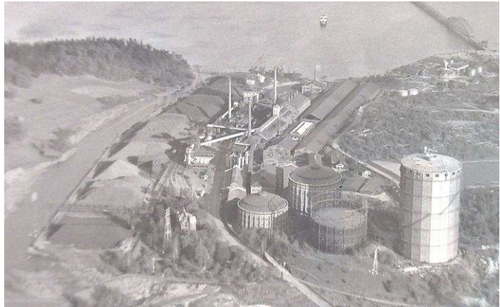
Fotografi över gasverket, taget ca 1930-tal.

I och med att de stora öppna ytor inte längre brukades lika intensivt etablerades en del vegetation spontant och området förändrades till ett ruderalområde. Staden har sedan några år tillbaka använt delar av planområdet för rening av markmassor från närområdet, bland annat från etapp 1 Norra Djurgårdsstaden. Viss markbearbetning och markförändringar samt borttagande av vegetation har därför skett. All industriverksamhet i anslutning till planområdet kommer att avvecklas innan inflyttning. Enligt avtal mellan Fortum och staden har avvecklingen av gasproduktionen startat och all verksamhet inom gasverksområdet kommer att avvecklas senast 2013. Inom planområdet ingår även gasverkets kontorshus och delar av kontorsparken, båda kulturhistoriskt värdefulla. Kontorshuset har från dess uppförande använts för kontors- och bostadsändamål.