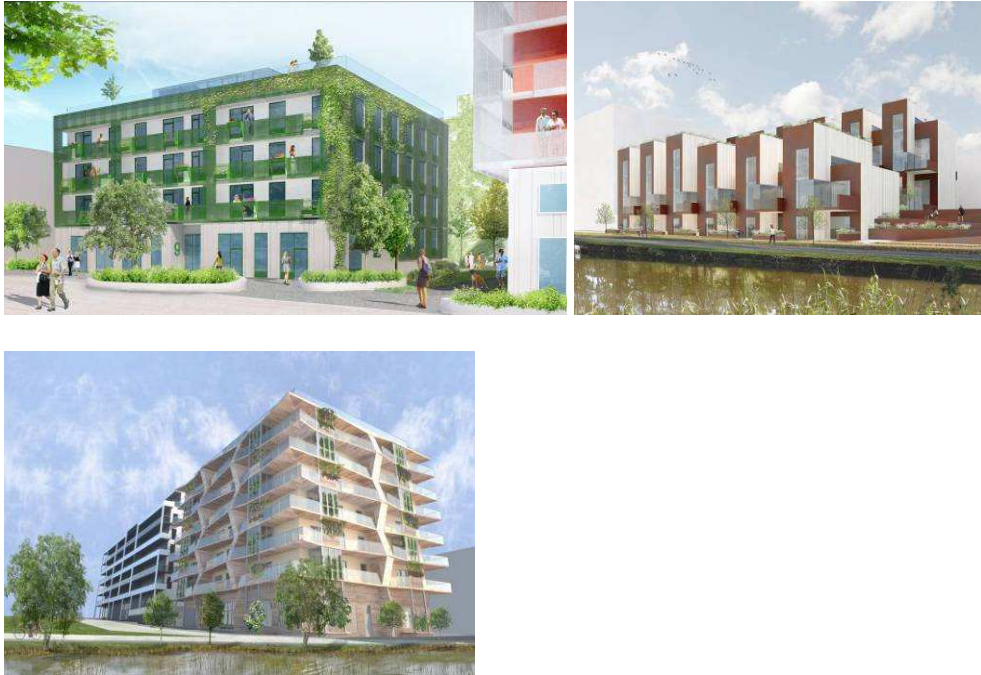
Exempel av föreslagen bebyggelse. Uppifrån från vänster: Heba fastigheter- Rosenbergs arkitekter, Erik Wallin- CF Möller Berg, Skanska – RB Arkitektur. För ytterligare beskrivning och illustrationer hänvisas till illustrationsbilagan.