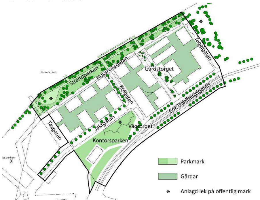
Illustration över parkmark, gårdsyta och anlagd lek på offentlig plats inom planområdet.

Planområdet ligger nära både Hjorthagsberget och Norra Djurgårdens naturområden, vilket ger goda förutsättningar för tillgängligheten till större offentliga rum och rekreationsområden. För ytterligare illustrationer och beskrivning hänvisas till illustrationsbilagan.