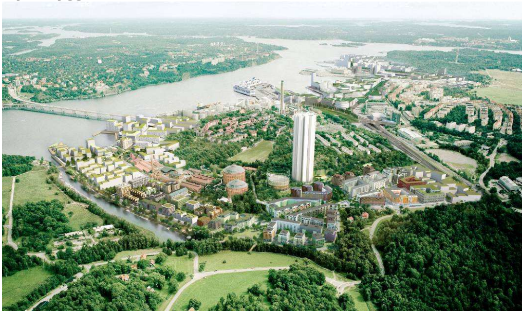
Flygfotomontage med den planerade bebyggelsen kring Hjorthagen. Bild: BSK Arkitekter.

Bebyggelsen i planområdet har en stadsmässig karaktär med en variation och oregelbundenhet inom kvarteren där olika typologier och byggnadshöjder blandas. Även när det gäller lägenhetsstorlekar och upplåtelseformer är inriktningen att uppnå en stor variation. Kvartersindelningar är formade utifrån de identifierade stråken, släpp i gasverksbebyggelsen och stadsdelens övergripande gatu- och parkstruktur. Genom detta bildas tre kvarter. Kvarteren är slutna mot områdets huvudgata och öppnas upp för utblickar och öppenhet mot Kungliga nationalstadsparken. Bebyggelsen är delvis gestaltad med tjockare huskroppar, dels med utgångspunkt i gasverksbebyggelsen och dels ur ett miljömässigt perspektiv då möjligheten att uppnå en mer energieffektiv byggnad ökar.