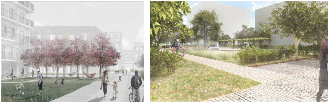
Illustrationer över gårdsmiljöerna. Bild: Urbio respektive Tema