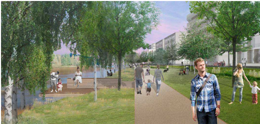
Vy längs strandparken österut.

Strandområdet längs Husarviken inom planområdet rymmer idag befintliga träd, främst av björk, sälg, jolster och enstaka viden. Strandområdet planeras att iordningställas med svagt sluttande gräsytor som tillsammans med björk- och alundgar understryker vikens naturprägel. I planbestämmelserna regleras att en trädridå längs Husarviken ska finnas (n1). Befintliga träd avses att bevaras men viss gallring i beståndet kommer att ske. Öppningar i anslutning till bryggor eller utglesning i vissa partier för att möjliggöra utblickar och möjliggöra för solinsläpp och ljus i strandparken kan förekomma. Kvarteren definieras av en brygga i förlängningen av varje gata som även förstärker kontakten med vattnet. Strandskoningen restaureras där det är nödvändigt. Lekytor samt våtmarker för dagvattenhantering planeras att iordningställas.