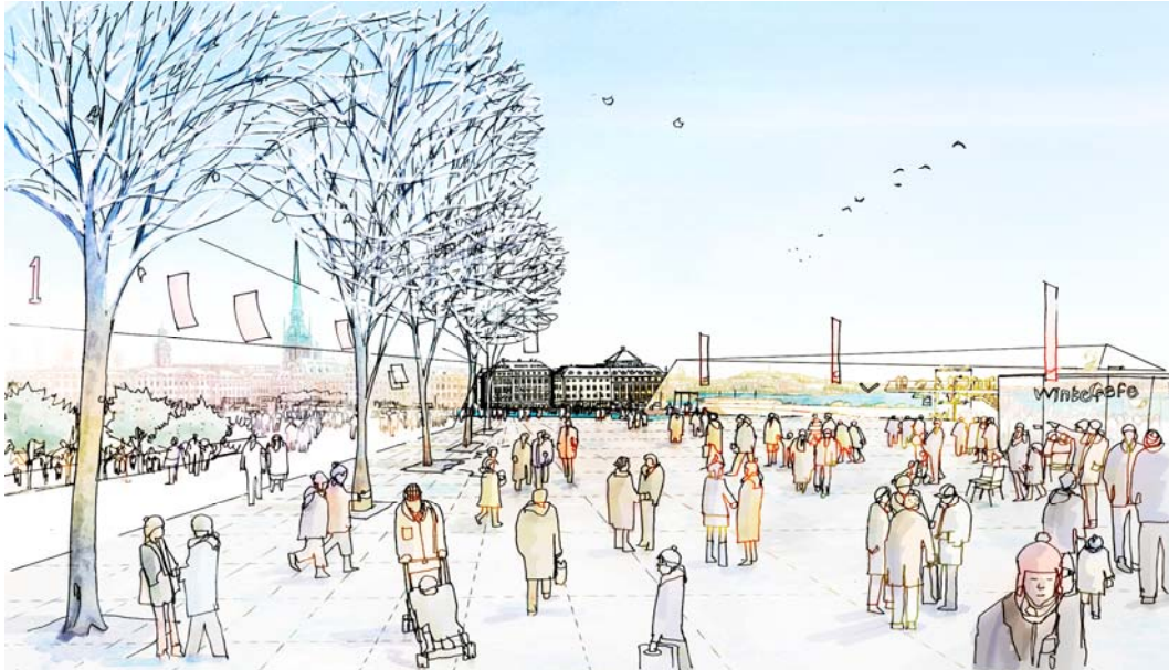
Södermalmstorg kantas av byggnaderna C1 och C2 med publika verksamheter.

huset och Glashuset (idag med adress Stadsgården). Husen är 4-6 våningar från torg- respektive kajplanet. Byggnaderna angörs från gatan mot KF-huset och Glashuset men har också möjlighet till entréer mot både parken och kajen. Det som varit viktigt vid volymgestaltningen av dessa byggnader är att KF-huset och Glashuset även i framtiden ska vara överordnade den nya bebyggelsen i stadsbilden.