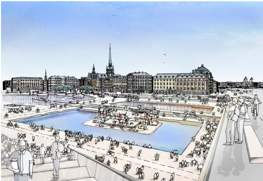
Slusstorget sett från Södermalm mot Gamla stan. Till höger huvudbron som utgör Skeppsbrons förlängning.

I anslutning till Katarinahissen kommer en ny park att anläggas som sträcker sig ända ner till kajplanet. Denna kompletterar på ett bra sätt de hårdgjorda ytor i form av kajer och torg som finns inom området. Parken ska gestaltas så att gröna värden kan tillskapas i form av gräsmattor, planteringar och träd. Parken kommer också att fylla en funktion som närpark för omkring 10 000 boende och arbetande på Södermalm och i Gamla stan då den kommer att utgöra den närmsta parkytan för dessa.