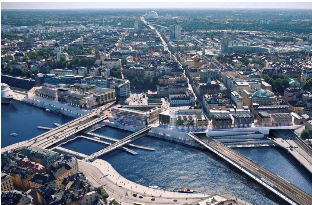
Plansamrådsförslag från januari 2010, flygvy över Slussen mot söder. Bild: Foster+Partners och Berg Arkitektkontor.

bemöta och ta hand om de synpunkter som lämnats in under plansamrådet samt därefter genomföra utställning.