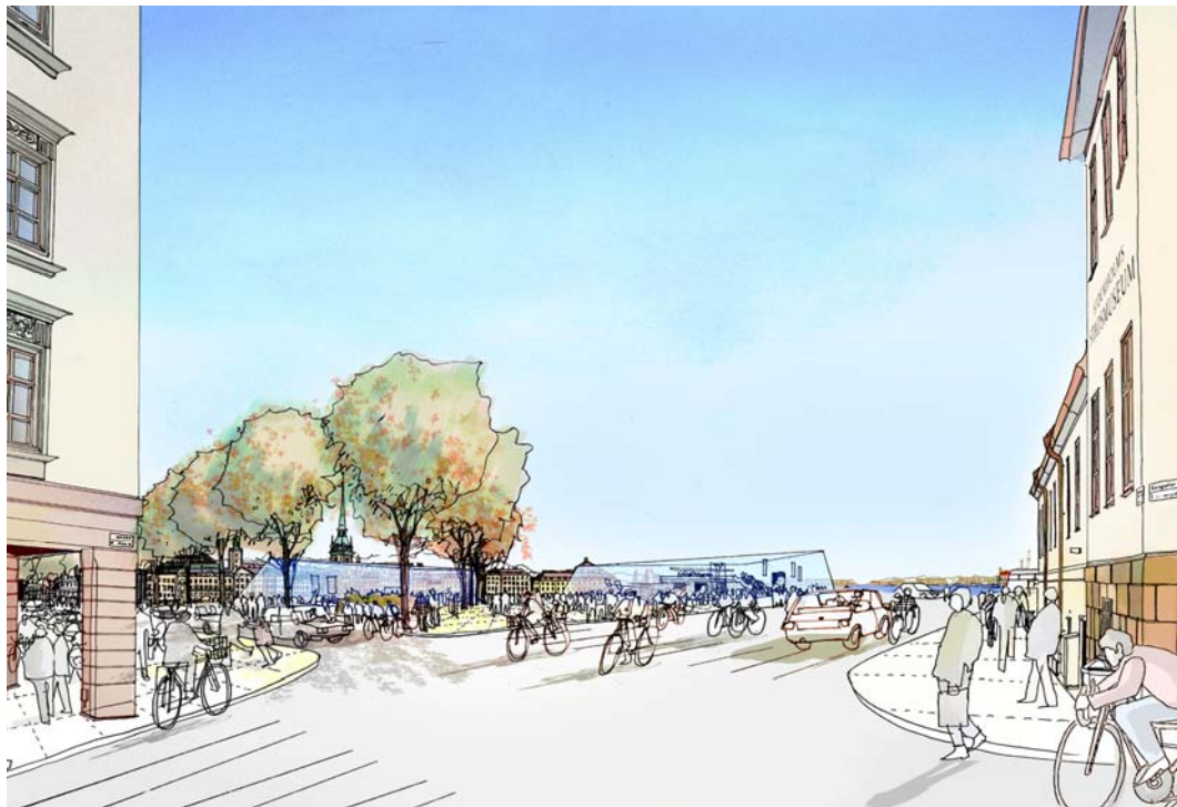
Vy från korsningen Hornsgatan/Götgatan med kvarteret Överkikaren till vänster i bild och stadsmuseet till höger. På Södermalmstorg ses byggnad C2 invid trädraden och byggnad C1 i bildens mitt, intill Hornsgatans förlängning mot huvudbron.

Bebyggelsen i öster utgörs av byggnaderna E1 och E2. Dessa byggnader förhåller sig till parken vid Katarinahissen, till kajen i norr samt till lokalgatan mot KF-