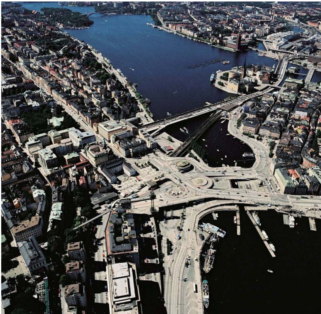
Slussen idag, vy mot väster med Södermalm till vänster och Gamla stan till höger i bild.

Planen syftar till att möjliggöra ombyggnation av Slussenområdet med nya publika platser, gator och kajer, ny- och ombyggnation av funktioner och ytor kopplade till kollektivtrafiken samt reglera byggrätter för ny bebyggelse. Planen syftar också till att möjliggöra nybyggnation av slussränna samt nya avbördningskanaler från Mälaren till Saltsjön.