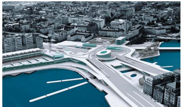
De två förslag som presenterades under programsamrådet; till vänster Nya Slussen och till höger Nybyggt bevarande.

Bild: t.v. Nyréns Arkitektkontor, t.h. White Arkitekter.