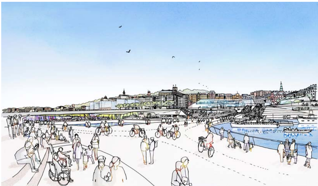
Slussen sett från Gamla stan. Vattenytor öppnas upp, nya byggnader med publikt innehåll och nya torg och park, gator och kajer utgör grunden för en attraktiv mötesplats i det framtida Stockholm.

I visionen om framtidens Stockholm har Slussen en viktig plats. Historiskt är det platsen där staden växte fram mellan landvägen och vattenvägen och det är här, i Gamla stan, som stadens ursprung finns. På denna plats kommer i framtiden det växande Stockholm ges en självklar och vacker mötesplats, en urban scen för gamla och nya Stockholmare, en nod för trafik och en modern bytespunkt mellan olika kollektivtrafikslag. Slussen kommer att vara en mycket viktig del av stadens offentliga rum i framtiden, och ett mycket attraktivt sådant. Detta är utgångspunkten för hur framtidens Slussen formas och det som ligger till grund för planen för framtidens Slussen.