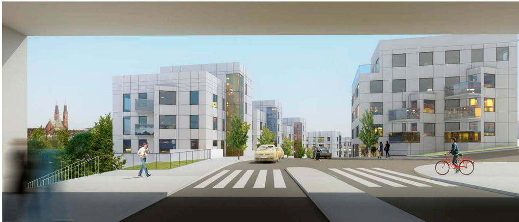
Vy längs Nybohovsbacken mot öster