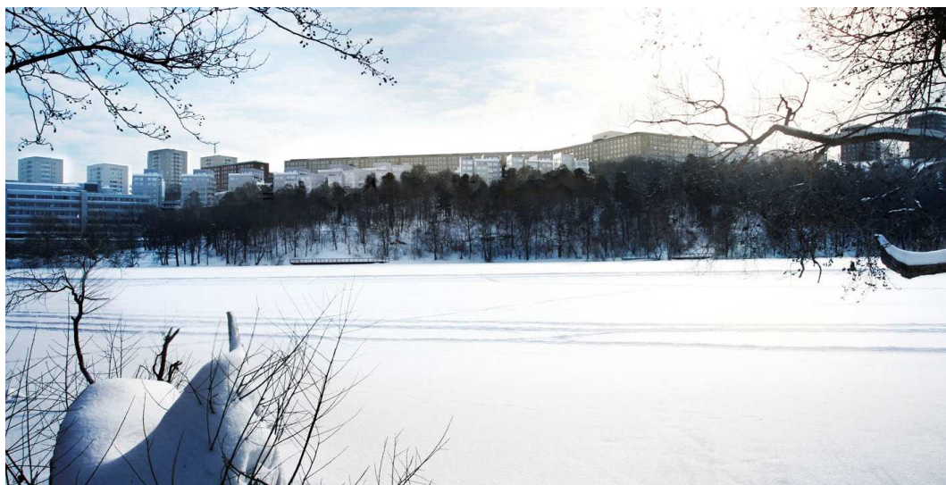
Vy mot söder från sjön Trekantens norra sida