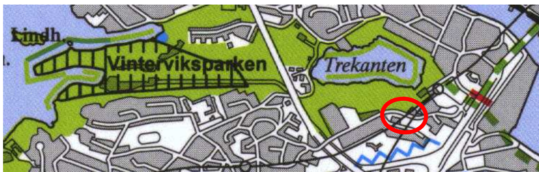
Utdrag ur Stockholms grönkarta