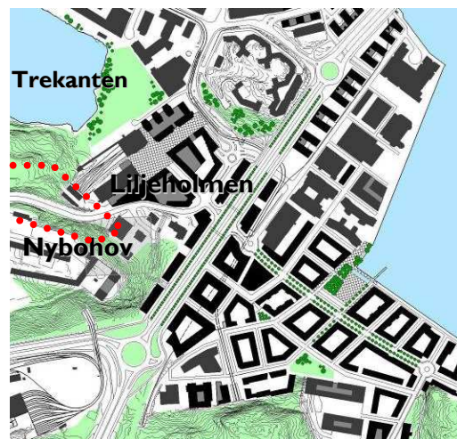
Utsnitt från strukturplanen för stadsutvecklingsprogrammet

Stadsutvecklingsområdet Liljeholmen kommer, när det är fullt utbyggt, att rymma ca 4500 nya lägenheter samt arbetsplatser för ytterligare drygt 7000 personer. Området sträcker sig från Liljeholmstorget över Södertäljevägen via Årstadal, Liljeholmskajen, Sjövikshöjden till Årstaberg. När alla lägenheter inom stadsutvecklingsområdet färdigställts, ryms de i en blandad stadsbygd; genom en tät kvartersstad i Årstadal-Liljeholmskajen och en öppnare struktur på bergen ovanför på Sjövikshöjden, i kv Årstaberg och på Nybodahöjden.