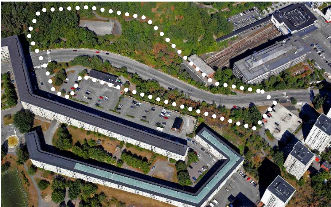
Flygfoto över plan området sett från söder

Planområdet är beläget i ett attraktivt och kollektivtrafiknära läge och möjliggör genom den nya bebyggelsen en mer stadsmässig gata som tydligare kopplar samman Nybohov och Liljeholmen. Förslaget innehåller totalt femton hus med 175-190 nya lägenheter, garage med parkering för de tillkommande lägenheterna, verksamhetslokaler, samt en förskola för cirka 160 barn. Den nya bebyggelsen ska utgöra ett kvalitativt nutida komplement till det befintliga området på Nybohovshöjden.