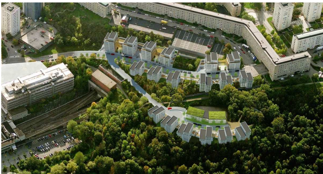
Flygvy från norr, illustration över planförslaget enligt första utställningen