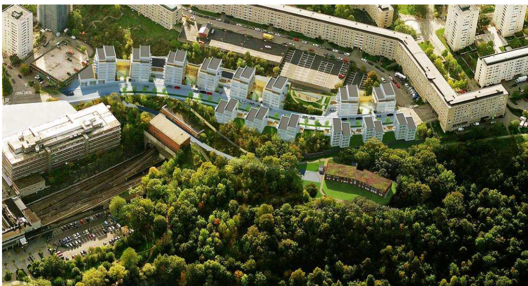
Flygvy från norr, illustration över planförslaget enligt ny utställning