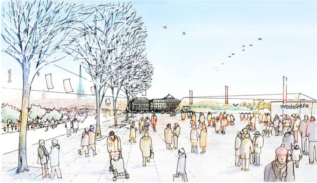
Södermalmstorg kantas av byggnaderna C1 och C2 med publika verksamheter.

huset och Glashuset (idag med adress Stadsgården). Husen är 4-6 våningar från torg- respektive kajplanet. Byggnaderna angörs från gatan mot KF-huset och Glashuset men har också möjlighet till entréer mot både parken och kajen. Det som varit viktigt vid volymgestaltningen av dessa byggnader är att KF-huset och Glashuset även i framtiden ska vara överordnade den nya bebyggelsen i stadsbilden.