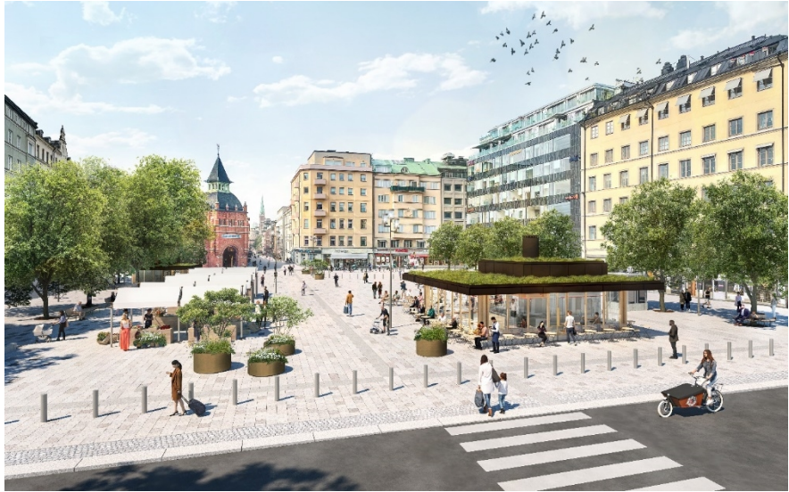
Översiktlig vy av samrådsförslaget från Hedvig Eleonora Kyrka kyrkpark (Karavan 2024).

Restaurangbyggnadens placering i den nordöstra delen av torget utgår från den tidigare restaurangbyggnadens placering på torget. Den nya restaurangen placeras något längre söderut, närmare torgets axel, i syfte att skapa en starkare koppling till de naturliga flödena längs mittstråket och torgets folkliv. Placeringen regleras så att byggnaden förhåller sig till att ligga i linje med Sibyllegatans och Storgatans fasadliv för att bevara torgets siktlinje.