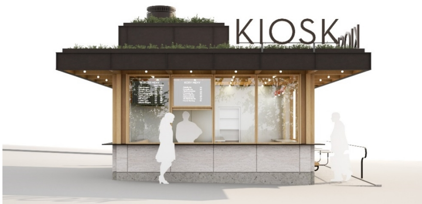
Kioskbyggnadens fasad mot norr, torgets mittstråk (DinellJohansson, 2024). Samrådsförslag.