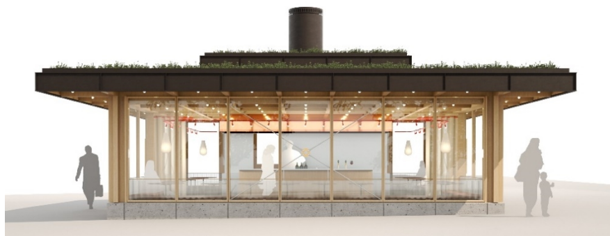
Restaurangbyggnadens fasad mot söder, torgets mittstråk (DinellJohansson, 2024). Samrådsförslag.

Den övergripande tanken och ambitionen är att utforma byggnaderna så att de inte ha någon baksida. Byggnaderna ska vara transparenta och möta folklivet från alla håll. För att harmonisera med omgivningen utgår båda byggnaderna från att ha ett enkelt och lätt uttryck med ett medvetet förhållande till skala, proportioner, tonalitet, sockelutformning och transparens. Förhållande mellan täta och uppglasade partier är avgörande.