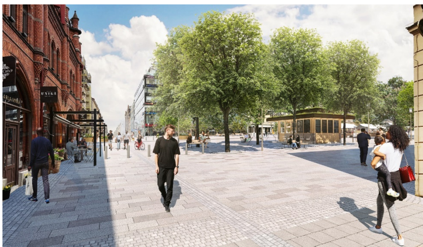
Vy av samrådsförslaget norrut från Nybrogatan med föreslagen kioskbyggnads placering och gestaltning (Karavan 2024).