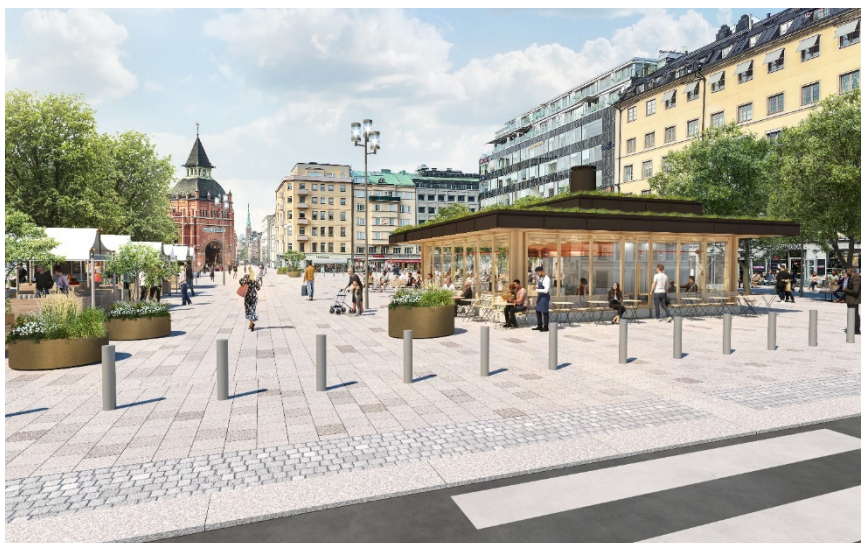
Vy av samrådsförslaget från Storgatan med föreslagen restaurang- och kioskbyggnads placering och gestaltning (Karavan, 2024).