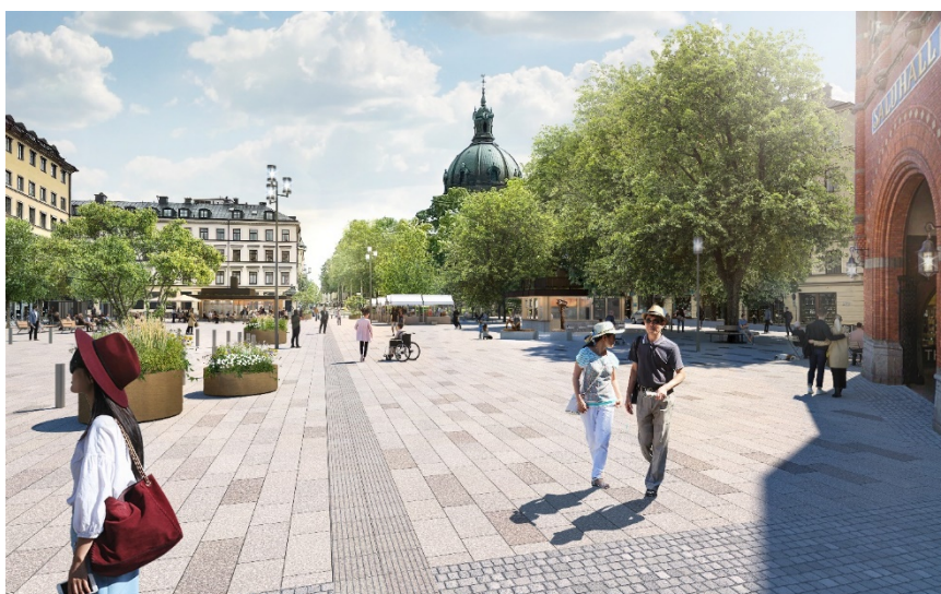
Vy av samrådsförslaget från Humlegårdsgatan med föreslagen restaurang- och kioskbyggnads placering och gestaltning (Karavan, 2024).