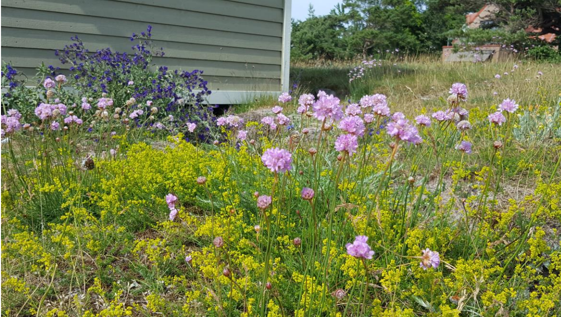
Figur 5. Torräng med strandtrift, gulmåra och oxtunga i bakgrunden.

använda den typ av ängsfröer som finns som ett naturligt inslag i just den del av landet där ängen ska etableras.