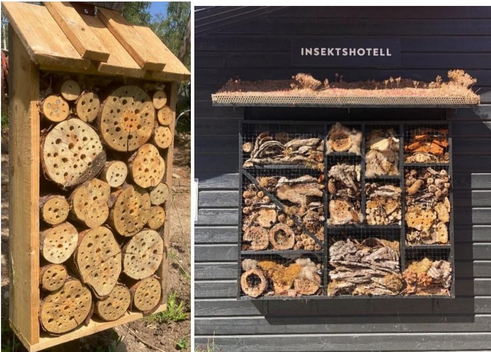
Figur 4. Insektshotell i olika utförande.

Fågelholkar kan kompensera för förlusten av träd med håligheter genom att öka möjligheten för fåglar att hitta hål där de kan bygga bon. Mindre fågelholkar gynnar ett flertal småfåglar som olika mesar, rödstjärt och trädskräp. Taket på holkarna får gärna skjuta ut långt över ingångshålet. Detta skyddar från yttre angrepp från andra djur. En fågelholk med en håldimension på 3,2 cm i diameter brukar vara lagom, då passar fågelholken till fåglar som talgoxe, tofsmes, blåmes och svartvit flugsnappare. Fågelholkar ska placeras så de skyddas mot direkt solljus under en hel dag. Holkar placeras med fördel på väggar eller i träd som vetter mot öst eller väst, åtskilda från varandra, gärna nära födosöksområden som blommande rabatter och träd och buskmiljöer där det finns insekter, bär och frön. En fördel är att sätta upp holkar som passa olika arter.