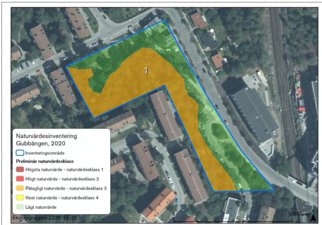
Figur 1. Urklipp ur Ekologigruppens Naturvärdesinventering i Gubbängen, Stockholms stad (granskningsversion) från 2022-03-11.