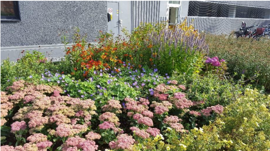
Figur 3. Blommande rabatt i industriområde i Solna.