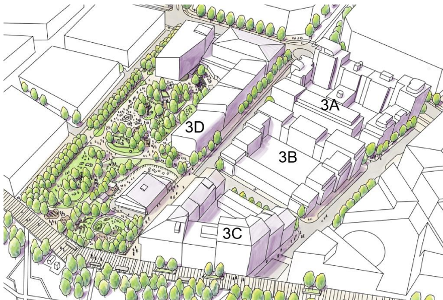
Volymstudie med kvartersnamn. Illustration Landskapslaget.

Även våningshöjder har varierats baserat på vilken typ av offentlig miljö de ansluter till. Mot huvudgatan är bebyggelsen något högre medan den genomsnittliga våningshöjden är något lägre mot de mindre trafikerade lokalgatorna och gångfartsgatorna. Det finns även inslag av stadsradshus för att bryta ner skalan och variera gestaltningen.