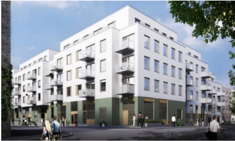
Kvarter 3B sett från norr (mot kvarter 3A i bilden ovan) med uppbrutna volymer med ett band i grön klinker. Illustration Arkitema architects och Esencial arkitekter.