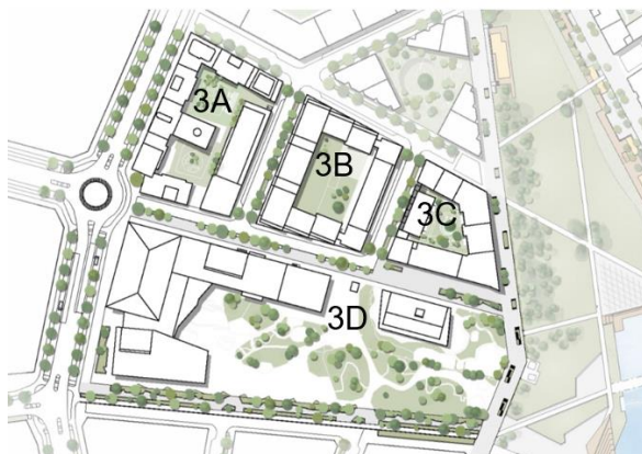
Illustrationsplan med kvartersnamn. Illustration White Arkitekter.

Detaljplanen utgör den tredje bebyggelsestappen på Årstafältet och omfattar en del av fältets västra sida. Planen består av tre kvarter med bostadsbebyggelse (3A, 3B och 3C) med lokaler i bottenvåningen utmed huvudgatan och aktivitetsbryggan samt ett skolkvarter (3D) som även inrymmer förskola och en fullstor idrottshall samt en elnätsstation. Kvarter 3A inrymmer också en förskola. Skolan och idrottshallen byggs samman och utgör en stor byggnadsvolym som dominerar stadsbilden och utgör viktiga målpunkter. Skolgården öppnar sig mot parken.