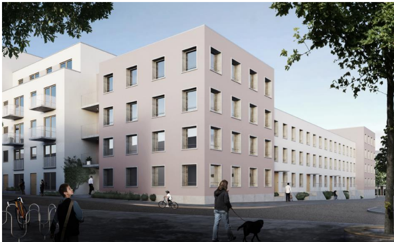
Kvarter 3B sett från söder med en långa radhus i tre våningar i ljusrosa puts. Illustration Arkitema architects och Esencial arkitekter.