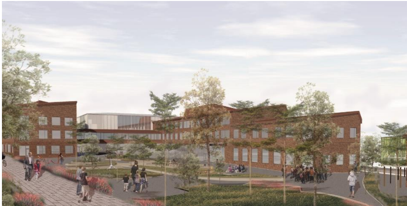
Skolgården med en öppen skolgård med ytor för lek. Illustration Cedervall arkitekter.