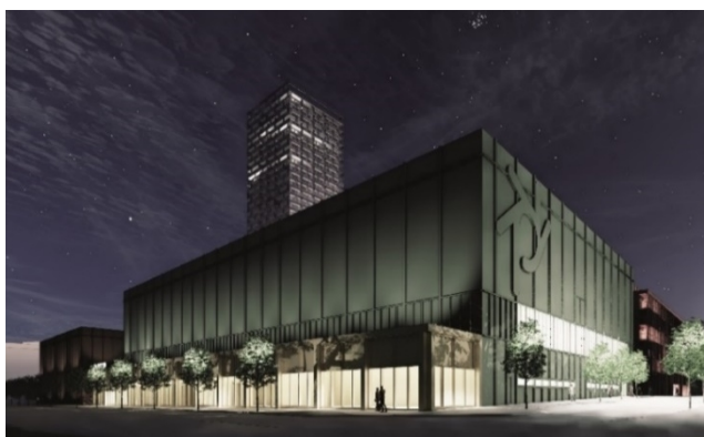
Bilden till vänster är en vy från Torshamnsgatan. Bostadskvarteren i Kista äng syns i bildens vänstra sida. Bilden till höger är en vy från kvarterets norra hörn och illustrerar padelhallen och utbyggnaden med centrumlokaler mot nordöst. (Wingårdhs arkitekter)

Tornen är gestaltade med ett vitt halvgenomskinlig skikt av glas utanför de egentliga ytterväggarna. Eventuella inglasningar av balkonger utförs med klart transparent glas och med en distans från det yttre glasskiktet för att skapa en reliefverkan. I övrigt kontrasterar kvarterets bebyggelse emot tornens gestaltning för att framhäva dem. Kvarterets övriga byggnader präglas av texturer och kulörer som ger en kontrasterande verkan och visuell tyngd. Bebyggelsen är också visuellt indelad i tydliga delvolymer till en skala som anpassas till bebyggelsen i omgivningen.