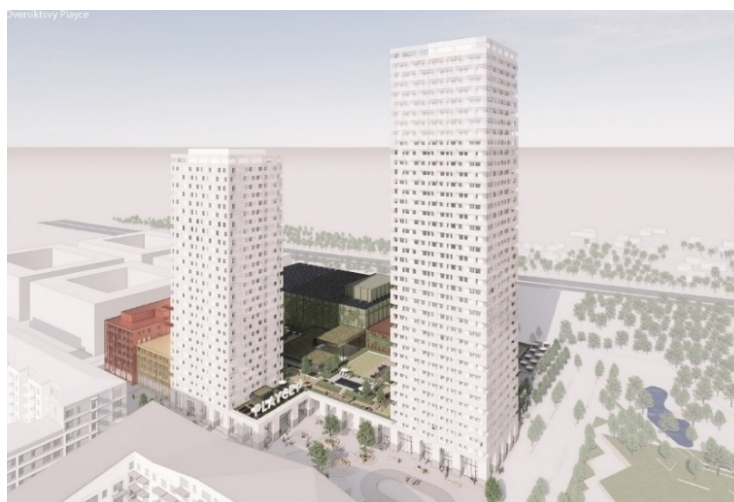
Vy från sydost. (Wingårdhs arkitekter).

Detaljplanen bidrar med sin öppna och aktiva bottenvåning främst mot Torshamnsgatan och urbana axeln till en omvandling av Torshamnsgatan till ett urbant stråk. Detaljplanen möjliggör också för en framtidskoppling mellan Torshamnsgatan och Sollentuna kommun.