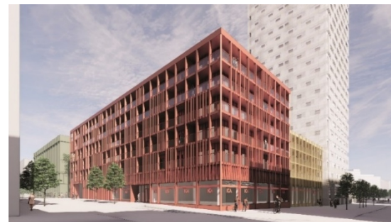
Bilden till vänster visar det höga bostadshusets inglasade balkonger som en del av fasadens gestaltning, och bilden till höger är en vy från Torshamnsgatan och illustrerar bostadshuset i sex och fyra våningar. (Wingårdhs arkitekter).