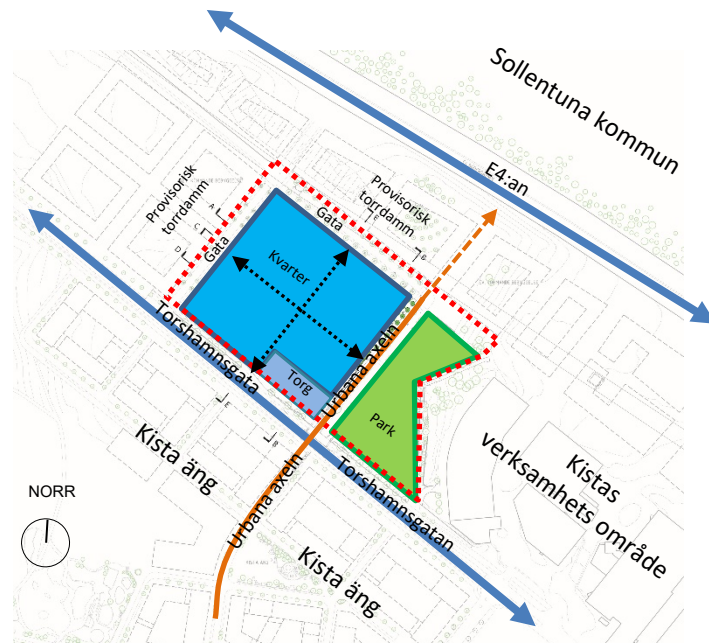
Situationsplan. Detaljplanområdet är markerat rött. De svarta pilarna illustrerar genomgående passager i kvarterets bottenvåning.

platsen till en viktig knutpunkt i området. Höghusen utgör en tydlig accent och nya inslag i Kistas siluett.