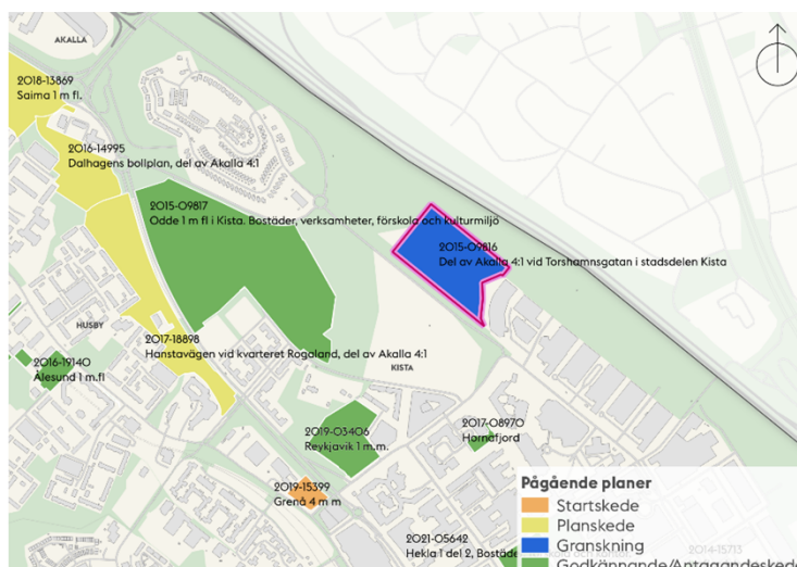
Kartan visar planområdets läge och avgränsning i blått samt pågående detaljplaner i närområdet.