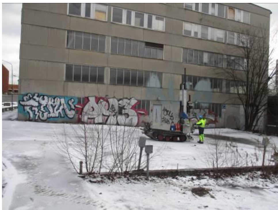
Bild 6. Provtagning punkt S9