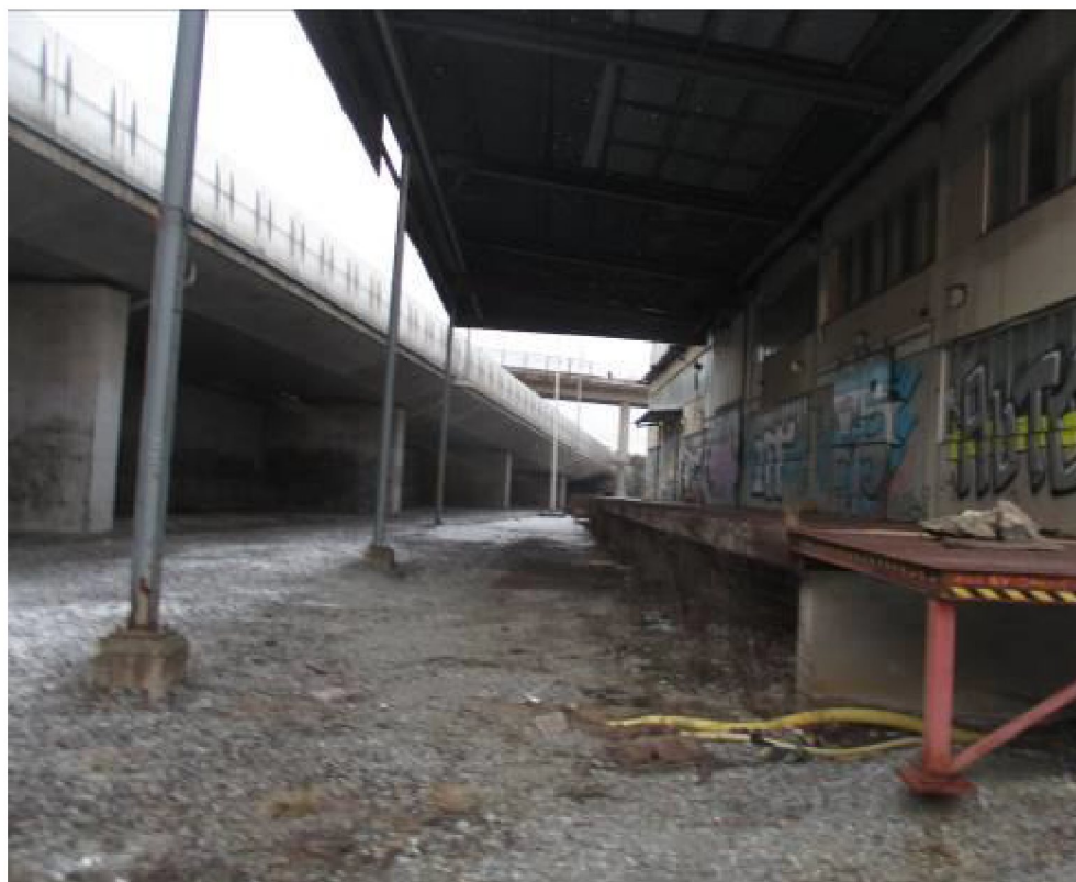
Bild 4. Tidigare lastkaj södra delen av Starkströmmen 2 – provtagning ej möjlig pga markförlagda ledningar