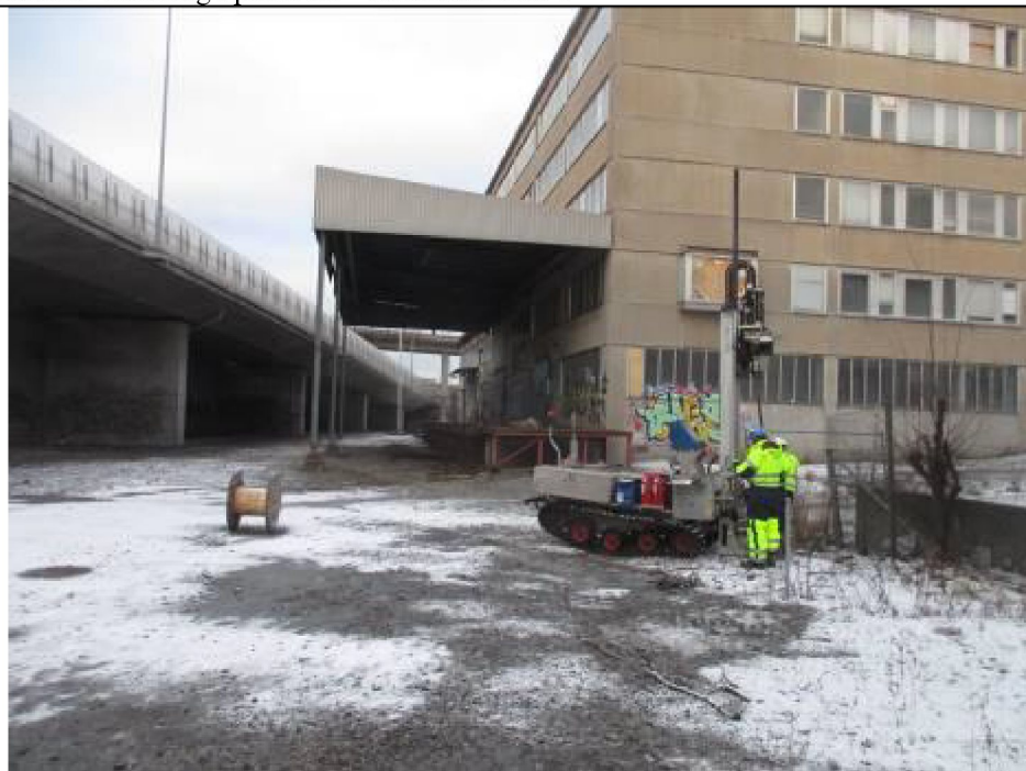
Bild 2. Borrning i punkt S2