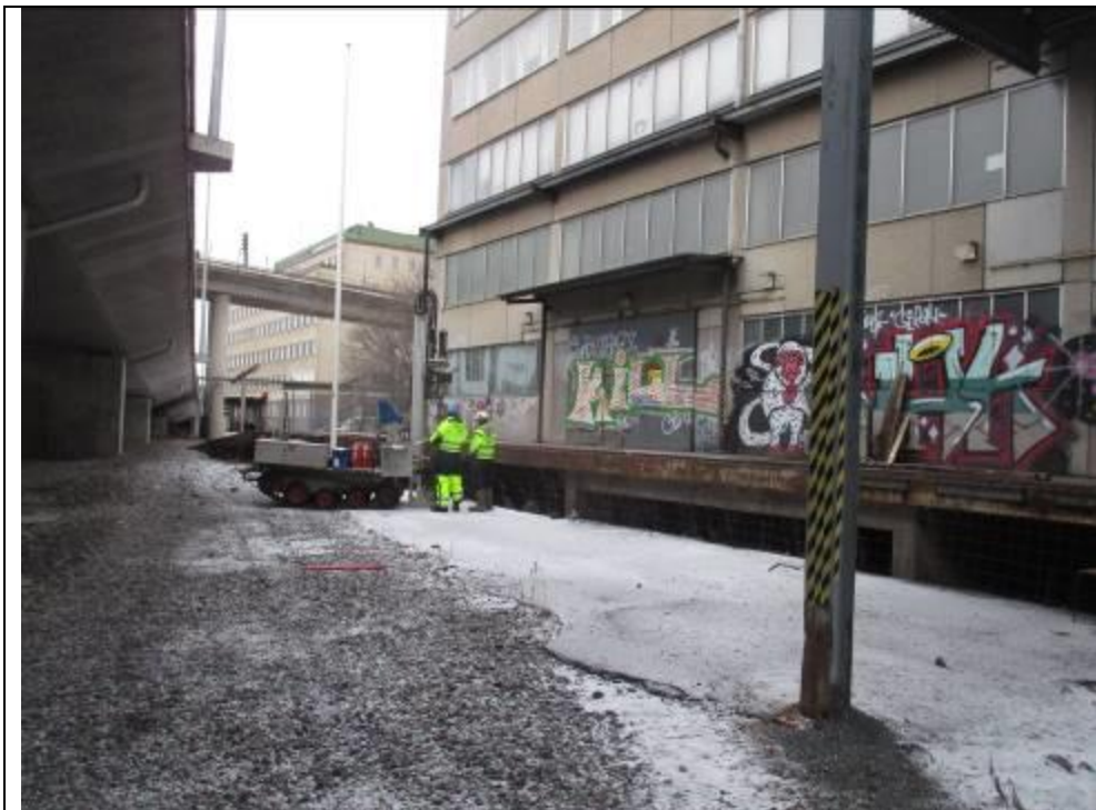
Bild 5. Provtagning punkt S6