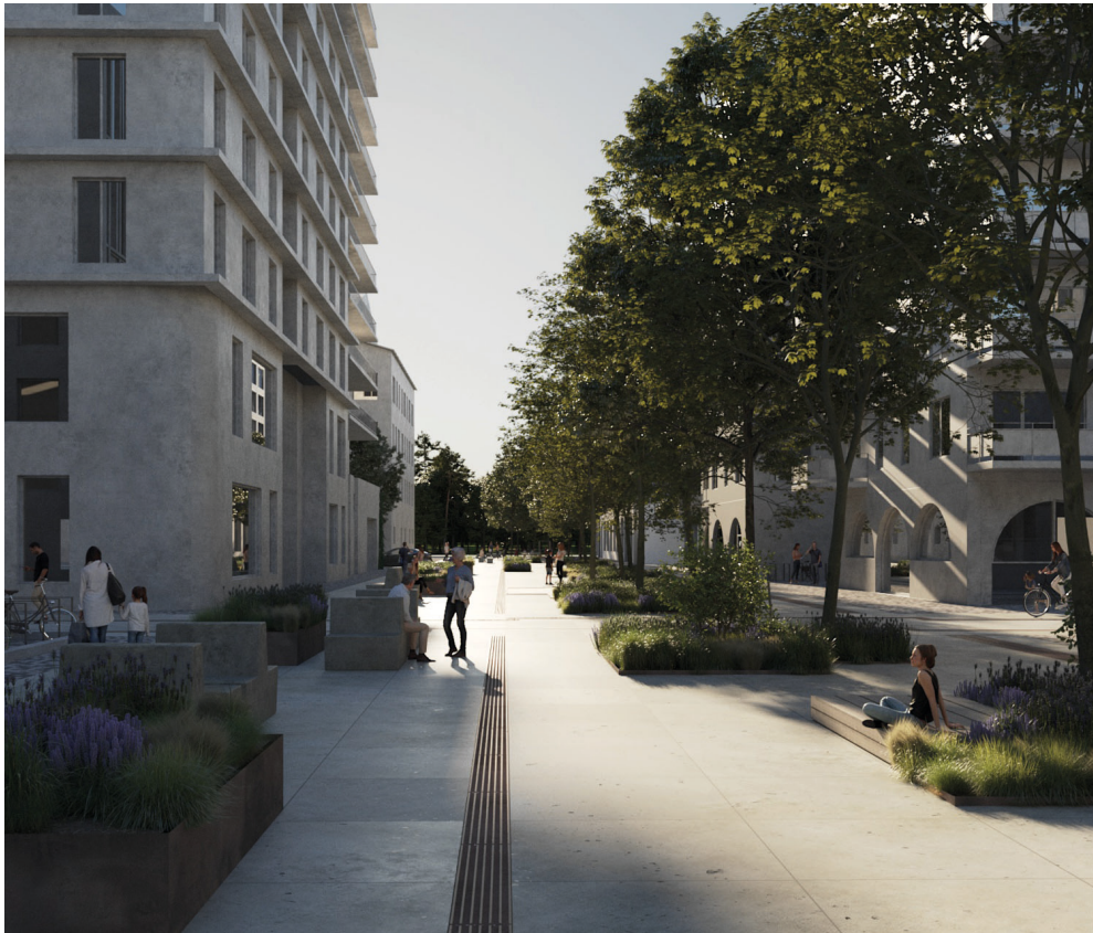
Visualisering på hur en bilfri gata kan utformas i Slakthusområdet (Nyréns Arkitektkontor 2019).