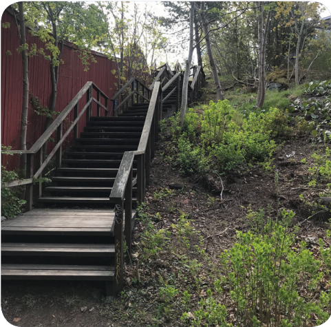
Naturparken/Frötallen har stora nivåskillnader och är smal i vissa passager.