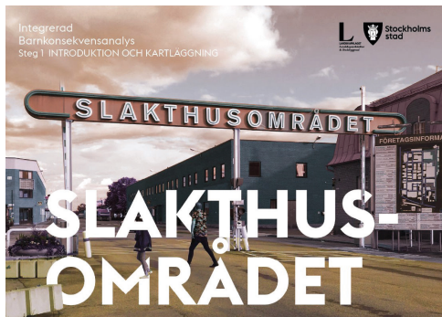
Integrerad barnkonsekvensanalys Slakthusområdet. Steg 1 - Introduktion och kartläggning. (Landskapslaget 2019)

Under 2017 godkände Stockholms stads byggnadsnämnd Program för Slakthusområdet . Programmet utgör ett planförslag för hur en utveckling av Slakthusområdet ska ske och är ett underlag för kommande planarbete. Programmet ska möjliggöra en utveckling av Slakthusområdet i enlighet med Vision Söderstaden 2030 och syftet är att skapa en blandad stadsdel med 3900-4200 nya bostäder, nya arbetsplatser, förskolor, skola, idrottsfunktioner och andra urbana verksamheter som handel, mat och nöjen. Ett annat syfte är att tillvarata områdets speciella karaktär och identitet och att ny bebyggelse planeras så att stadsdelens historia är avläsbar.