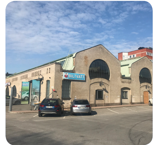
En befintlig byggnad intill Fällanparken som görs om till att inhysa kulturverksamhet.