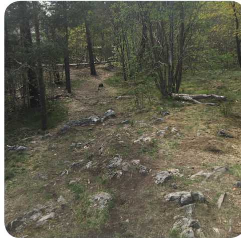
Naturparken/Frötallen har en terräng med möjlighet till utmanande lek.