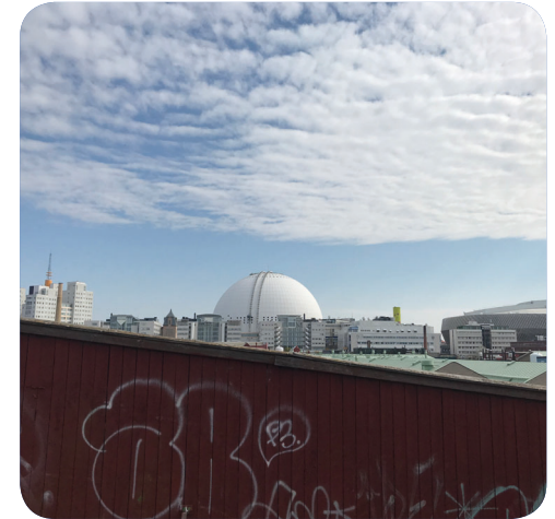
Högsta punkten i Naturparken/Frötallen erbjuder utsikt mot landmärken.