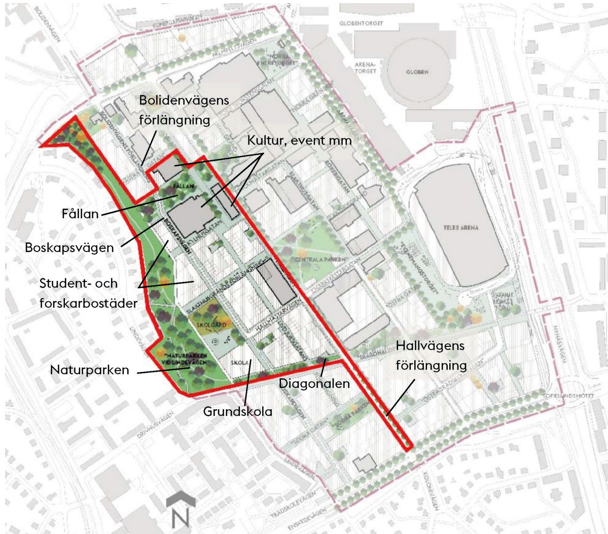
Planen visar illustrationsplan för detaljplan etapp 1 (utkast oktober 2018) och nuvarande skede i planprocessen. Byggnader som sparas är markerade med grå färg.