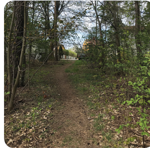
Naturparken/Frötallen kopplar Slakthusområdet till villaområdet vid Lindevägen.