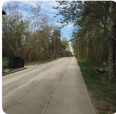
Lindevägen går mellan Naturparken/Frötallen och delar den i två delar.