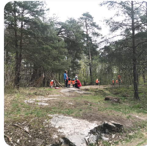
Förskolor använder redan idag Naturparken/Frötallen för utflykter.