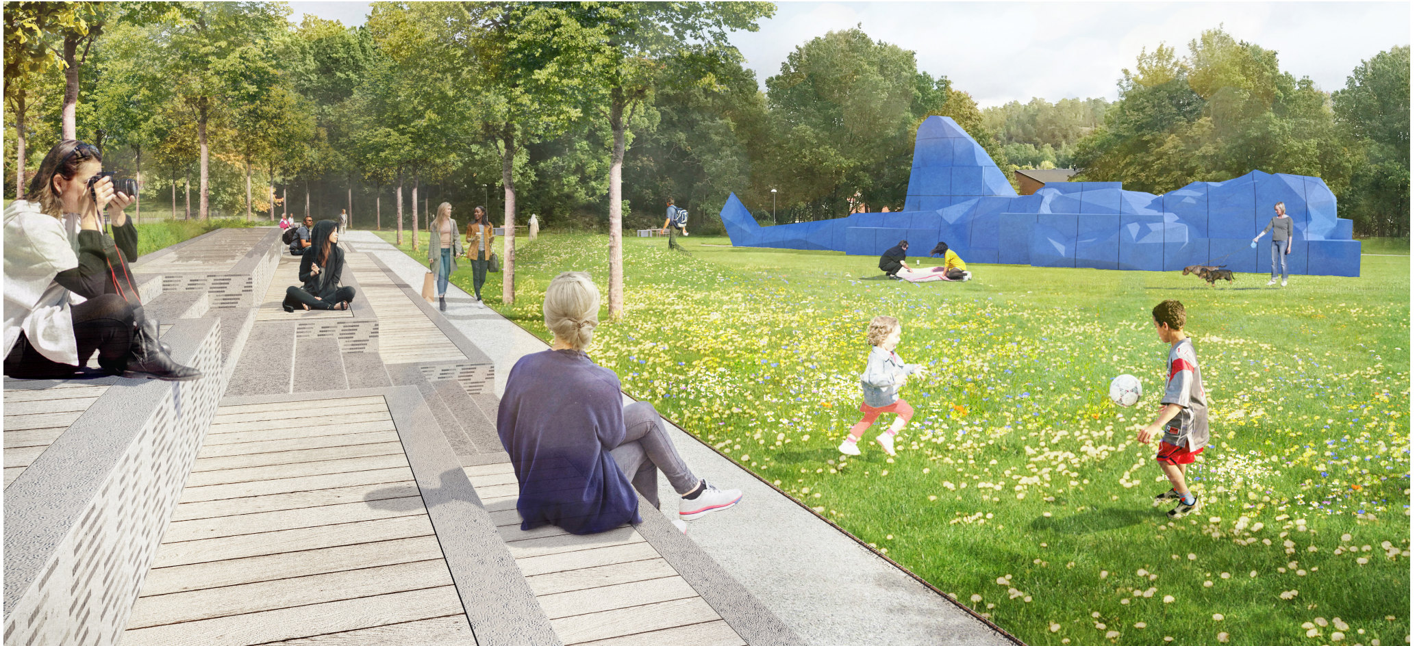
Perspektiv Pelousen. Parken utformas för att upplevas inbjudande för alla åldrar och erbjuda rekreativsmöjligheter för många personer med olika intressen. Bild: Karavan landskapsarkitekter AB