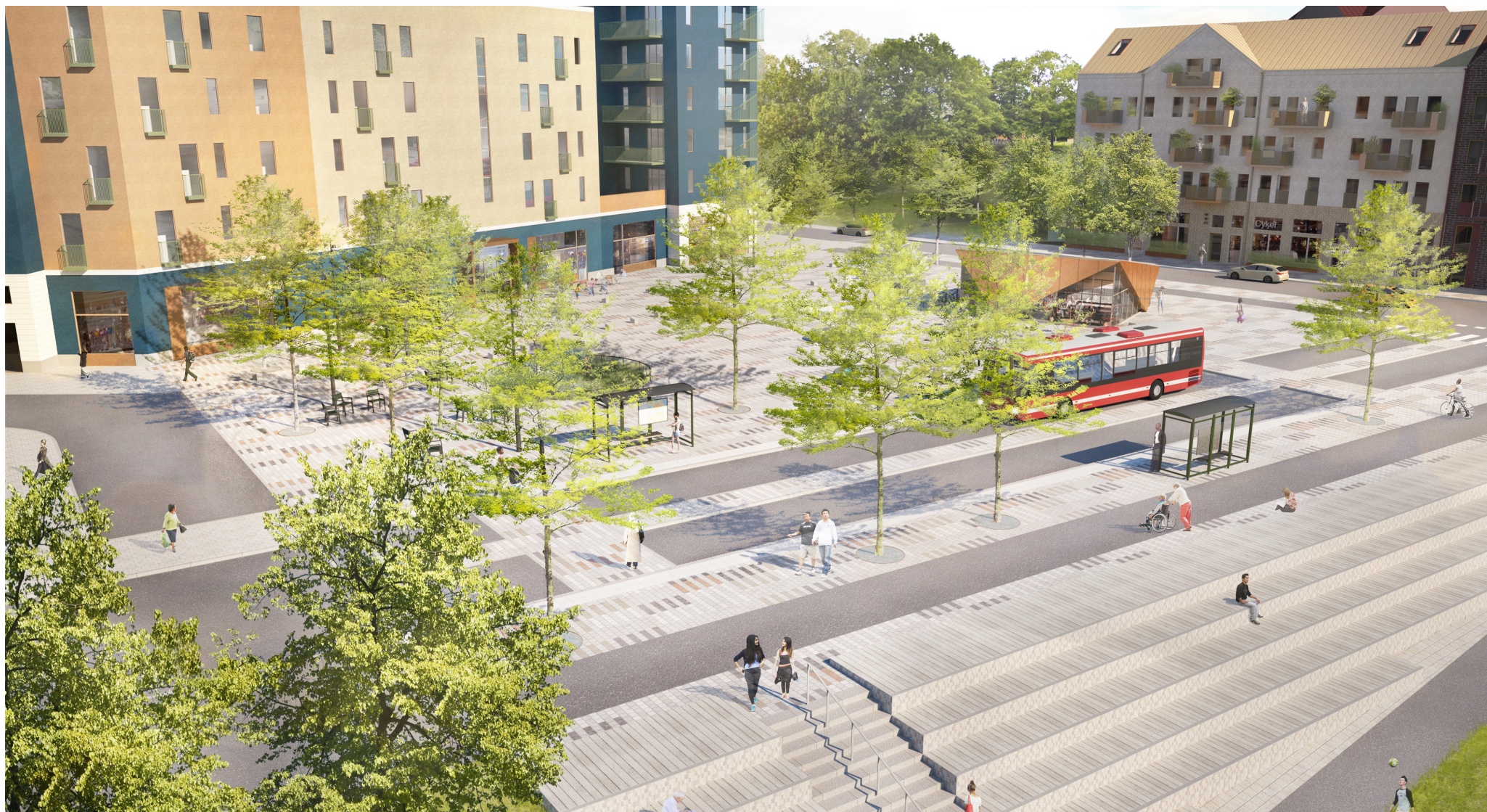
"Alla tiders torg", en ny torgbildning i korsningen Vårbergsvägen/Svanholmsvägen. Illustration: Karavan Landskapsarkitekter.