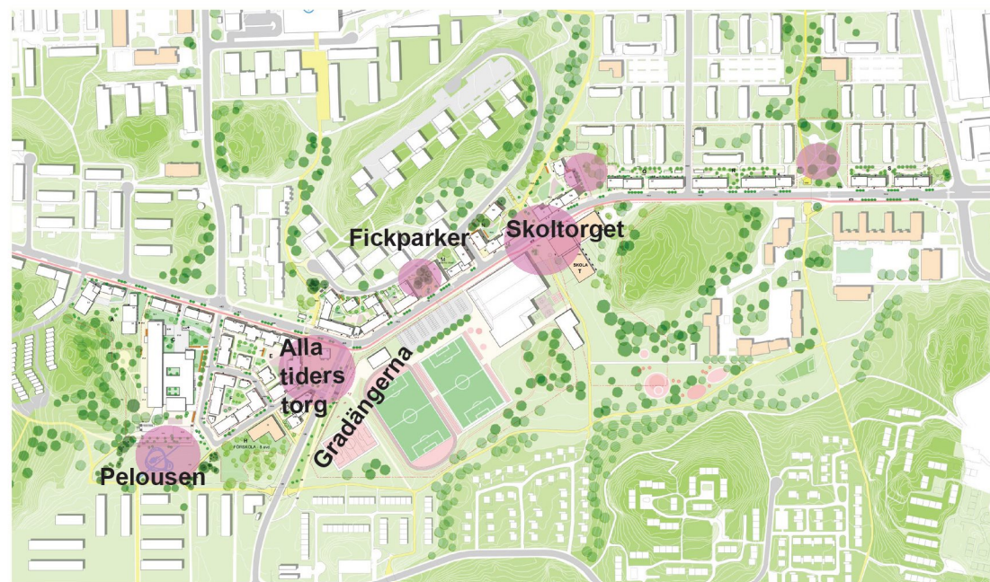
Nya platsbildningar längs med Värbergsvägen. Illustration: Tovatt Arkitekter

Grönstråkparker och idrottsplatser uppskattas som en kvalité i området men är enligt tidigare genomförda dialoger även till en källa till upplevd otrygghet. Vägen till idrottsplatsen, idrottsplassen själv samt gångtunneln dit har utpekats som en otrygga plats (BKA Ramböll). Troligtvis beror den upplevda otryggheten på att platserna stundom är ensliga och öde, samt att de emellanåt befolkas av "gäng som hänger".