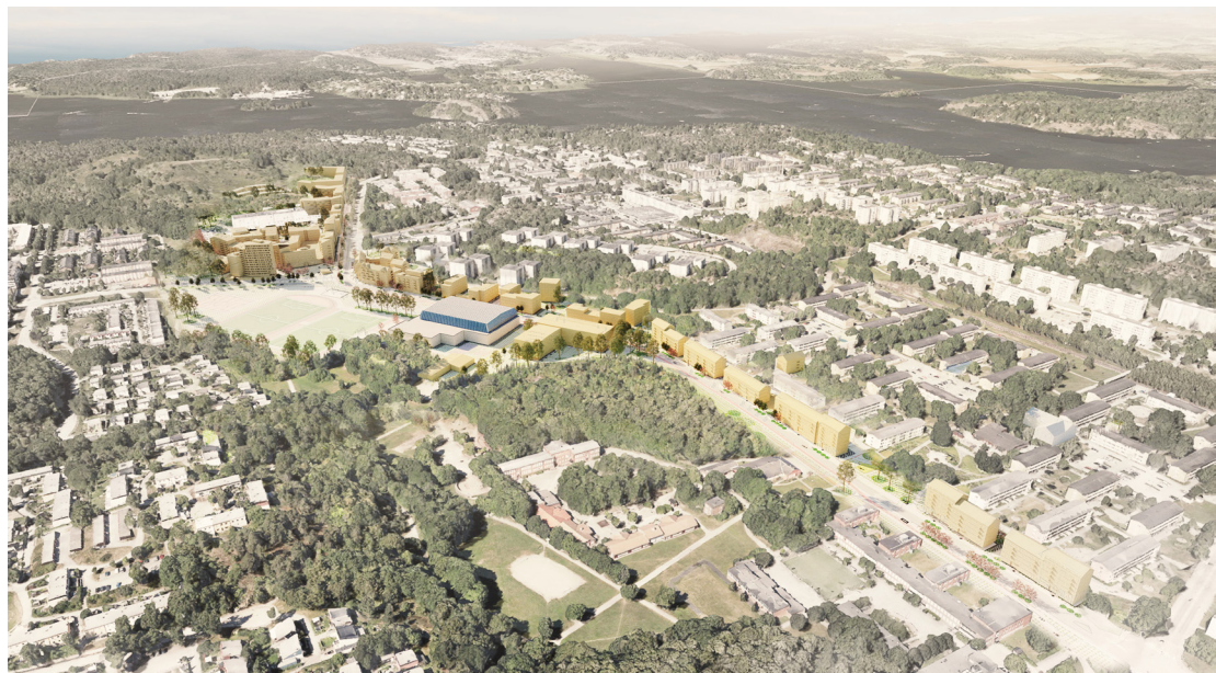
Vårbergsvägen flygperspektiv. Illustration: Tovatt architects and planners.

Det är av stort värde att det tillförs idrottsanläggningar inom planområdet, vilket är en bristvara i hela Storstockholm. Det är en tillgång för såväl boende inom planområdet och kan locka besökare utifrån.