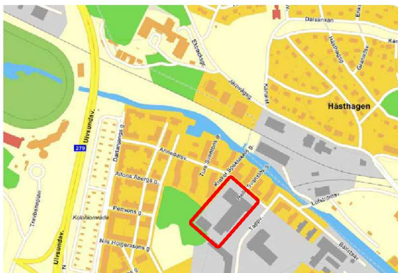
Figur 1: Översiktskarta med fastigheten Baltic 8 markerad med rött.

Den aktuella fastigheten Baltic 8 ligger centralt i stadsdelen Annedal, Bromma. Undersökningsområdets storlek är cirka 10 000 m 2 och av dessa är ca 7 000 m 2 täckta av en industri- och kontorsbyggnad med tillhörande parkeringsgarage. En översiktskarta över området redovisas i figur 1 nedan. Fastigheten avgränsas i väster av ett bostadsområde med flerbilshus, i söder av berg samt en fastighet med kontorsbyggnad och i väst av en grusad yta som i dagsläget används som parkering och som planeras bli ett torg. I norr avgränsas fastigheten av Annedalsvägen. Bällstaån ligger ca 75 m norr om fastigheten.