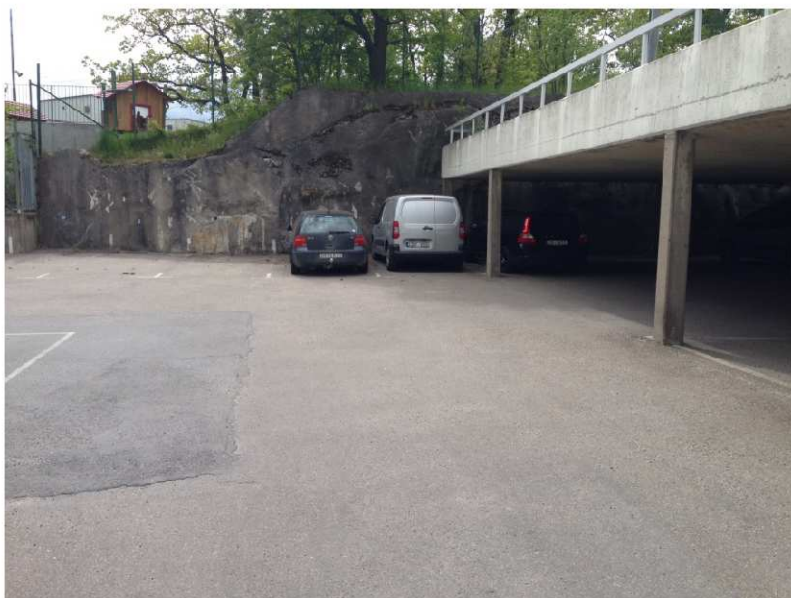
Figur 3. Berg i dagen i angränsning till fastighetens södra del.