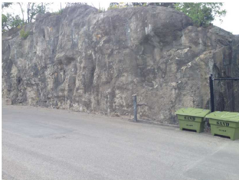
Figur 2. Berg i dagen i angränsning till fastighetens västra del.