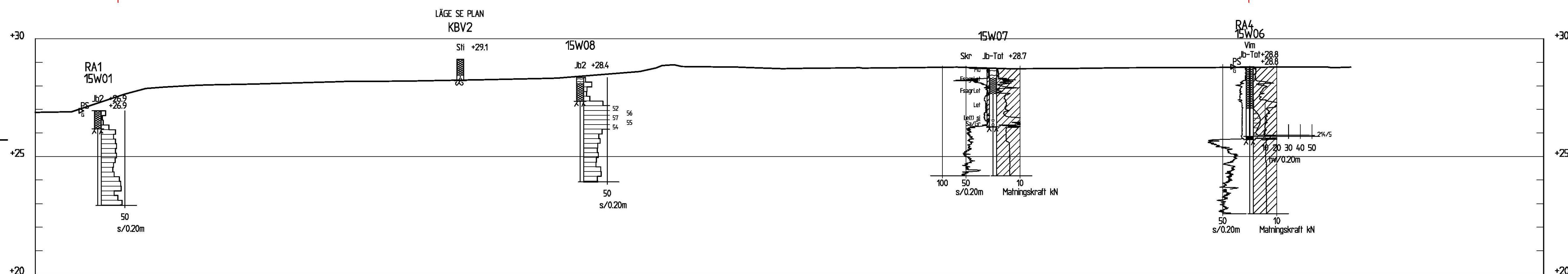
SEKTION B-B 1:100