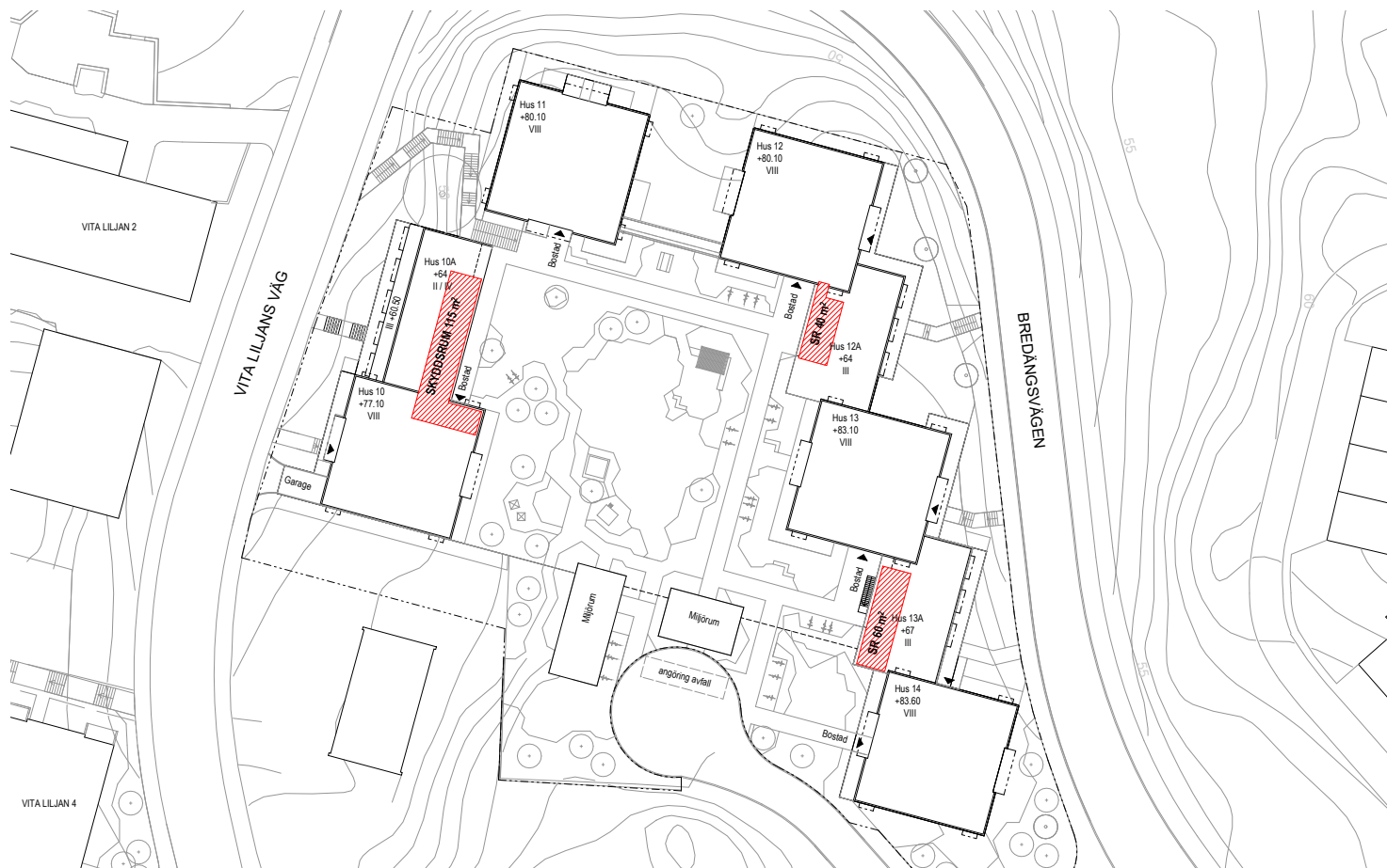
Utile Dulci placering skyddsrum Plan 1:1000

Centrala Bredäng Vita liljan 3-4 & Utile dulci Beskrivning skyddsrum 2024-08-30