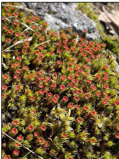
Hårbjörnmossa på berghäll. Ett vackert inslag i delområde 2.

Titelbladets bild: Flygbild över inventeringsområdet med omgivningar.