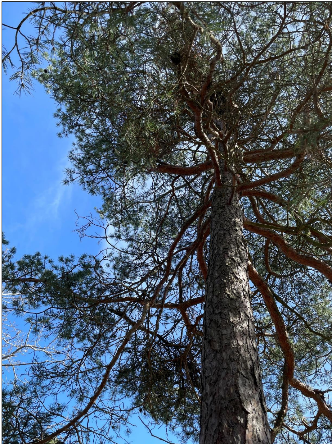
Delområde 1. Den äldsta och mest värdefulla tallen i delområdet.