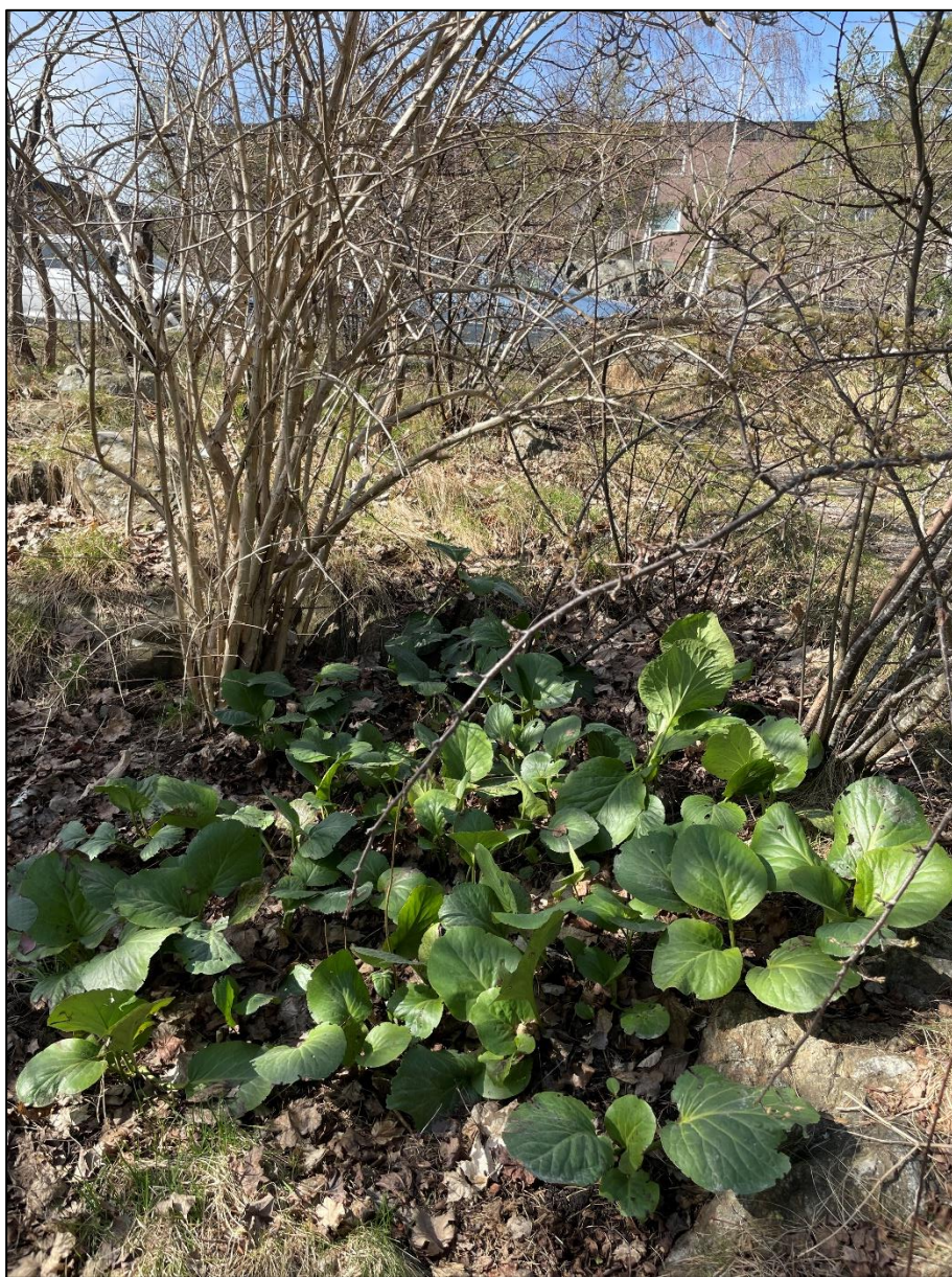
Delområde 1. Bergenia. Trädgårdsväxten med de stora bladen visar att det inte går att dra någon skarp gräns i vegetationen mellan trädgårdar och inventeringsområdet.