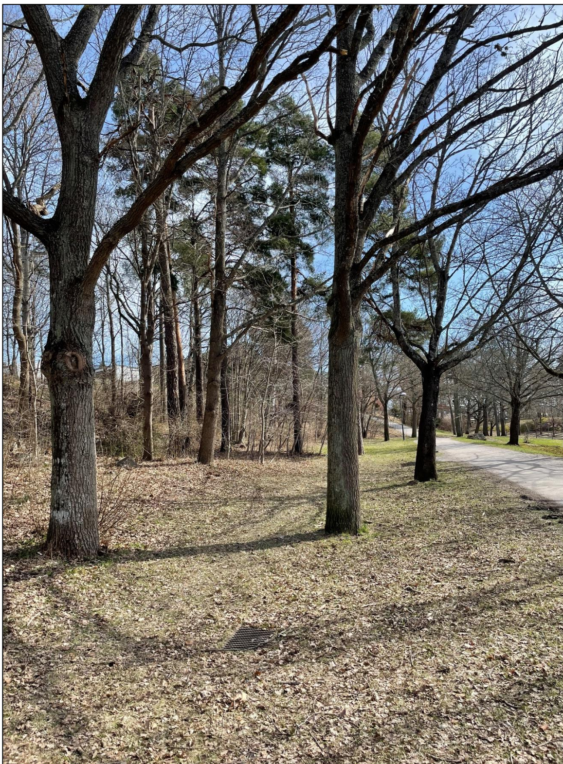
Delområde 2. Den parkartade delen med medelålders lönn och ek samt äldre tall. Till höger anas Några av träderna i den ensidiga lönnallén som kantar gång- och cykelvägen.