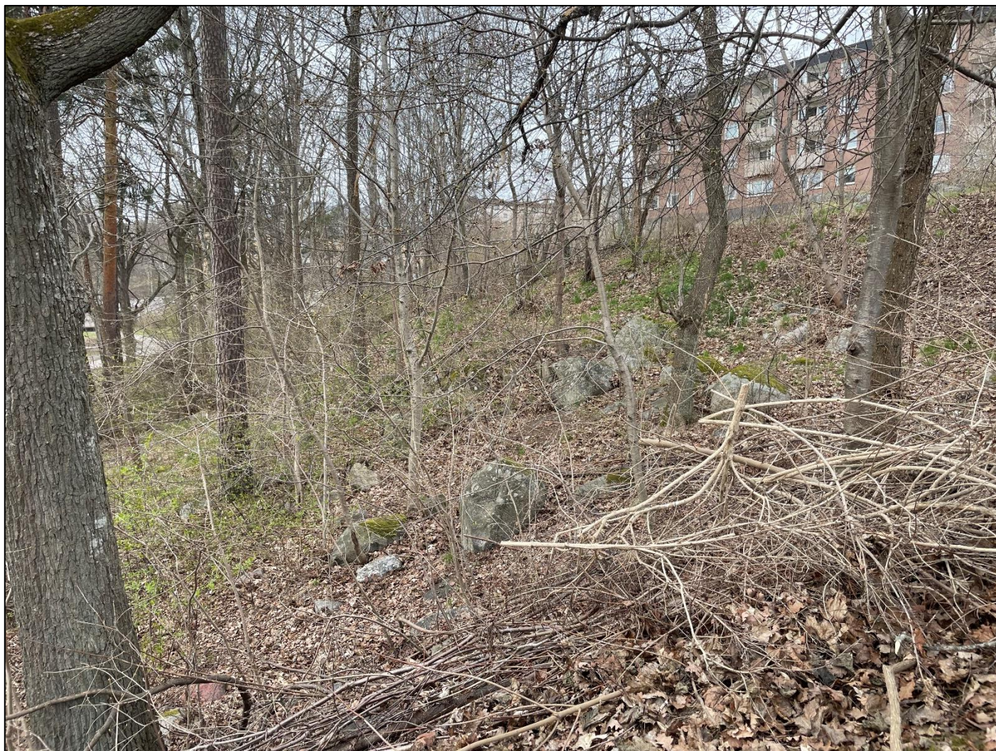
Delområde 2. Den "vilda" backen med sten, unga ädellövträd, asp, ris och äldre tallar.