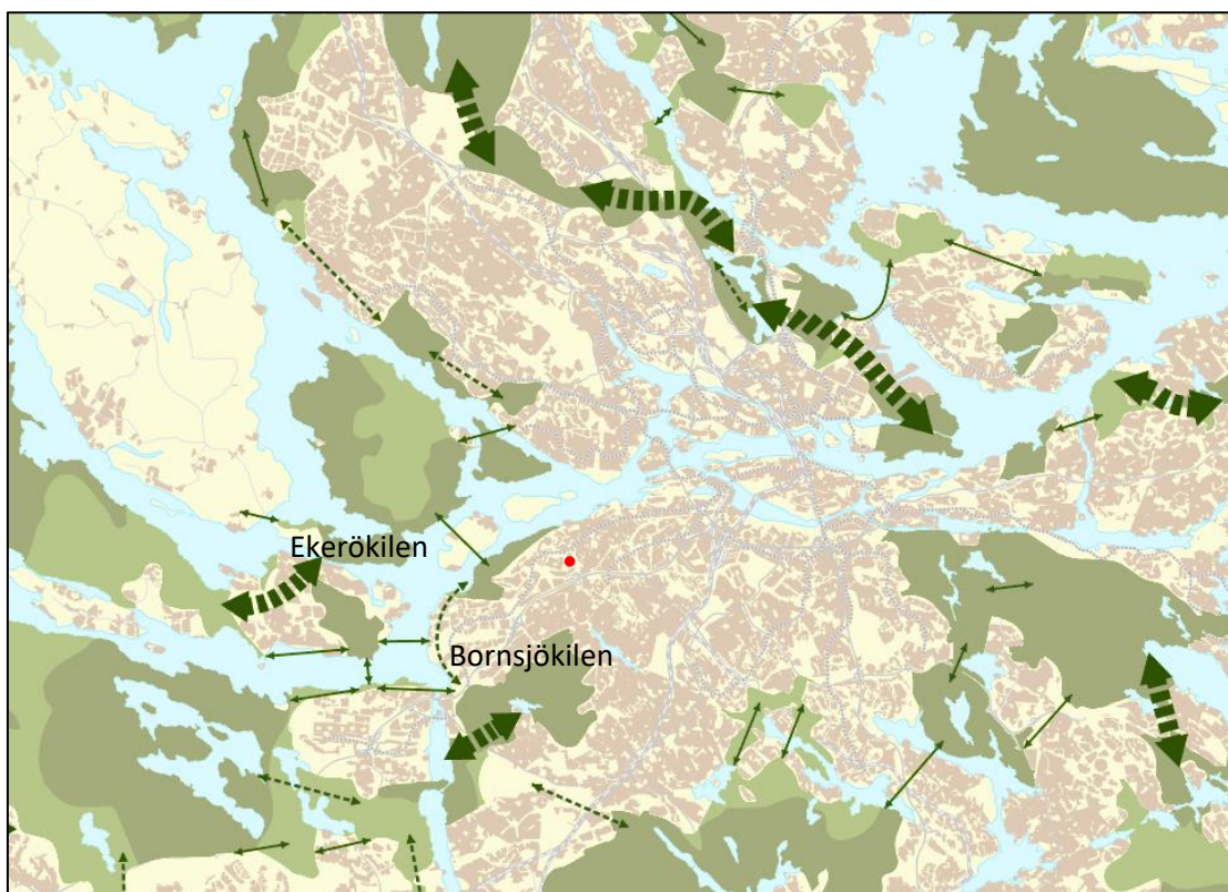
Karta 1. Här syns inventeringsområdets placering (röd prick) i förhållande till de gröna kilarna tydligt. Ekerökilen i väster och Bornsjökilen i söder. Pilarna anger olika typer av svaga samband. Ett visst genetiskt utbyte sker sannolikt mellan inventeringsområdet och Sätterskogens NR. Det långa avståndet och den barriärskapande bebyggelsen gör dock utbytet mycket begränsat. Det samma gäller utbytet med Bornsjökilen.

Inventeringsområdets ädellövskog bedöms ha en begränsad betydelse för spridning till och från Ekerökilen på grund av avståndet och inslag av barriärer som tunnelbana, vägar och bebyggelse.