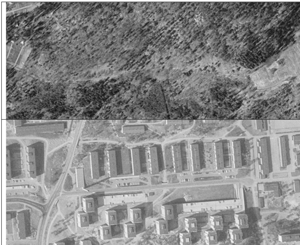
Figur 4 Utsnitt från historiska flygbilder över undersökningsområdet. Den övre bilden är från 1958 och den nedre bilden är från 1971.