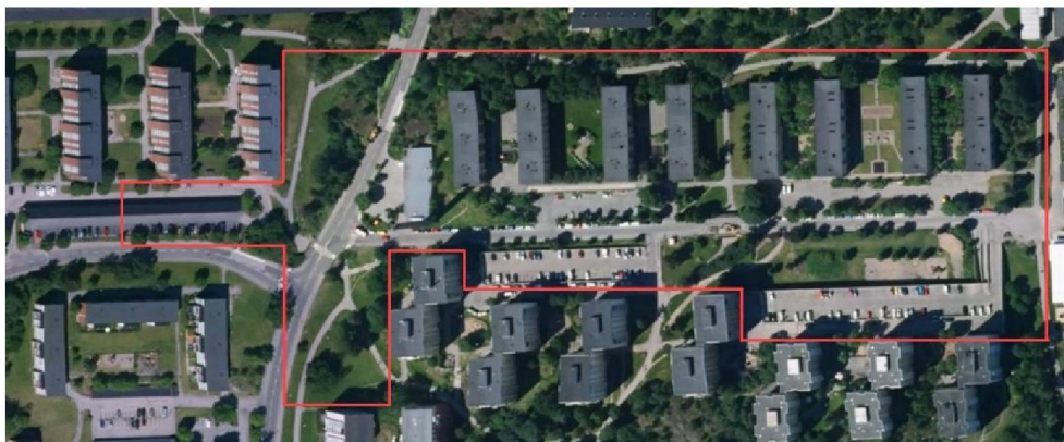
Figur 1 Utbredningsområde vid tidpunkt för undersökning 2018-06-15, Stångholmsbackarna i Vårberg, Stockholms Stad. Undersökningsområdet har efter genomförd geoteknisk undersökning utökats i västra delen till att innefatta hela kvarter Hasselholmen.

Undersökningsområdet ligger direkt norr om Vårbergs centrum och består av kvartersbebyggelse, parkmark och kommunikationsstråk (fig. 1). Området utvecklades på 60-talet i tidstypisk karaktär med lamell- skiv- och punkthus, ringleder för motortrafik, stora parkeringsytor och planlagda öppna grönsytor.