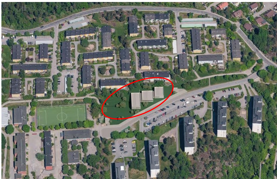
Illustration över den föreslagna förskolan, bestående av grå volymer inringade med rött, enligt planförslaget.