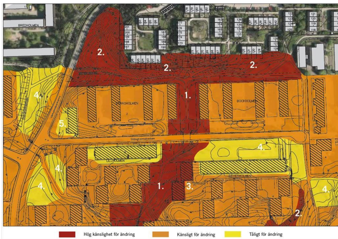
AIX illustration av känslighet respektive tålighet för ändring. Bilden är hämtad ur den kulturmiljöanalys för Stångholmsbackarna som upprättats av AIX 2018-01-26.