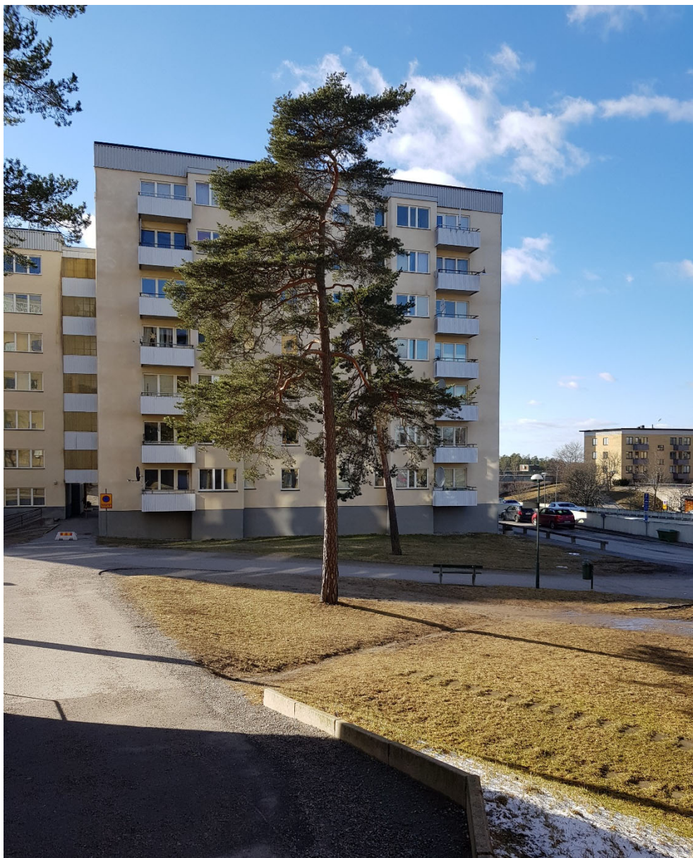
Vy mot bebyggelsen i kvarteret Lillholmen, med ett par av de tallar som finns inom planområdet. Längre bort, till höger i bild, ses ett av husen på fastigheten Stångholmen 2.

skillnaderna i terrängen. Villaområdet i stadsdelen skiljer sig från villaområdena i grannförorterna genom sin placering vid Mälaren, sin storlek och sin tillkomst. Stadsdelen är som helhet mycket lite förändrad. Det har varken rivits, byggts om eller byggts nytt i någon större utsträckning. 3