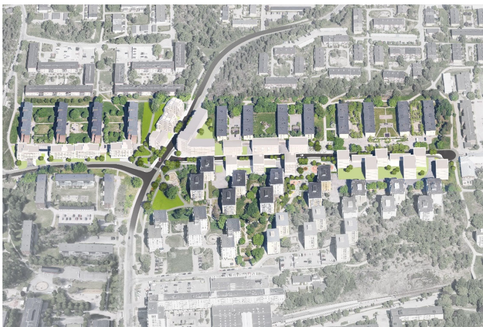
Illustration över den kompletterande bebyggelsen, bestående av vita volymer, enligt planförslaget.

Som underlag för konsekvensbeskrivningen ligger samrådshandlingen med förslag till plankarta och planbeskrivning samt underliggande handlingar, upprättade under första kvartalet 2019.