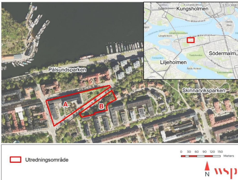
Figur 1. Karta över områdena som inventerades år 2020. Område B ingår inte längre i aktuell detaljplan.

Då område B inte längre ingår i aktuell detaljplan har Stockholms stad efterfrågat ett PM som beskriver de förändrade förutsättningarna samt eventuella ändringar i bedömningarna jämfört med den tidigare NVI:n (mailkommunikation den 30/9 2022).