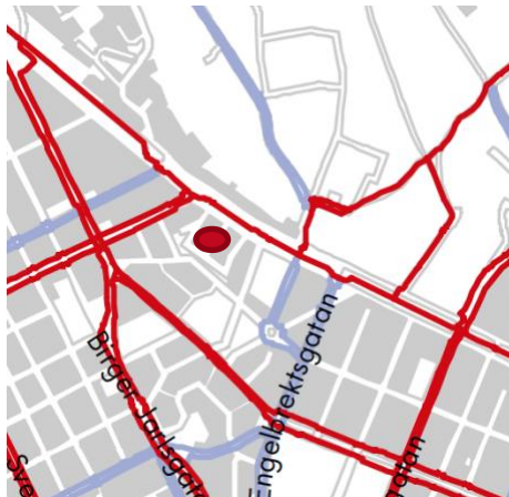
Figur 3: Pendelstråk (rött) och huvudstråk (blått) för cykel.

Cykling sker i blandtrafik på omkringliggande gator men omges av pendelstråk (rött i Figur 3) på Valhallavägen, Odengatan och Karlavägen. Utpekade huvudstråk (blått i Figur 3) löper längs Danderydsgatan/Engelbrektskolan och Drottning Kristinas väg.