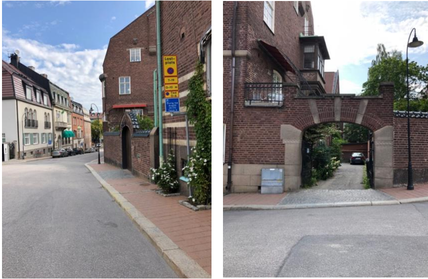
Figur 4: Lastplats på Sköldungagatan 2 t.v. och portik till parkering på Sköldungagatan 4 t.h.