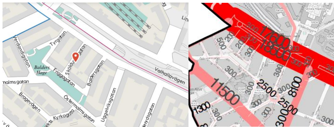
Figur 1: Läge för Sånglärkan 1 t.v. och trafikflöden (Årsmedelvardagsdygn, ÅMVD, 2016) t.h.

Planområdet omfattar del av fastigheten Sånglärkan 1 och avser två byggnader på Sköldungagatan 4 och 6 som idag består av kontor och till viss del av besöksverksamhet i form av en företagshälsövärd. Ytorna utgör ca 2 400 m 2 BTA fördelat lika mellan Sköldungagatan 4 och 6. Inom fastigheten inryms även hotellverksamheten Ett hem beläget på Sköldungagatan 2.