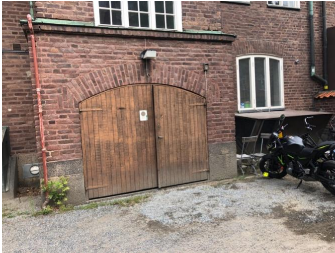
Figur 6: Entré på innergård som byggs om till tillgänglig entré.