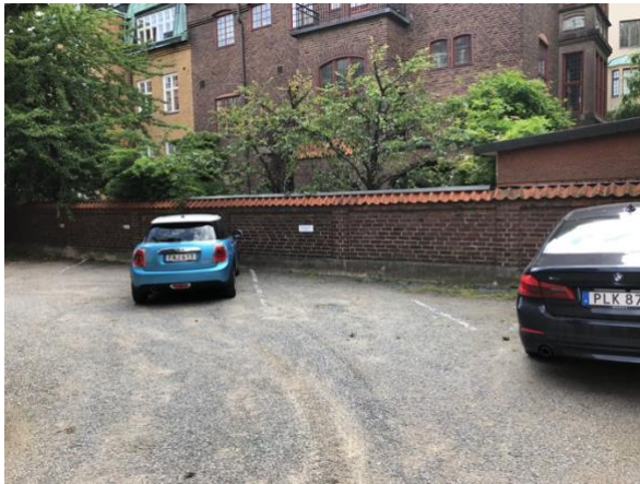
Figur 5: Parkering på innergård vid Sköldungagatan 4.

Det bedömda parkeringsbehovet för kontor och bostäder kan vid behov inrymmas på innergården för Sköldungagatan 4 i samplanering med cykelparkeringen.