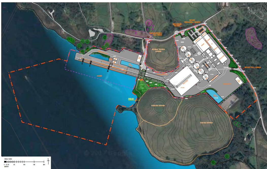
Figur 3. Situationsplan Lövstaverket. Liljewalls arkitekter

Tunga transporter kommer primärt att köra in till området via infart från Lövstavägen. Personalparkering och besökare kommer att ansluta till området via infart från Kyrkhamnsvägen. Det planeras även för två möjliga infartsvägar till hamn och verksamhetsområde från Kyrkhamnsvägen, men primärt kommer anslutning till anläggningen ske via Lövstavägen. Se Figur 3.