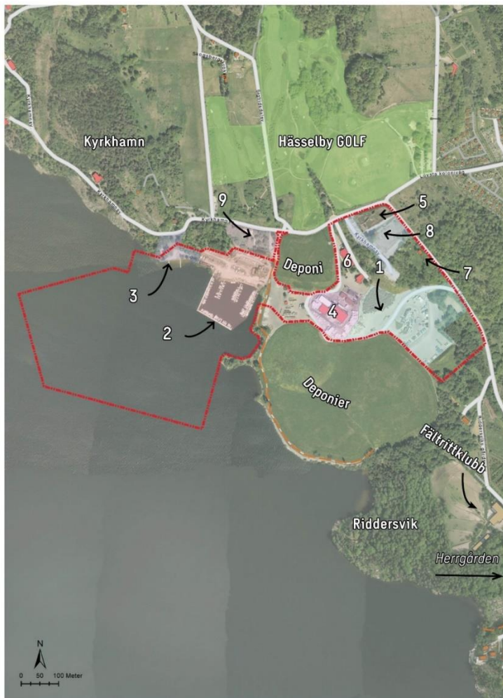
Figur 1: Markanvändning inom och utanför detaljplaneområdet. 1 ÅVC, 2 Båtklubb, 3 Strandbad, 4 Svensk freonåtervinning, 5 Racingbana för radiostyrda bilar, 6 Vagnsverkstaden, 7 Hässelby Byalag, 8 Trafikkontorets driftupplag, 9 Upplag Svevia.