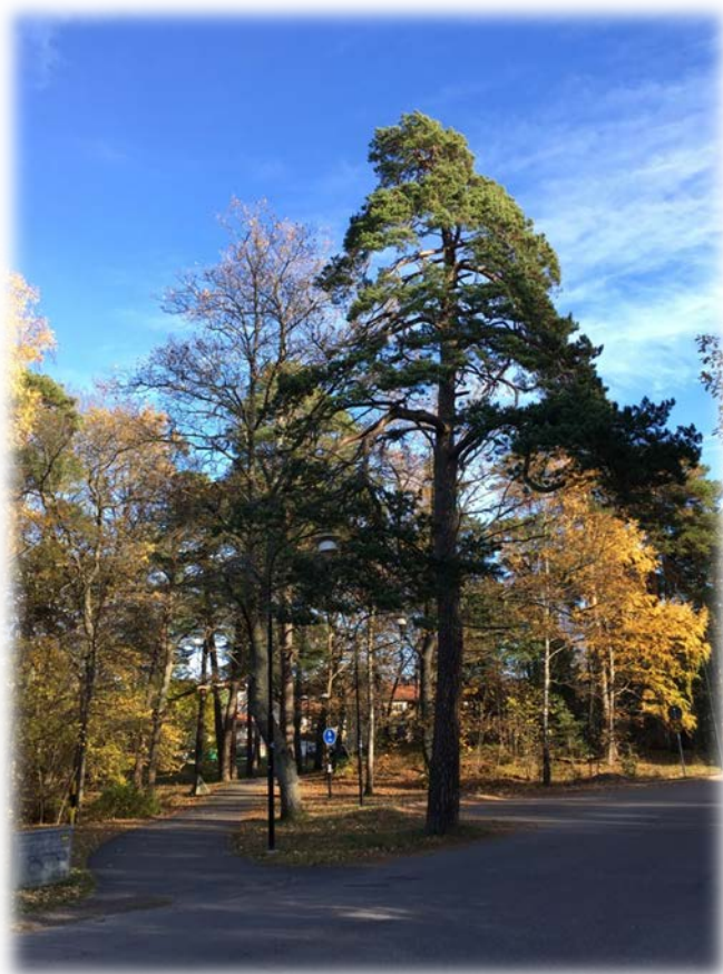
Träd nr 23 & 24

Svartsjö Trädkonsult Nöttesta 30 151 96 Enhörna 0704-90 52 81 cathrine.bernard@telia.com