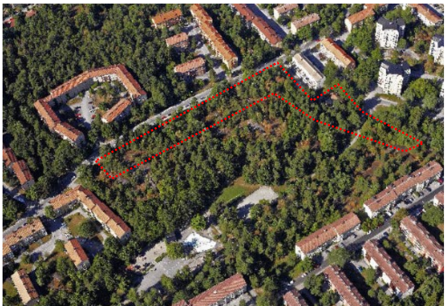
Snedbild över området (SBK 2006). Området markerat med röd streckad linje.