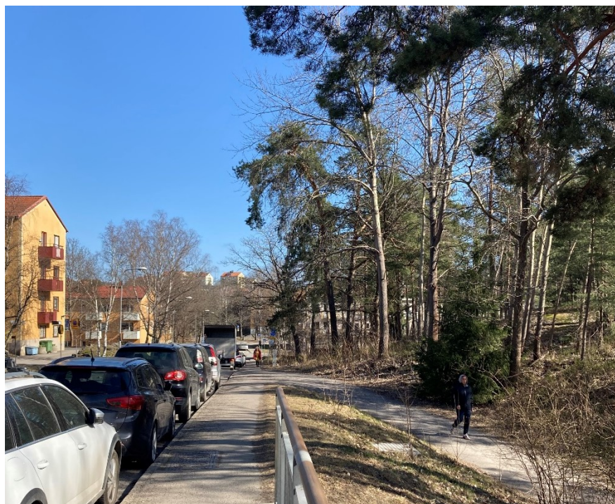
Område för nya bostäder vid Vasaloppsvägen/Terrängvägen. Del av planområdet längs Vasaloppsvägen.

Mot gatorna Vasaloppsvägen och Terrängvägen föreslås nya bostäder i form av lamellhus och/eller punkthus som förhåller sig till den rådande bebyggelsestrukturen. Nya hus placeras mot gata, med baksidor mot naturmark. Befintlig byggnad vid Terrängvägen inom planområdet som idag rymmer daglig verksamhet för vuxna kan prövas för ny bebyggelse som även innefattar bostäder.