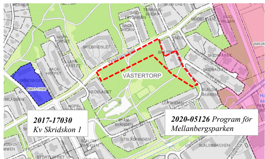
Pågående planer i området. Planområdet är markerat med röd, streckad linje.

I kv Skridskon 1 (dnr 2017-17030) planeras för 50 nya bostäder. Planen har antagits av stadsbyggnadsnämnden men ännu inte vunnit laga kraft.