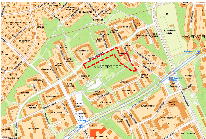
Karta som visar planområdets avgränsning. Området markerat med röd streckad linje.

Planområdet är beläget vid Vasaloppsvägen/Terrängvägen i Västertorp med närhet till Hägerstensåsens och Västertorps tunnelbanestationer och centrum. Området karaktäriseras av starkt kuperad naturmark huvudsakligen bestående av hållmark med blandskog.