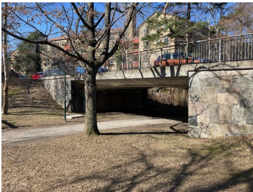
Västertorp utgör ett tidigt exempel på trafikseparering. Här exempel på ett gångstråk i naturmark som passerar under Vasaloppsvägen.

känd för de många skulpturer som placerats ut på torget och i grönområdena mellan husen.