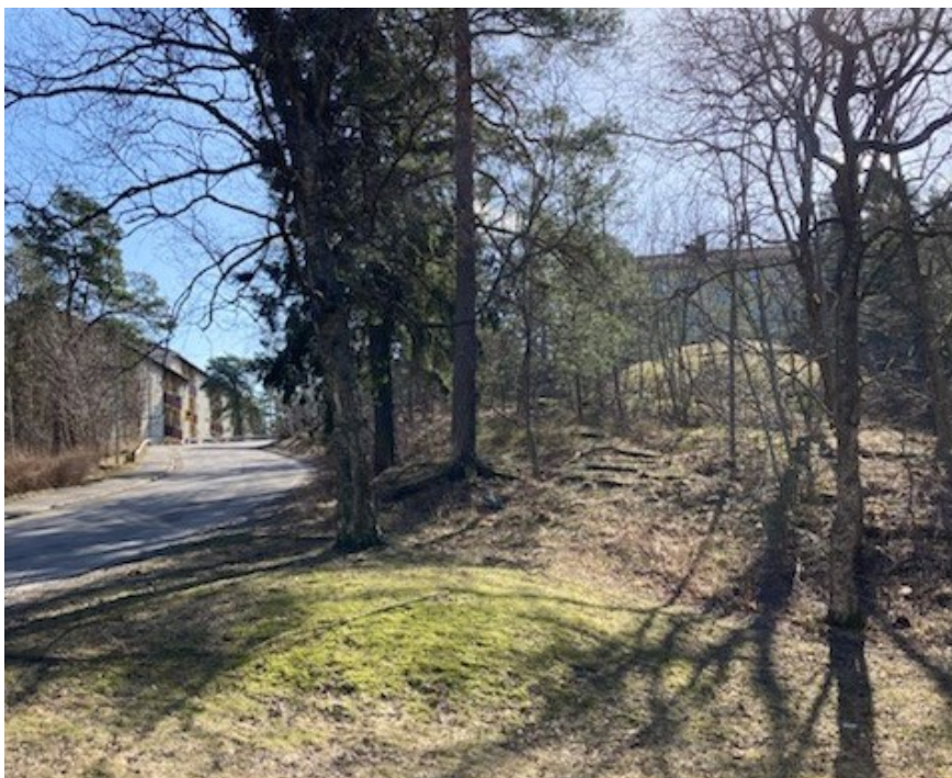
Område för nya bostäder vid Vasaloppsvägen/Terrängvägen. Del av planområdet i sluttning vid Terrängvägen.