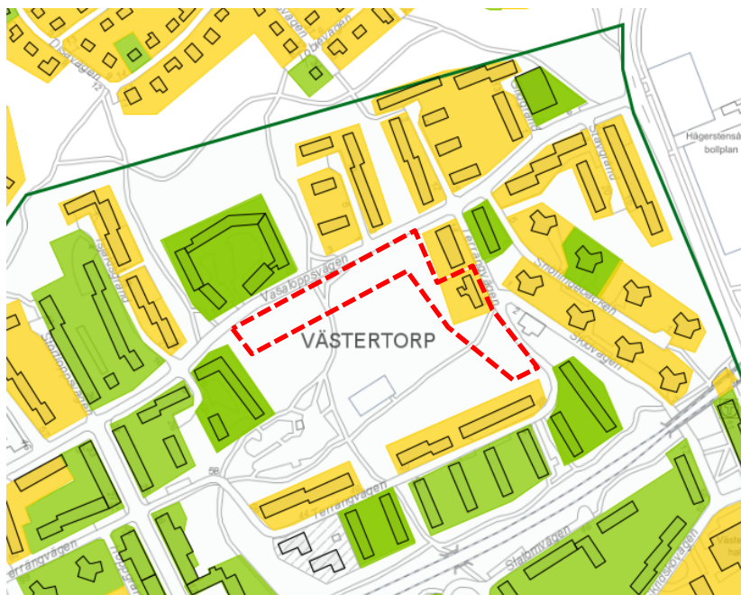
Karta som visar kulturhistorisk klassificering. Planområdet markerat med röd streckad linje.