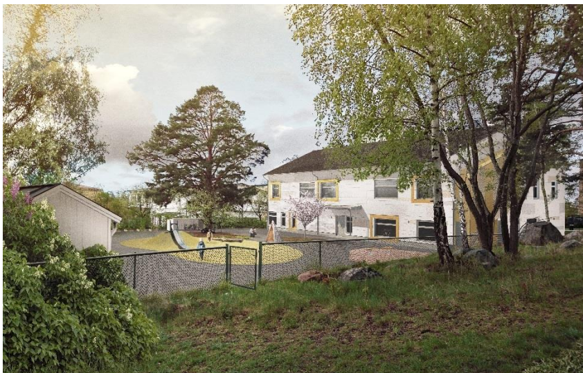
Vy från nordöst från planbeskrivningen över föreslagen bebyggelse (Niras arkitekter).