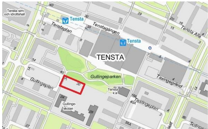
Planområdets läge markerat med röd fyrkant.