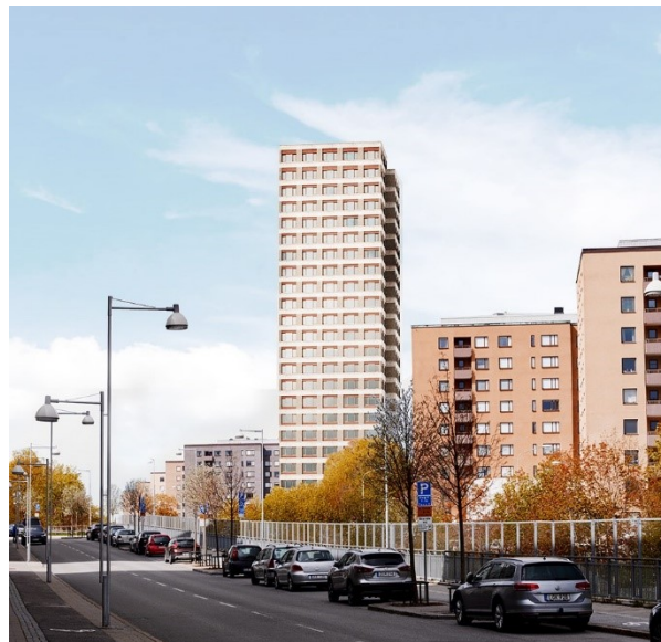
Vy mot väster längs Hägerstensvägen med föreslagen byggnad i 24 våningar. Illustration: Jägnefält Milton.

Vidare föreslås att Selmedalsvägen ligger kvar i befintligt läge och höjd samt att gångtunneln under Selmedalsvägen bibehålls. Ett förbättrat samband mellan Selmedalsvägen och Hägerstens torg utvecklas i den östra delen av planområdet. Utformningen av och innehåll i den höga byggnadens sockelvåningar tillsammans med utformningen av torg- och parkytor samt trapplösningar har stor betydelse för att överbrygga nivåskillnaden mellan gata och torg. Parkstråket längs Hägerstens Allé förlängs fram till korsningen med Selmedalsvägen.