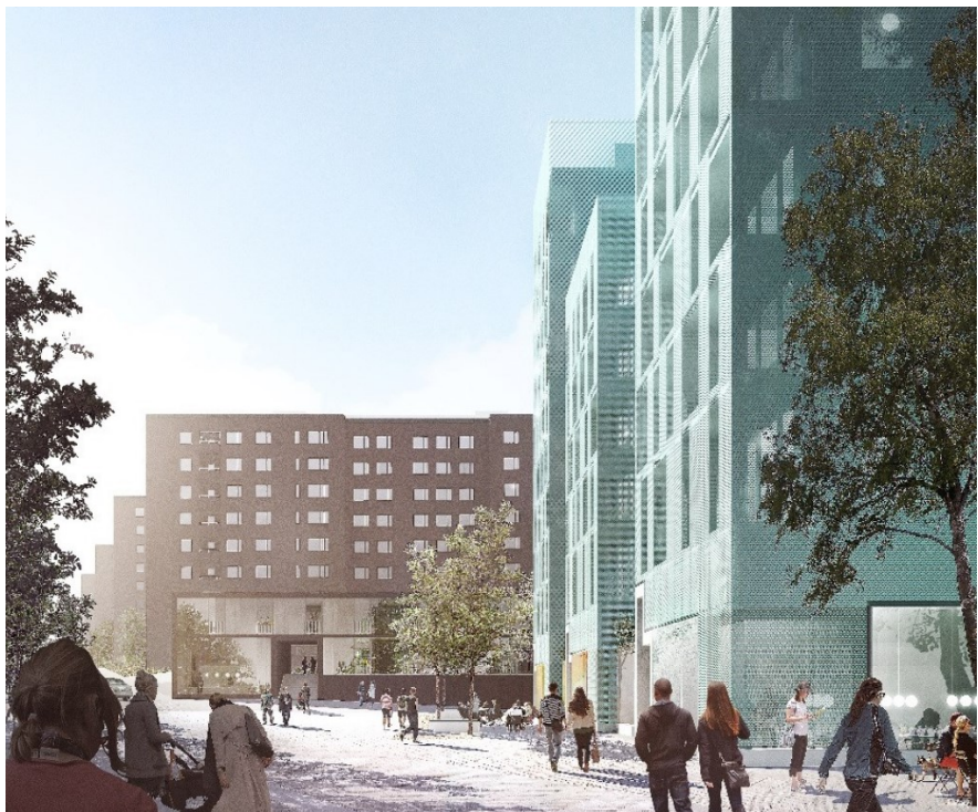
Illustration från samrådsförslaget med ny lågdel inom fastigheten Förgyllda bågaren 8 sedd från torget. Illustration: Joliark

med generösa glaspartier och franska balkonger mot torget och egna entréer från gården via loftgång.