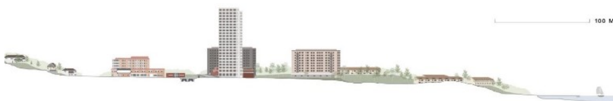
Nord-sydlig sektion genom planområdet med Mälarens vatten till höger i bild och Hägerstensåsens villabebyggelse till vänster i bild. Illustration: Jägnefält Milton