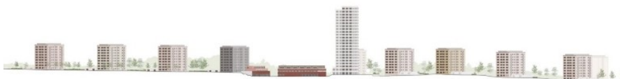
Öst-västlig sektion längs Selmedalsvägen. Illustration: Jägnefält Milton.

Omarbetningen av förslaget innehåller, med en byggnad i 24 våningar, cirka 120 bostäder jämfört med cirka 140 i samrådsförslaget.