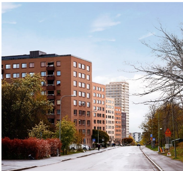
Vy mot öster längs Selmedalsvägen med föreslagen byggnad i 24 våningar längst bort i bild. Illustration: Jägnefält Milton.