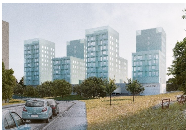
Illustration från samrådsförslaget med ny bebyggelse sedd från torget i söder och från Hägerstens allé i norr. Illustration: Joliark

På fastigheten Förgyllda Bägaren 8 föreslogs den nya lägre byggnaden samspela i färgsättning med det befintliga skivhuset i väst och tillsammans bilda fond till torget. En portik avsågs binda samman torgytan och bostadsgården. Bostäderna föreslogs utformas