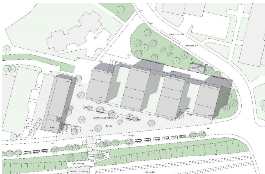
Illustrationsplan tillhörande samrådet med ny bebyggelse inom planområdet. Illustration: Joliark

Fasaderna föreslogs vara uppbyggda av två lager i syfte att skapa luftiga volymer. Det yttre fasadlagret föreslogs utföras i halvtransparent material, exempelvis lackerad sträckmetall. På gavelfasaderna mot öst och väst föreslogs trappor finnas upp till bostadsgårdarna. Balkonger mot torget i söder och mot parken föreslogs vara indragna och ej utkragande ut från fasad.