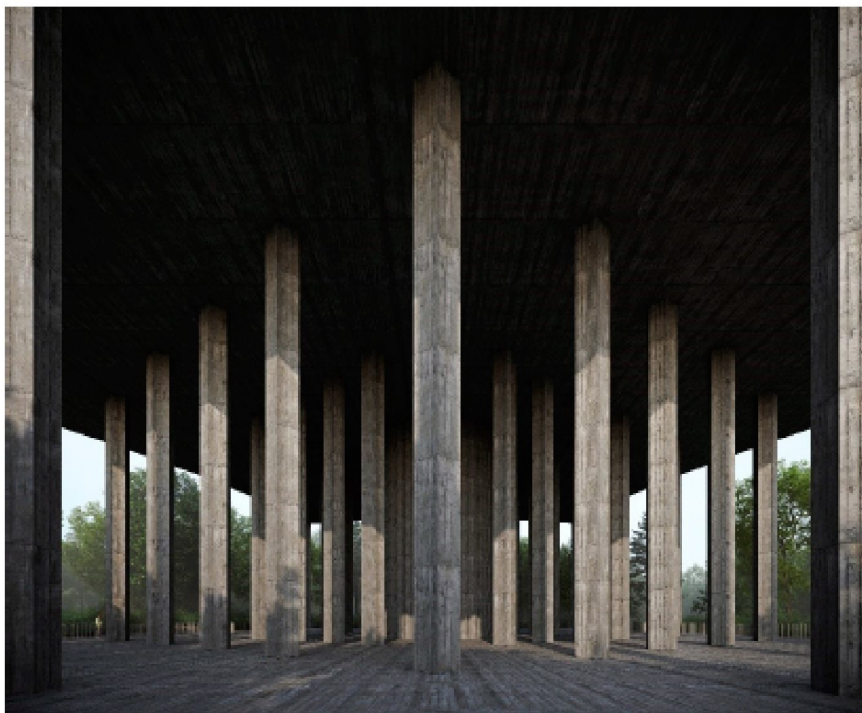
Vattencisternen vilar på ett mittorn omgärdat av en pelarsal. Källa: Wingårdhs Arkitekter

Byggnaden består av tre delar, vattencisternen, pelarsalen och podiet. Vattencisternen vilar på ett mittorn omgärdat av en pelarsal. Byggnaden samspelar med den omkringliggande naturen genom de många pelarna som utgör en suggestiv skog i skogen.