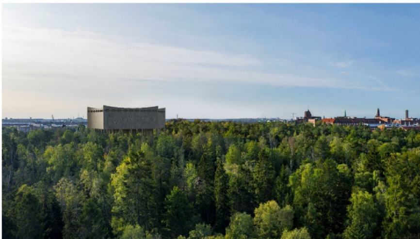
Pentagonformen exponerar flera fasader och de konkava sidorna skapar ett spel mellan ljus och skugga på byggnaden. Drönbild mot sydväst.

Byggnaden består av tre delar, vattencisternen, pelarsalen och podiet. Vattencisternen vilar på ett mittorn omgärdat av en pelarsal. Byggnaden samspelar med den omkringliggande naturen genom de många pelarna som utgör en suggestiv skog i skogen.