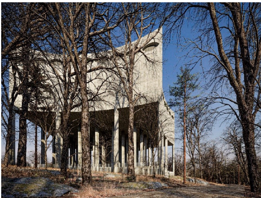
Den nya vattenreservoaren gestaltas med längsgående dekoration i djup relief. I en av dessa håligheter anornas en häckningsplats för berguv.

Byggnaden utförs i betong, gjutna mot brädform. På den övre delen som rymmer vattencisternen ges fasaderna en dekoration i relief. Den djupa reliefen ger byggnaden en detaljering som kan upplevas både på nära och långt håll.