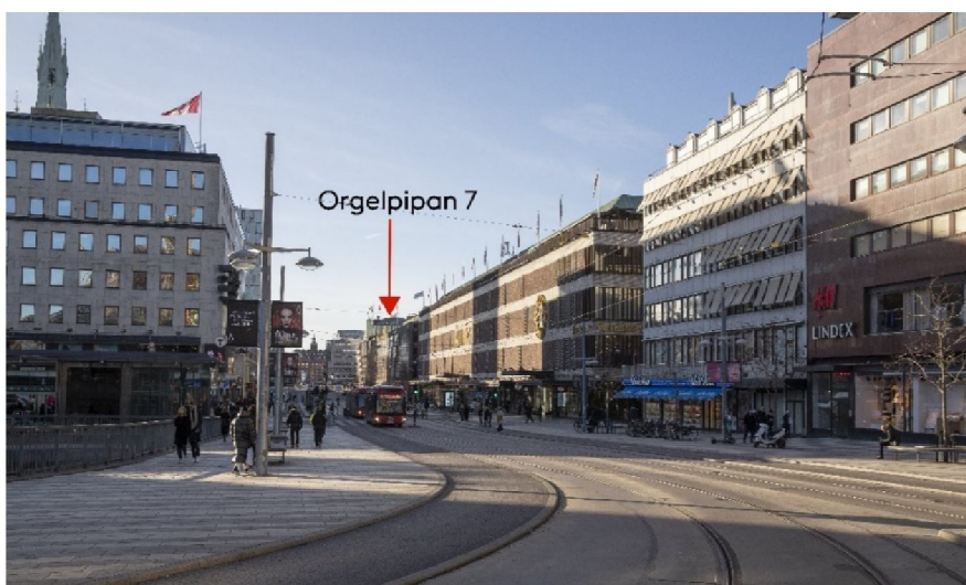
Fastigheten Orgelpipan 7 ligger intill Åhlénshuset mot Vasagatan. Byggnaderna längs Klarabergsgatan är i stort sett oförändrade sen tillkomsten på 1950–60-talen.

I de långa vyerna bedöms byggnaden som helhet smälta in i det modernistiska byggnadsbeståndet längs med Vasagatan. Inga utpekade siktlinjer bedöms påverkas negativt av påbyggnaden. Förslaget har ingen påverkan på befintlig planstruktur av kulturhistoriskt värde. I de nära vyerna, på kvartersnivå, blir förändringen mer påtaglig. Byggnaden blir högre och terrassen med träd mot Mäster Samuelsgatan försvinner.