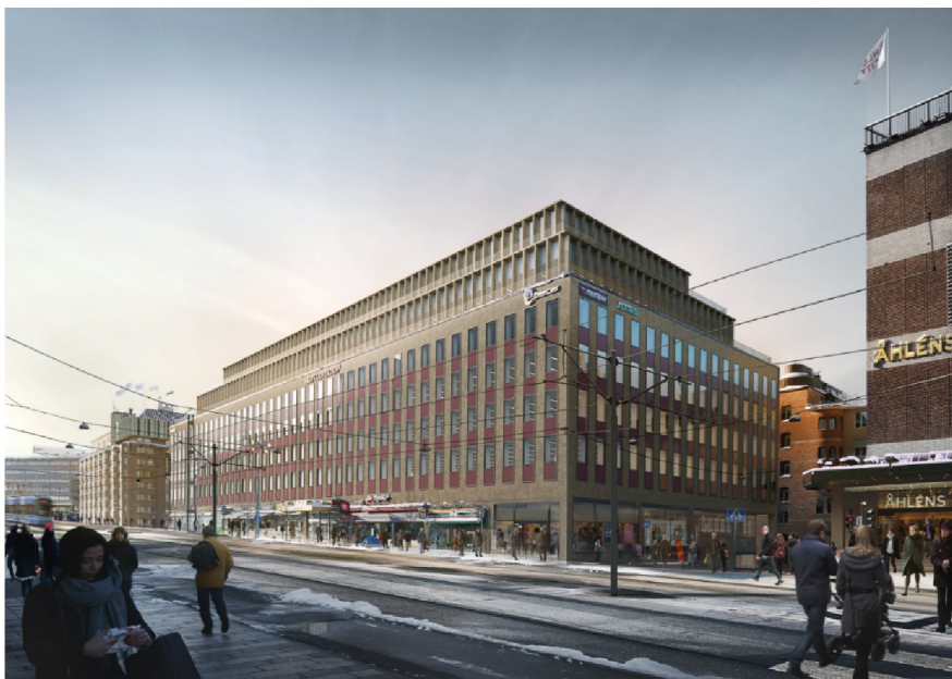
Planförslaget sett från Klarabergsgatan, vy mot nordväst. Arkitekt:

Genom dessa planbestämmelser säkerställs att den föreslagna byggnaden även fortsättningsvis inordnar sig bland de modernistiska byggnaderna på Klarabergsgatan. Planförslaget ger en viss påverkan på upplevelsen i gaturummet i och med att byggnaden blir högre. Det är framförallt Mäster Samuelsgatans gaturum som påverkas.