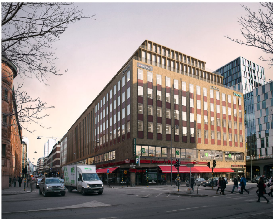
Planförslaget med påbyggd terrass mot Mäster Samuelsgatan, kortsidan mot Vasagatan, samt med två påbyggda indragna kontorsvåningar. Arkitekt: