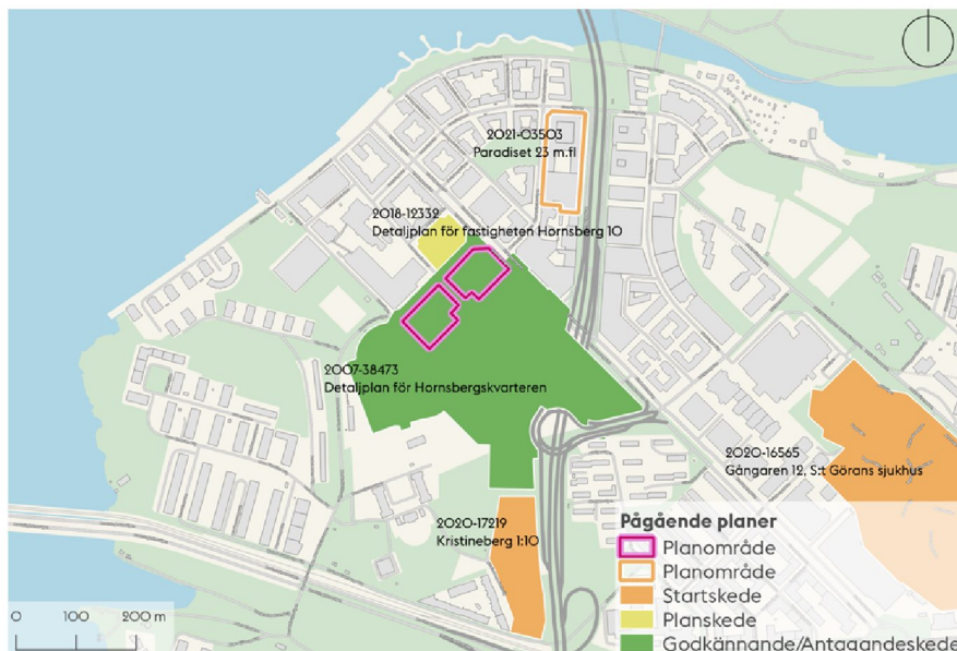
Karta som visar pågående detaljplaner. Planområdets ungefärliga avgränsning, markerad i rosa.