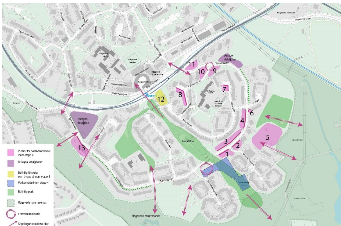
Illustrationskarta med numrerade tomttytor och delar av Rågdalen (markerad i blått) som ingår i den här detaljplanen.