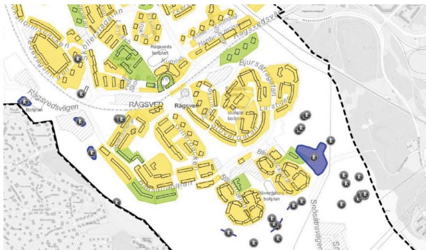
Klassificeringskarta från Stadsmuseet.

Inom ramen för det övergripande arbetet med Fokus Hagsätra Rågsved har en kulturhistorisk analys tagits fram. Analysen redogör bland annat för känsligheten och tåligheten för förändringar. Enligt analysen är områdena närmast Bjursåtravägen mest tåliga för förändringar. Utredningen pekar ut vyn från Perssons betong mot naturreservatet och Högdalstopparna som en betydelsefull vy (nr 5 i kartan nedan).