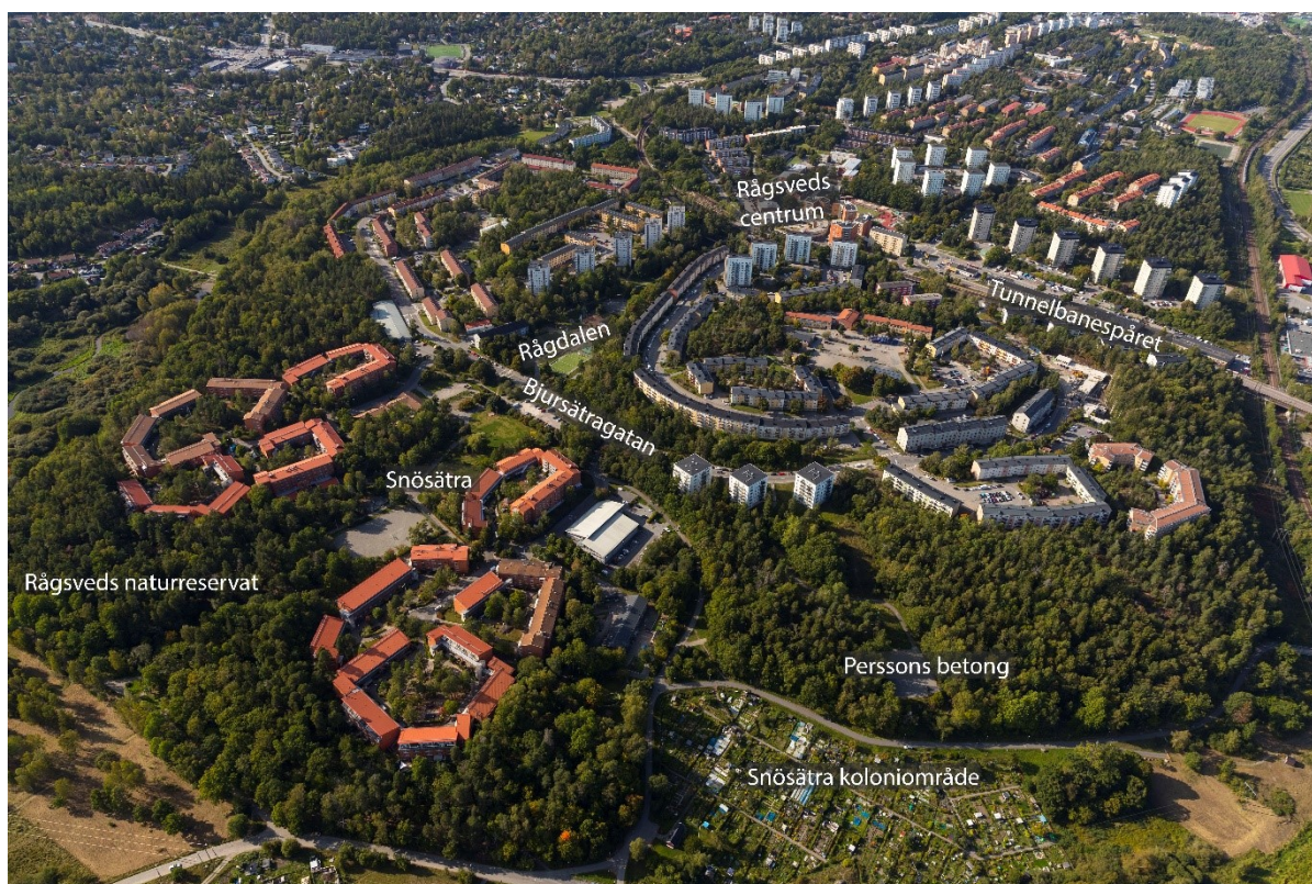
Flygbild över Södra Rågsved.

Längs Bjursätragatan förhåller sig bebyggelsen på olika sätt till gatan och bidrar på så sätt mer eller mindre tydligt till gaturummet. I väster ligger bebyggelsen parallellt utmed gatan. Längs östra delen av Bjursätragatan omgärdas gatan delvis av grönska, men också av en mer brokig bebyggelse bestående av både lameller och punkthus med olika förhållningssätt till gatan. Utmed Bjursätragatan finns idag ett fåtal odefinierade platser som har potential att utvecklas till mer inbjudande platsbildningar. Centralt genom södra Rågsved löper områdets stadsdelspark Rågdalen som kopplar Rågsveds centrum i norr med Rågsveds naturreservat i söder. Kopplingen mellan den norra och södra delen av parkrummet utgörs av en planskild gångtunnel under Bjursätragatan.