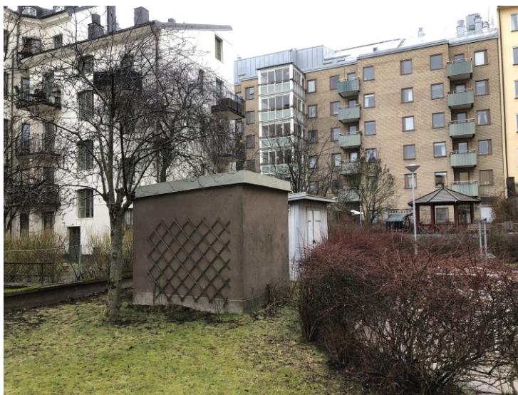
Del av innergården med nödutgång från garage samt förråd.