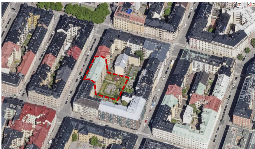
Snedbild över kvarteret och närliggande kvarter. Planområdet markerat med streckad röd figur.