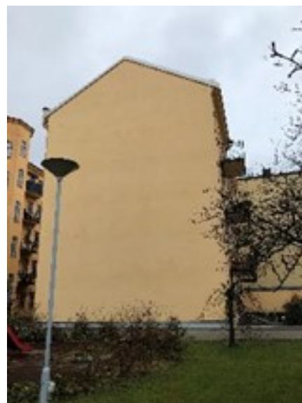
Till höger: Befintligt gårdshus på grannfastigheten Kumlet 15. I förgrunden, del av innergården på Kumlet 23, med bland annat lekplats.

Innergården utgörs av öppna ytor med gräs, mindre träd och buskar. En mindre lekplats samt bänkar och bord finns för fastighetsens behov. Gården nyttjas också för cykelparkering. Kumlet 15 som gränsar till planområdet i norr, har ett gårdshus som ligger i gränsen mot Kumlet 23.