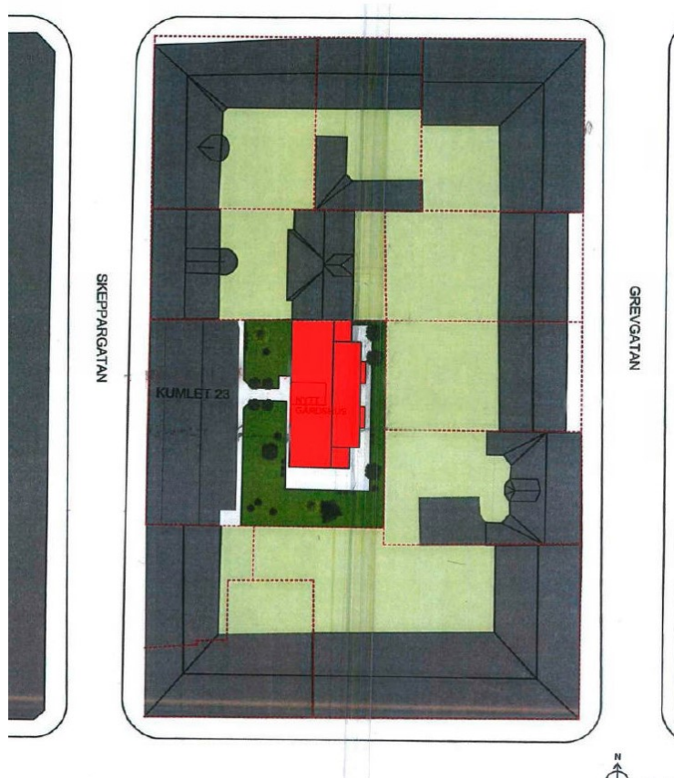
Föreslagen placering i planansökan. Illustration: Strategisk arkitektur

Placering av den föreslagna gårdsbyggnaden ska anpassas till angränsande fastigheter. Placering kan antingen ske i