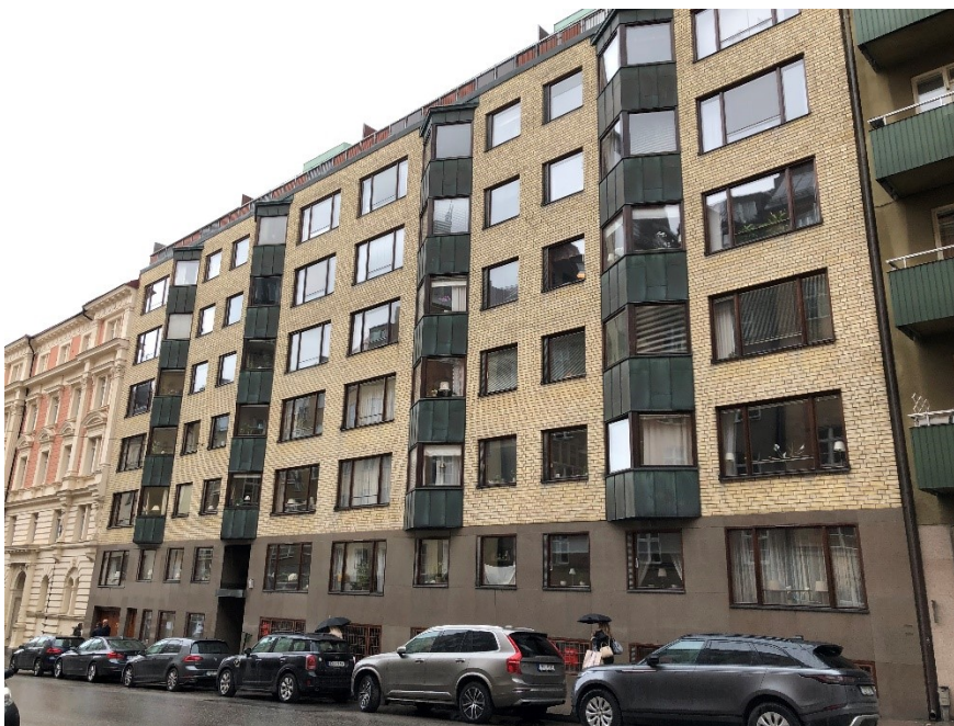
Fasad mot Skeppargatan.

Kvarteret Kumlet är ett slutet kvarter inom stenstaden, med varierad arkitektur och bebyggelse uppförd från 1884 till 1969. Gatuhuset på Kumlet 23 är uppfört 1968. Byggnaden är en tidstypisk tegelbyggnad i gult tegel, med en hög sockel mot gatan. Översta våningen är indragen från gatan. Mot innergården i öster finns lägenheternas balkonger.