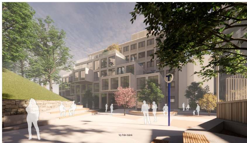
Vy från tunnelbaneentrén (DAP).

Ett plangenomförande skulle innebära att befintlig byggnad byggs till mot söder med en ny volym i två till fem våningar i terrassering. Partier på byggnaden är utskjutande för att skapa rumsligheter. Tillbyggnaden vänder sig mot entrén till Gärdets tunnelbanestation och kommer att utgöra en ny huvudentré till skolan, samt inrymma undervisningslokaler och administrativa funktioner. Denna del föreslås få en publik utformning som tydligt signalerar vilken verksamhet som pågår i byggnaden. Den nordvästra tillbyggnaden blir fem våningar varav en är i suterräng.