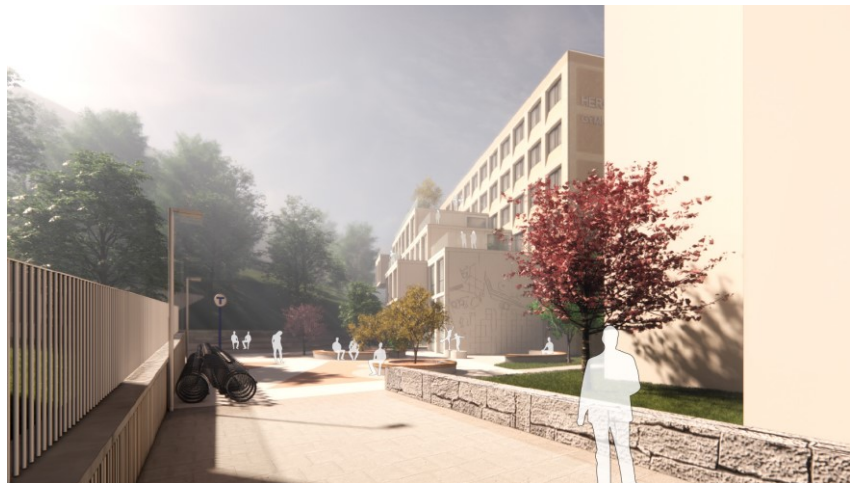
Vy från Värtavägen (DAP).

Gestaltningen av entréplatsen är viktig då det är en plats som passeras av många dagligen. Markbeläggning utanför entrén föreslås harmonisera med markbeläggningen mot tunnelbanan. Avsikten är att skapa en öppen miljö mellan huvudentré och Gärdets tunnelbanestation.