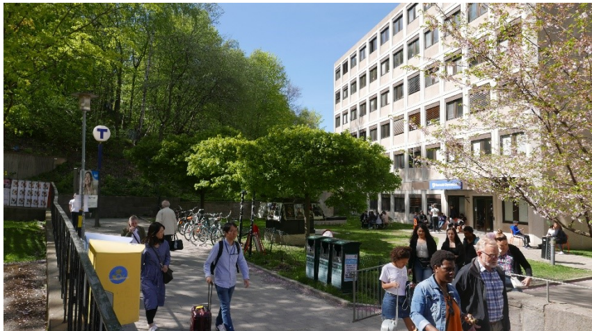
Verksamhetens entré mot tunnelbanestationen.

Prövning av en åtgärd i områden som gränsar till Nationalstadsparken ske med utgångspunkt från att parkens natur- och kulturvärden, som inte får utsättas för skada genom åtgärder. Gränsen för Nationalstadsparken går endast marginellt in i planområdet.