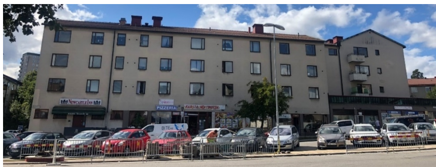
Gatuvy från Lysviksgatan mot kvarterets östra fasad med lokaler i bottenplan och hårdgjord förgårdsmark, som tillsammans formar en liten lokal centrumplats. (Bild: Vardag arkitekter)

1955 antogs en ny generalplan för Farsta, ritad av Sven Markelius. Planen har ABC-staden som utgångspunkt – en förort med arbetsplatser, bostäder och centrum inom samma område. Farsta är idag en blandad och bitvis kontrastfull stadsdel där upplevelsen i stor utsträckning fortfarande präglas av 1950- och 1960-talens planering. Förutom ett växelspel mellan stad och natur finns en stor variation av byggnadstypologier, upplåtelseformer och bebyggelsestrukturer. Det direkta närområdet präglas av en öppen eller halvöppen byggnadsstruktur som tar hänsyn till topografi och landskap. Bebyggelsen domineras av lamellhus i tre till fyra våningar med sadeltak samt lamellhus i fem till sex våningar med platta tak.