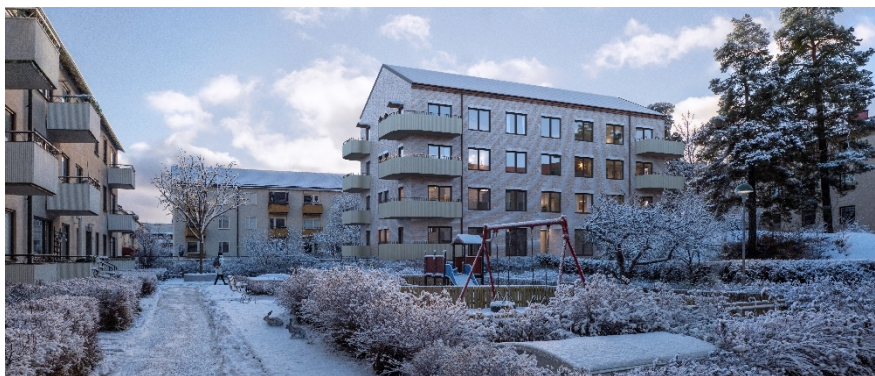
Planförslagets nya gårdshus sett från befintlig gård i norr. (Bild: Vardag arkitekter)