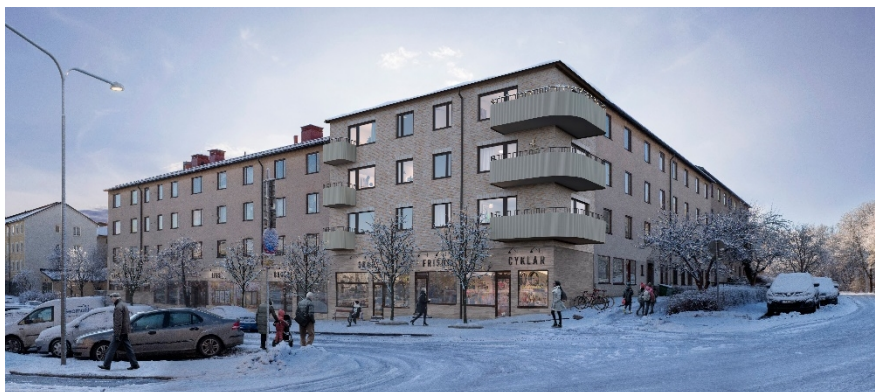
Planförslagets tillbyggnad i befintligt kvarters hörnindrag mot Lysviksgatan i norr.

Gårdshuset placeras tvärställt med förskjutning mot befintlig huslänga mot Lysviksgatan i öster för att ansluta till liknande planmönster i området, där tvärställda förskjutna volymer är ett återkommande tema. Placeringen har också gjorts för att dels spara