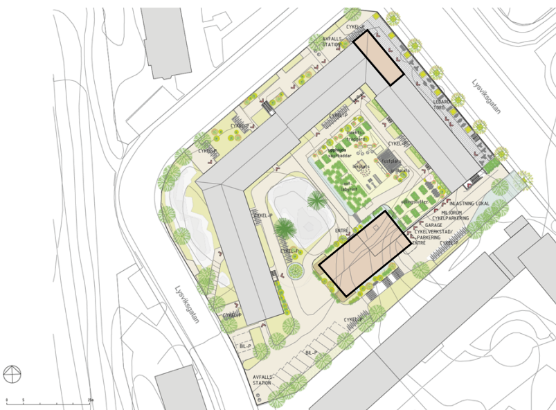
Situationsplan som redovisar den nya gårdsmiljön och placeringen av det nya gårdshuset i suterräng mellan gårdsnivån och garageentréns nivå, samt tillbyggnaden i kvarterets norra hörn mot Lysviksgatan. (Bild: Vardag arkitekter)

Planförslaget innebär att cirka 20 nya bostäder skapas genom nybyggnation av ett gårdshus i fyra våningar och en tillbyggnad i det norra hörnet av kvartersbebyggelsen mot Lysviksgatan. Bostäderna avses upplåtas med hyresrätt. Föreslagen gestaltning är en lågmäld samtida tolkning av den befintliga bebyggelsens kvaliteter och särdrag.