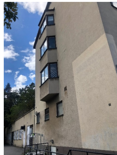
Bilder från bebyggelsen. Till vänster: vy mot gården. Till höger: vy mot infarten till garaget i den underbyggda gårdsdelen. (Bilder: Vardag arkitekter)