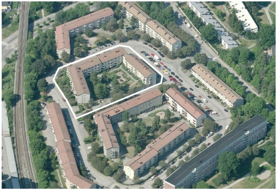
Vy från söder. Planområdet markerat med vit linje.