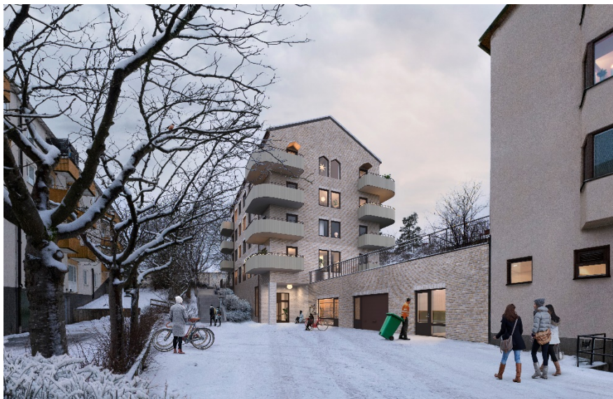
Planförslagets nya gårdshus sett från den nedre entrénivån mot öster med planerad ny trappkoppling utmed byggnadens fasad. (Bild: Vardag arkitekter)