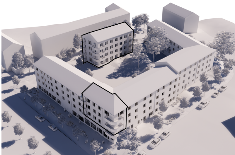
Illustration som visar befintligt kvarter samt föreslagen ny bebyggelse markerad med svart linje för gårdshuset och tillbyggnaden i kvarterets norra hörn. (Bild: Vardag arkitekter)