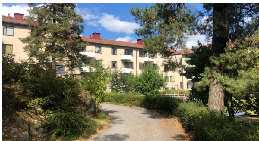
Vy från gårdsrummet med sparad natur till vänster i bild och underbyggt gårdsbjälklag till höger. (Bild: Vardag arkitekter)