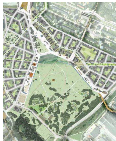
T v: Det vinnande förslaget "Arkipelag" av Archi5, Michel Desvigne och Elioth/Iosis 2009.