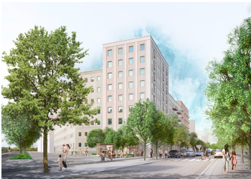
Kvarter K sett från huvudgatan. Illustration: Semrén Månsson Arkitekter

Kvarteret får sin trekantiga form utifrån huvudgatans sträckning i norr, Huddingevägen i öster och skolgården i väster. Dessa tre stadsrum har helt olika karaktär och funktion vilket också avspeglas i kvarterets gestaltning avseende skala, materialitet och grad av detaljering.