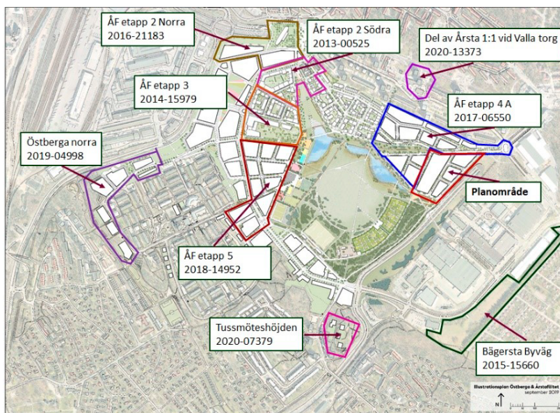
Karta över planområdet och närområdet med pågående planprojekt.

I Östberga pågår detaljplan för del av Årsta 1:1 vid kvarteren Familjen och Ättegrenen, Östberga Norra, dnr 2019-04998. På Valla gårde pågår detaljplan för del av fastigheten Årsta 1:1 område vid Valla torg, dnr 2020-1337 och i Enskede pågår detaljplan för Bägersta Byväg, del av Enskede Gård 1:1, dnr 2015-15660.