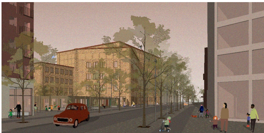
Perspektiv från öst. Max arkitekter