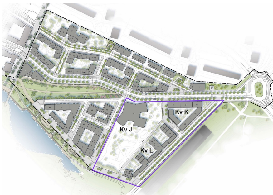
Kvartersindelning etapp 4b. Illustration: AJ Landskap

Bostadskvarteren placeras parallellt med Huddingevägen och grundskolan placeras väster därom. Placering av skolan alldeles intill den stora parken möjliggör att skolelever kan nyttja parken för lek och rekreation.