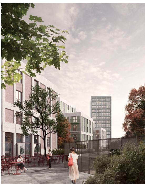
Kv L. Perspektiv på den västra fasaden. Illustration HHL Arkitekter

Mot Årstafältets parkrum reser sig kvarteret som ett torn med 14 våningar, som ansluter till parkfronten och skapar ett landmärke i fonden av Huddingevägens siktlinje.