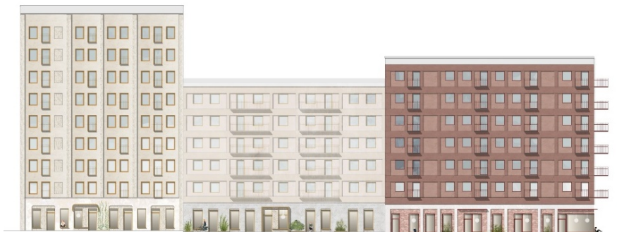
Fasad mot huvudgatan. Illustration: Semrén Månsson Arkitekter

Kvarterets byggnader varierar mellan fem och nio våningar där arkitekturen tar hänsyn till anslutande bebyggelse och håller samman sin utformning mot de olika gatornas karaktär. Skalan föreslås vara högst mot entrén till huvudgatan och lägst mot skolan i sydväst, vilket också ger bättre ljusförhållanden på bostadsgården.